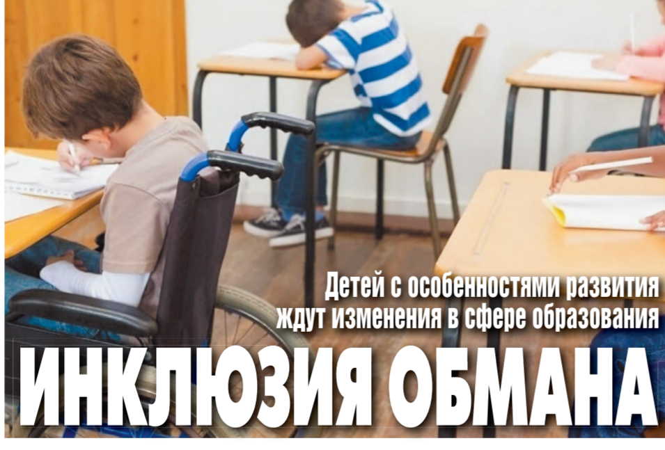
Детей с особенностями развития ждут изменения в сфере образования

Инклюзия, то есть возможность «не таким» детям учиться вместе со сверстниками, история будто бы нишевая. Но те, кого она так или иначе касается, никогда не станут ее недооценивать.