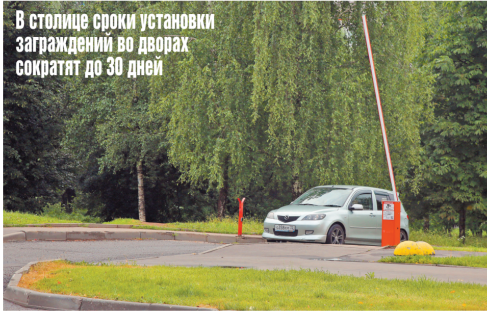
В столице сроки установки ограждений во дворах сократят до 30 дней

— это неправильно, хотя не столь критично, когда свои машины оставляют горожане или приезжие из области из-за близости двора к метро.