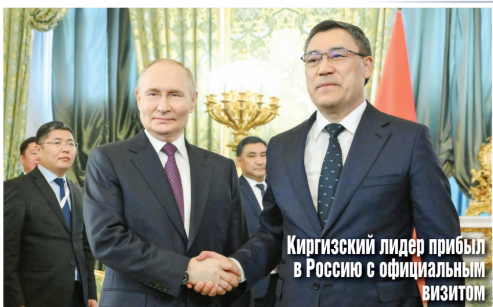
Киргизский лидер прибыл в Россию с официальным визитом

Владимир Путин и Садыр Жапаров на переговорах в Кремле обсудили использование русского языка в Киргизии. По Конституции КР он имеет статус официального, однако накануне визита киргизского лидера местный парламент проголосовал за ужесточение языковой политики.