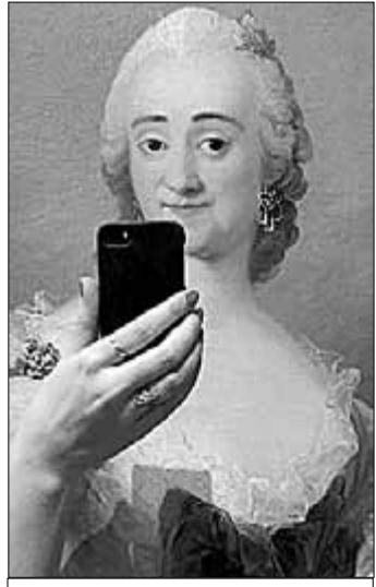
● Да, как хороша!.. Новое увлечение «продвинутой» молодёжи: селфи в музее.

Согласно докладу Российской ассоциации электронных коммуникаций (РАЭК), объём экономики Рунета (российского сектора Интернета) в прошлом году составил чуть меньше 1,5 триллиона рублей, то есть практически 2% от ВВП России. Ежемесячная аудитория интернет-пользователей в России старше 18 лет составляет 66 миллионов человек. Таким образом, по объёму аудитории мы занимаем первое место среди европейских стран. Также специалистами Высшей школы экономики удалось выяснить, что 96,6% россиян в возрасте от 18 до 24 лет пользуются Интернетом ежедневно.