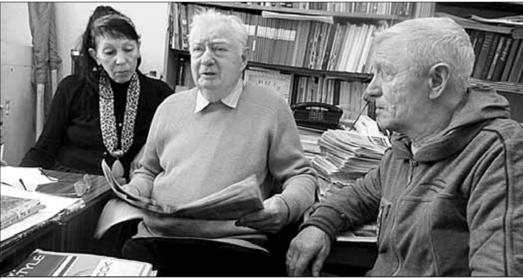
На этом снимке, присланном в дополнение к тексту, автор статьи (в центре) беседует с товарищами об очередных публикациях «Правды», вызвавших наибольший интерес в районном партийном отделении.