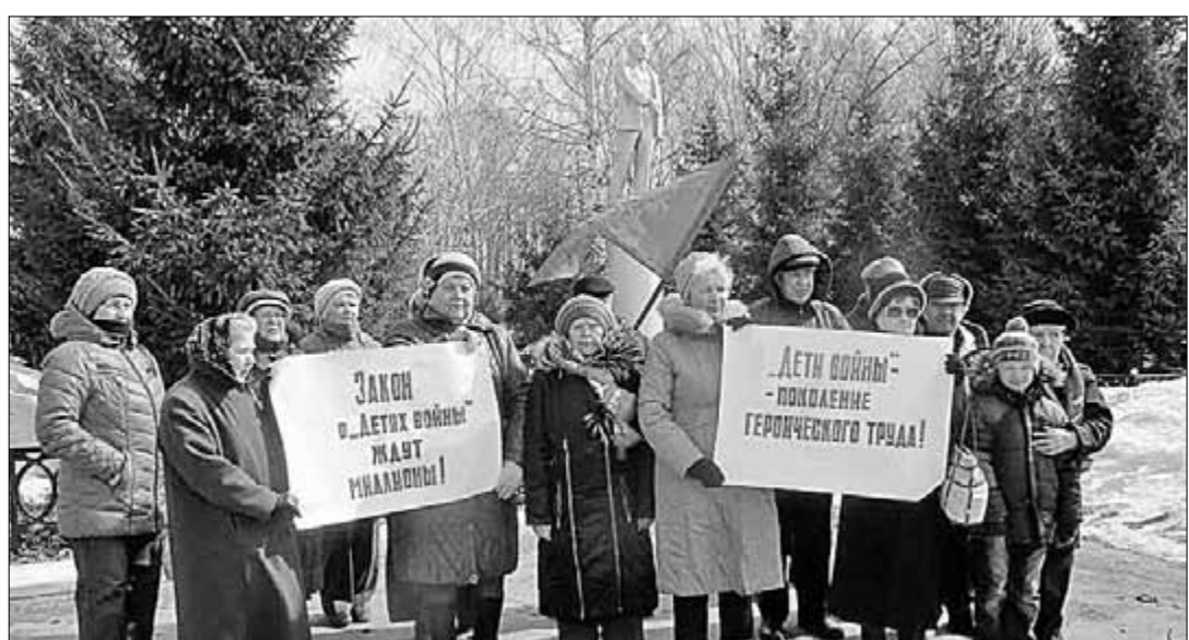
Независимый профсоюз в действии

В селе Лямбирове, что в Мордовии, коммунисты провели пикет в поддержку федерального закона о «детях войны», внесённого фракцией КПРФ на рассмотрение Госдумы. Они также детально обсудили проблемы здравоохранения и ЖКХ в своём районе.