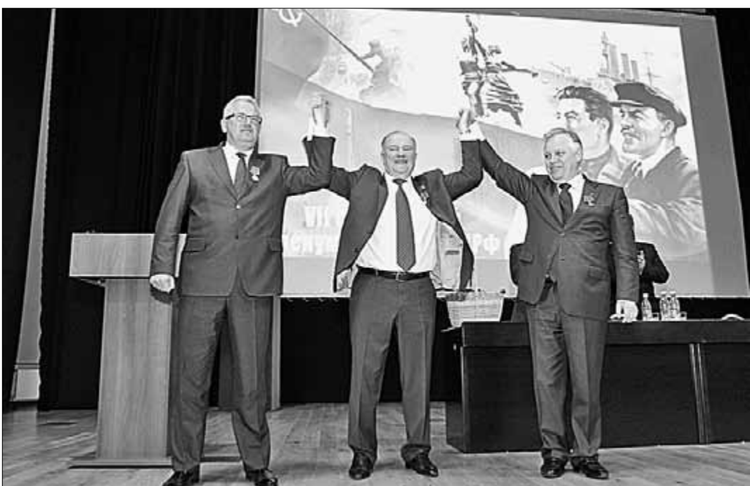
● Единство братских партий (слева направо: первый секретарь ЦК Коммунистической партии Белоруссии И.В. Карпенко, Председатель ЦК КПРФ Г.А. Зюганов, первый секретарь ЦК Коммунистической партии Украины П.Н. Симоненко).

люди вышли с российским флагом и бюстом Ленина, и она проходила под лозунгом «Россия и Ленин, спасите нас!»