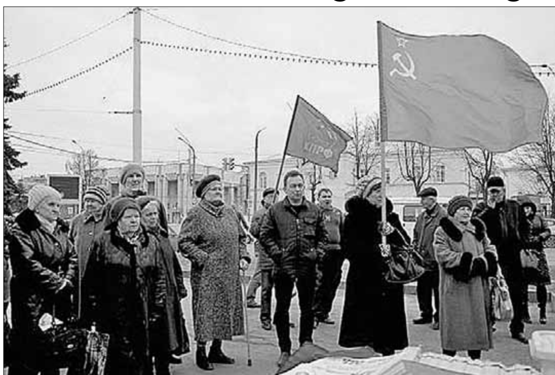
жизнь впроголодь в подвалах, инфекционные заболевания у детей — вот чем обернулась для юго-востока Украины ликвидация Советской власти. Так через 70 лет после окончания Великой Отечественной фашизм вновь убивает. И вина за это лежит на всех, кто прямо или косвенно предал СССР, страну — победительницу фашизма.

«Капитализм — на свалку истории!» — под таким лозунгом вышли на Октябрьскую площадь Костромы коммунисты. О невозможности нормально жить при этом строе, при этой власти говорили пришедшие на митинг горожане.