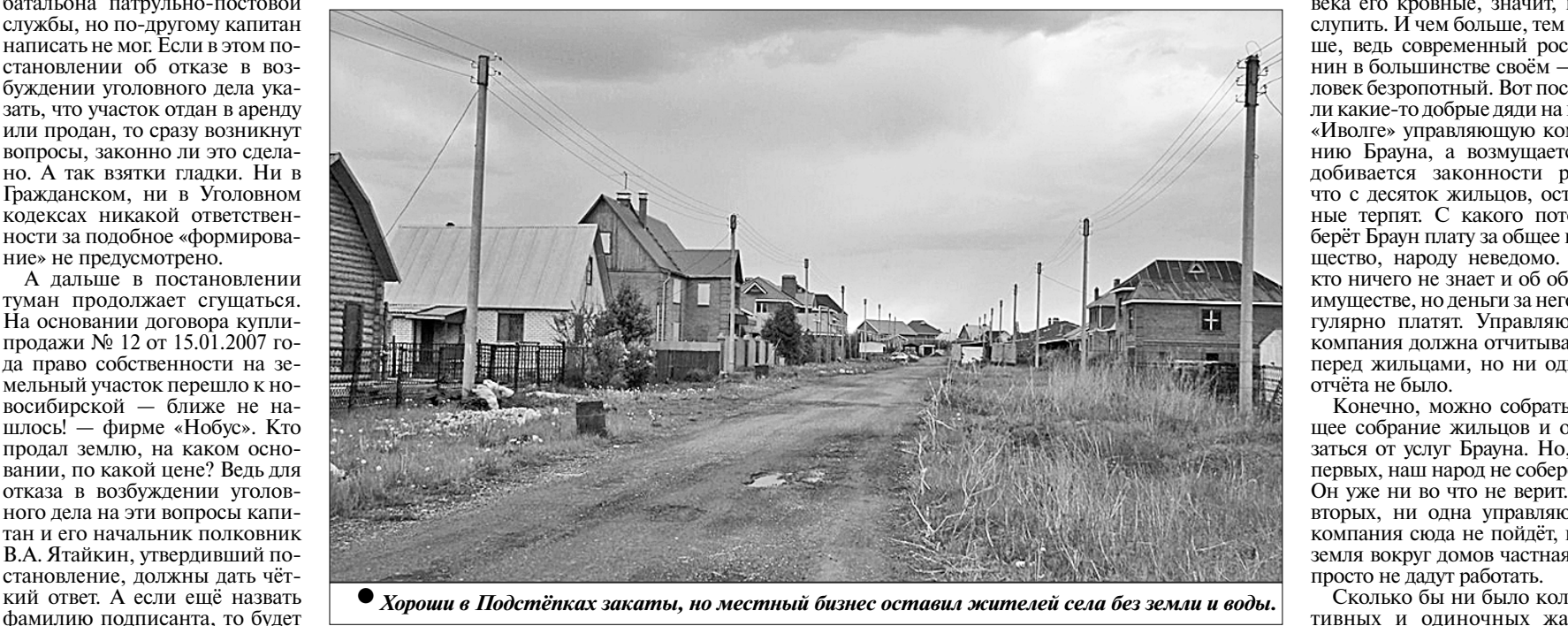
Хороши в Подстёпках закаты, но местный бизнес оставил жителей села без земли и воды.