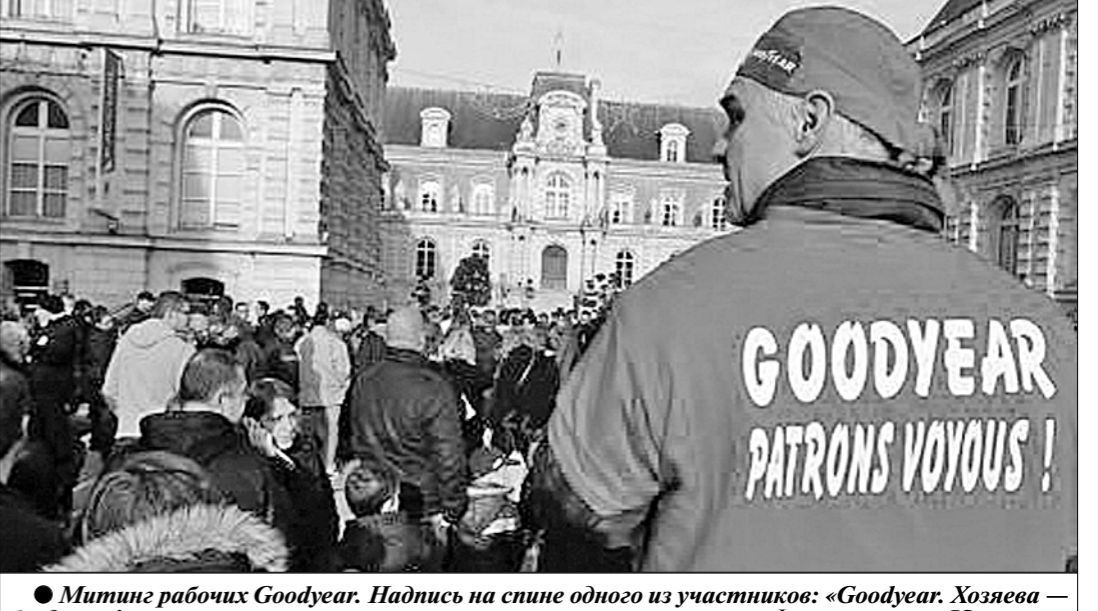
Митинг рабочих Goodyear. Надпись на спине одного из участников: «Goodyear, Хозяева — бандиты!»

С требованием отмены этого решения и полной амнистии