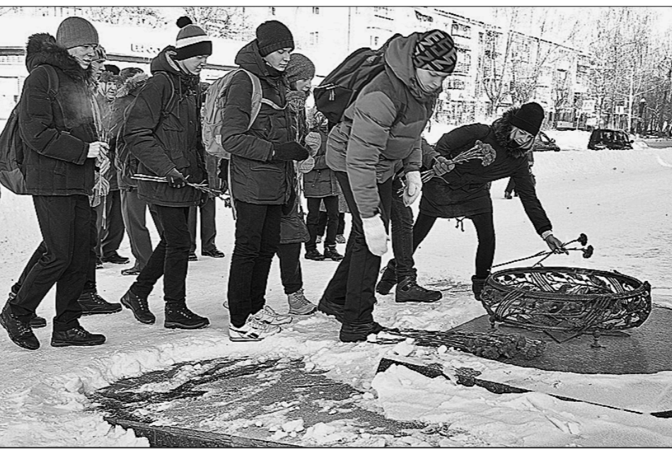
Возложение цветов к обелиску в Полевском.

Сергей РЯБОВ. (Соб. корр. «Правды»). Свердловская область.