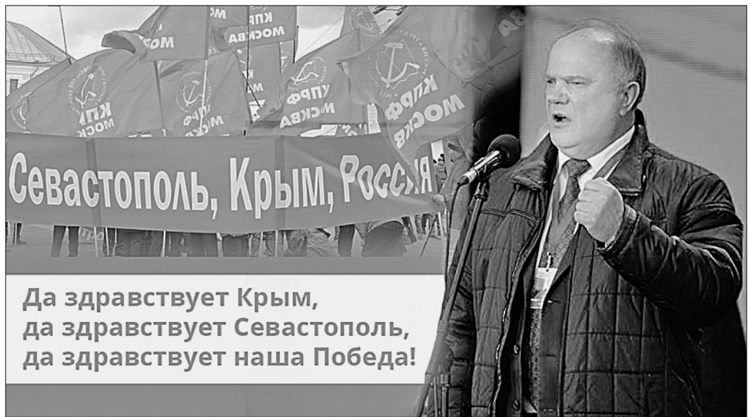
Да здравствует Крым, да здравствует Севастополь, да здравствует наша Победа!

18 марта в Москве, на Васильевском спуске, состоялся митинг-концерт «Мы вместе!» в честь второй годовщины воссоединения Крыма и Севастополя с Россией. Перед участниками акции выступил лидер КПРФ Г.А. Зюганов.