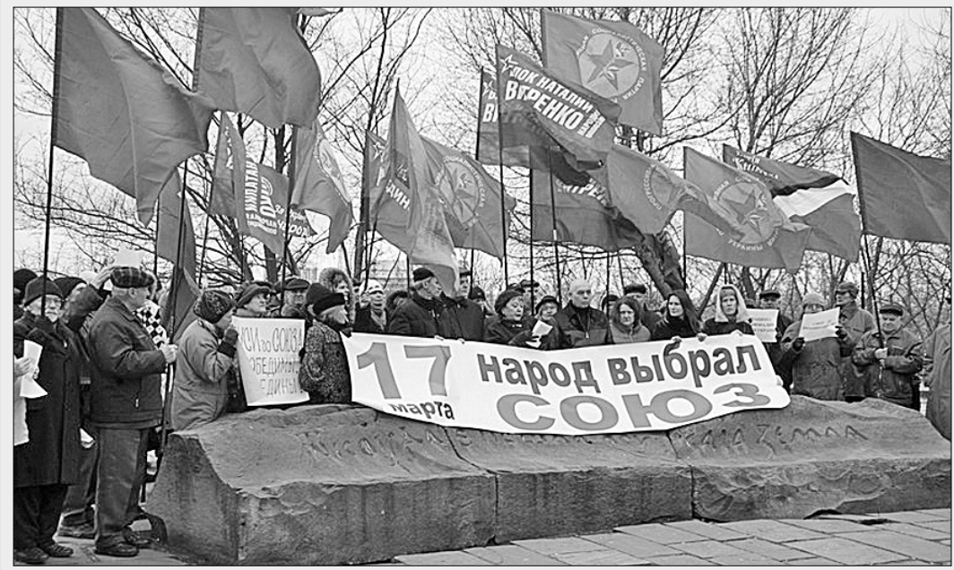
«Отсюда есть пошла русская земля».

армия Новороссии вынуждена будет перейти в контрнаступление, что будет означать де-факто срыв минских соглашений.