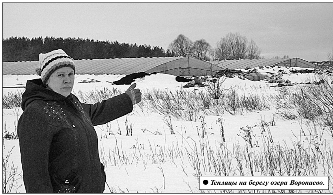
● Теплицы на берегу озера Воропаево.