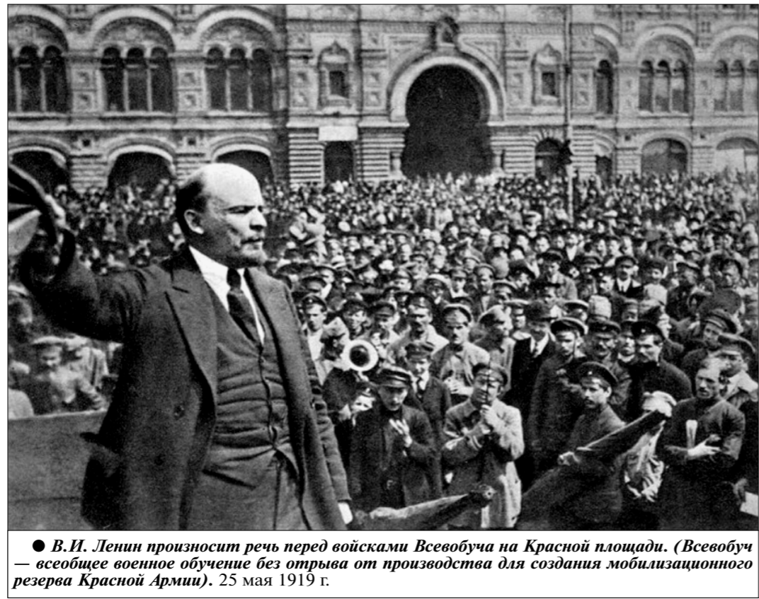
В.И. Ленин произносит речь перед войсками Всевобуча на Красной площади. (Всевобуч — всеобщее военное обучение без отрыва от производства для создания мобилизационного резерва Красной Армии). 25 мая 1919 г.

— Почему же? — Да, от маршалов до младших лейтенантов. Причём некоторые из них затем были реабилитированы, ещё до войны. Скажем, Рокоссовский тоже вошёл в это число, но войну он встретил командиром механизированного корпуса.