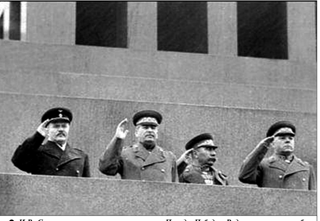
И.В. Сталин приветствует участников Парада Победы. Рядом с ним на трибуне Ленинского Мавзолея В.М. Молюков, С.М. Будённый, К.Е. Ворошилов. 24 июня 1945 г.

Учредители — журналистская организация АНО «Редакция газеты «Правда», Коммунистическая партия Российской Федерации