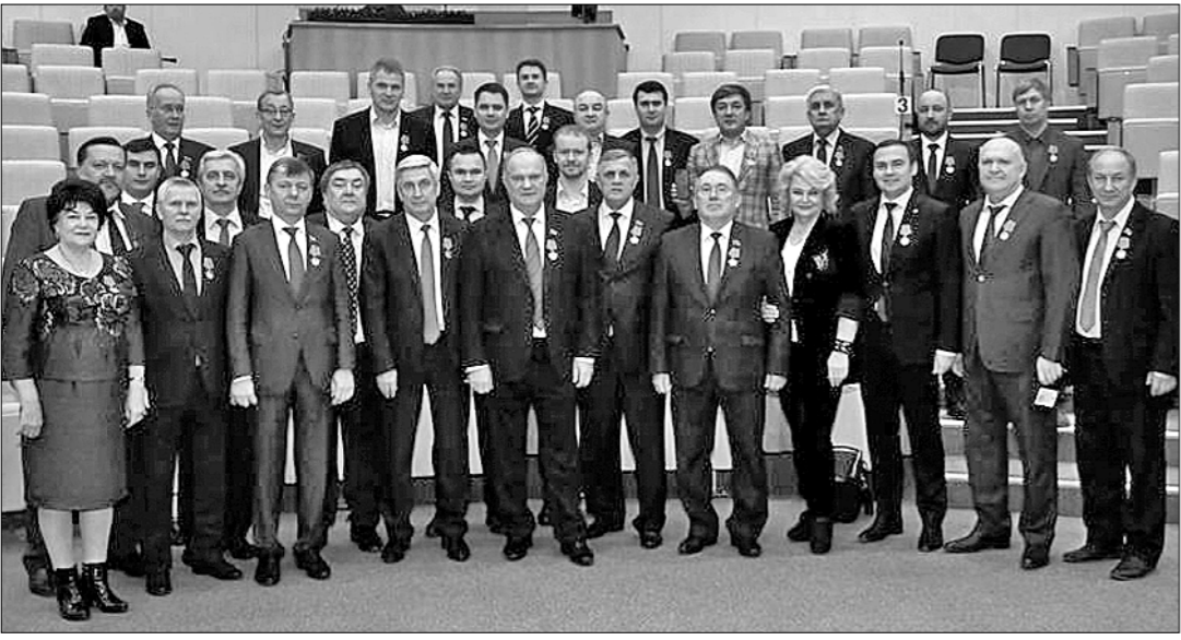
24 октября заседание фракции КПРФ в Госдуме провёл Председатель ЦК КПРФ Г.А. Зюганов.

ЛИДЕР российских коммунистов прокомментировал главные политические события прошедшей недели и представил план юбилейных мероприятий в связи со 100-летием Великого Октября.