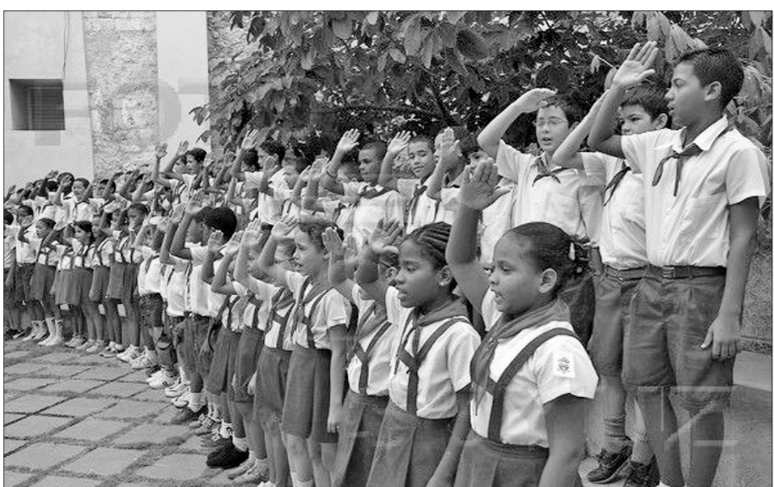
● На пионерской линейке во дворе одной из школ Таванга учащиеся хором скандируют девиз своей организации: «Пионеры — за коммунизм. Будем, как Че Гевара!»