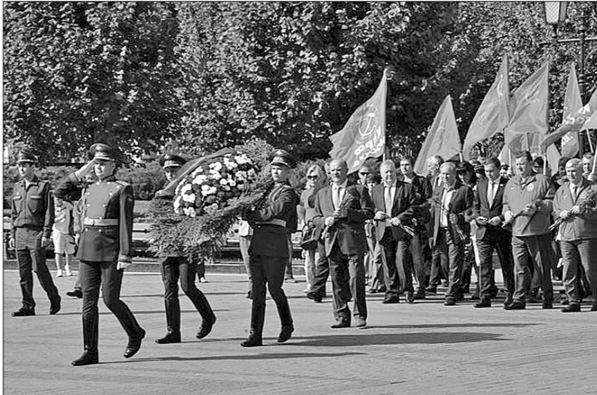
«Наша партия подготовила программу «10 шагов к достойной жизни», — сказал лидер коммунистов. — Эта программа легла в основу деятельности всех народно-патриотических сил. Мы предпримем всё для того, чтобы возродить обновлённый социализм и достойно встретить 100-летие Великого Октября. К нам на праздник в начале ноября придут представители всех крупнейших стран мира, все левые, коммунистические и народно-патриотические партии. Мы проведём большой форум в Ленинград-Петербурге и в Москве. Приглашаем вас активно участвовать в подготовке к этим выдающимся событиям»

что накануне годовщины завершения Второй мировой войны наших дипломатов выгоняют из дипучреждений, свидетельствует о полном неуважении и варварстве.