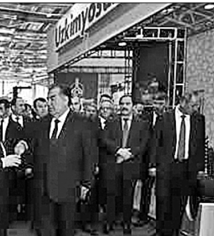
Шавкат Мирзиёев и другие участники государственного визита в Душанбе.

По самым значительным шагом к возрождению добрососедских отношений стал государственный визит в Душанбе президента Узбекистана Шавката Мирзиёева. Он прошёл 9—10 марта и привлек повышенное внимание не только