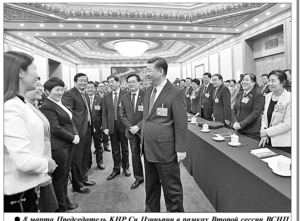
8 марта Председатель КНР Си Цзиньпин в рамках Второй сессии ВСНП 13-го созыва принял участие в заседании делегации провинции Хэнань.

Многочисленные факты показывают, что «Один пояс — один путь» отнюдь не является «долговой ловушкой» и «геополитическим инструментом», это реальный «приямок» для народа и для возможности совместного развития. (Жэньминьван).