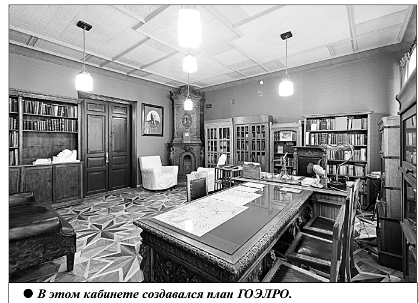
В этом кабинете создавался план ГОЭЛРО.

Идея разработки плана ГОЭЛРО появилась в 1919 году. Кржижановский сумел объединить более 200 учёных для работы над планом, а это была нелёгкая задача. Незадолго до начала работы Комиссии