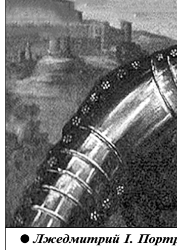
Лжедмитрий I. Портрет из замка Мшишков в Вишневец.

Кем был этот человек, называвший себя законным наследником Ивана Грозного — подлинным ли Дмитрием, чудом спасшимся в Угличе от полонных Борисом убийц, или искренне верящим в своё происхождение подставным лицом, невольником выполнявшим чей-то замысел, а может, просто дерзким мошенником, рискнувшим погреть руки на расклеванных углах придворной интриги? У каждой из этих версий есть сторонники и противники, а истина, возможно, сместится над ними из своего потаённого убежища.