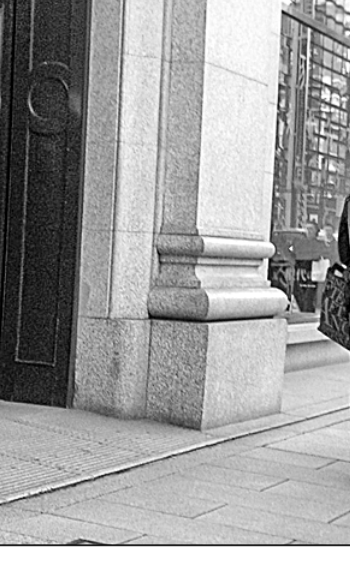
● Есть покупка!

1,4 на представительницу прекрасного пола. При этом государство едва поддерживает семьи. В стране наблюдается дефицит мест в детских садах, а на получение родительских пособий могут претендовать только 60% работников. «Одновременно работодатели оказывают давление на тех, кто мог бы получить ро-