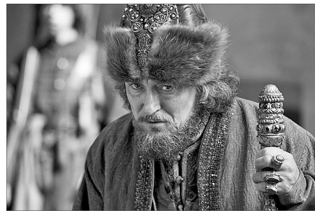
Сергей Безруков в роли Бориса Годунова.

«Дмитрия» добились саблями и албардами. После трёхдневных надругательств изуродованные останки «царя», которого ещё так недавно обожали и славили, захоронили на кладбище для безымянных упившихся и замёрзших. Впоследствии, дабы покончить со слухами о том, что «мёртвый ходит» и над могилой сами собой вспыхивают и движутся огни и слышатся пение и звуки бубнов и что это, дескать, «бсы расстригу славят», тело выкопали, сожгли и, смешав пепел с порохом, выстрелили из пушки в ту сторону, откуда он пришёл, — в сторону Польши.