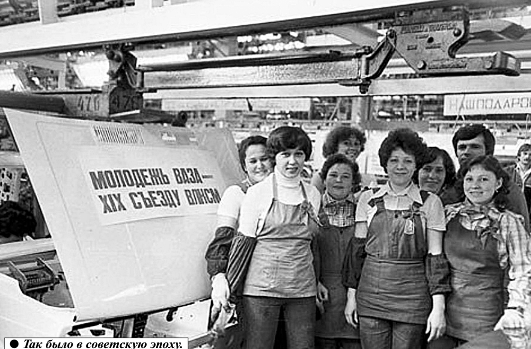
Так было в советскую эпоху.

А тут ещё одна проблема. Все заявления по «продаже» акций регистрирует лишь один (!) нотариус на весь город, тогда как собственников акций — более 100000 человек. Страшно представить, на сколько лет растянется очередь. А те, кто уловился и уехал из города? Им, если их даже и оповестят, придётся или ехать в Тольятти, или позвать все радости «деловой переписки».