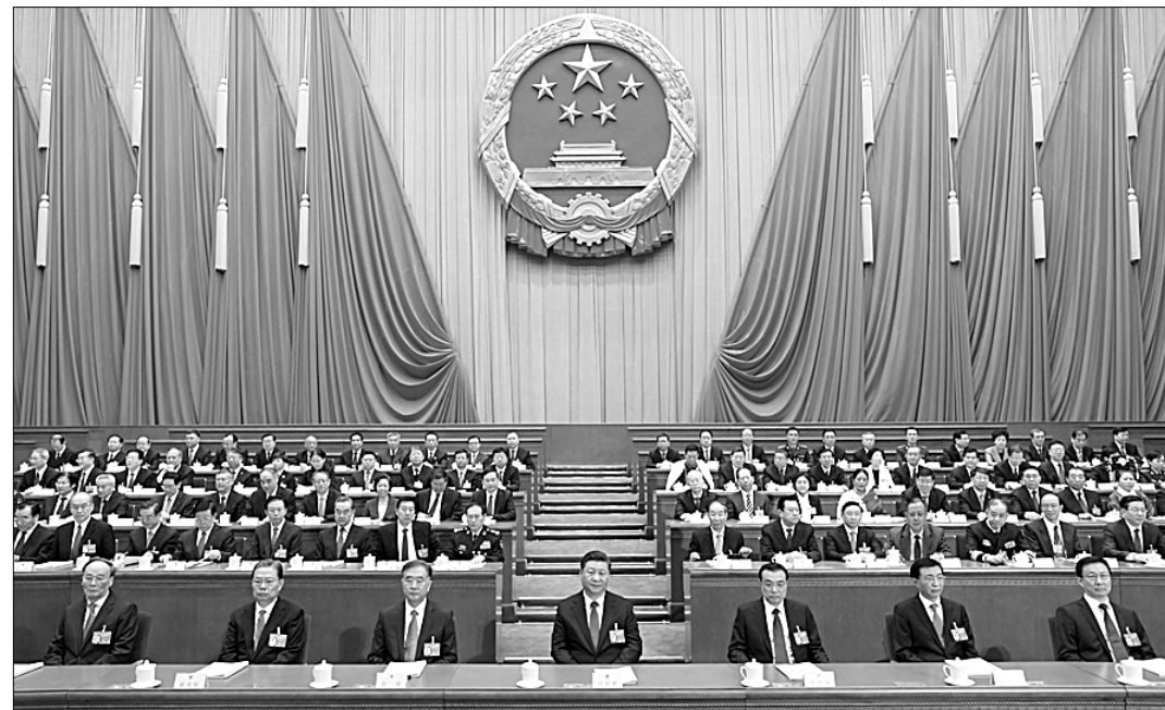
5 марта в Доме народных собраний в Пекине открылась Вторая сессия ВСНП 13-го созыва. На заседании присутствовали руководители партии и государства.

Кроме мер по развитию экономики, в докладе о работе правительства также подчёркиваются меры по расширению открытости. Необходимо продвигать всестороннюю внешнюю открытость, формировать новые преимущества в международном экономическом сотрудничестве и конкуренции. Вместе с тем следует постепенно открывать больше сфер, оптимизировать структуру открытости, продолжать продвигать открытие товаров и элементов мобильного типа, придавать большее значение системной открытости для того, чтобы способствовать всестороннему углублению реформирования с помощью открытости на высоком уровне. Ли Кэцян отметил, что следует стимулировать стабильное повышение качества внешней торговли, продвигать диверсификацию экспорта, расширять страхование экспортного кредитования, реформировать и улучшать политические меры, нацеленные на поддержку но-