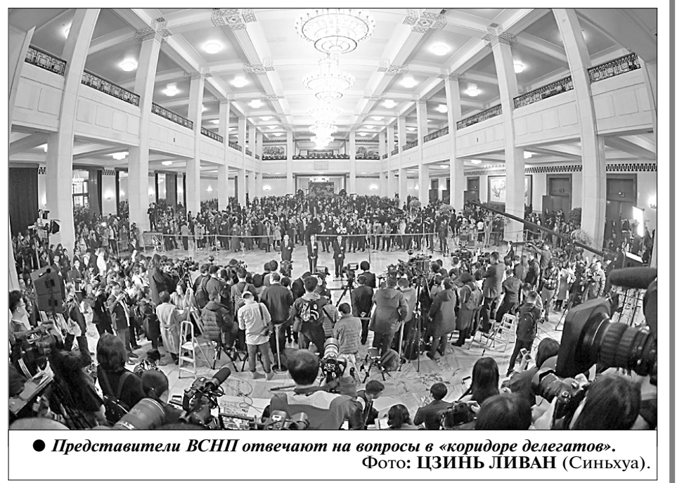
Представители ВСНП отвечают на вопросы в «коридоре делегатов».

Одновременно с этим Китай поощряет развитие технологического сотрудничества на добровольной основе и в соответствии с правилами ведения бизнеса в процес-