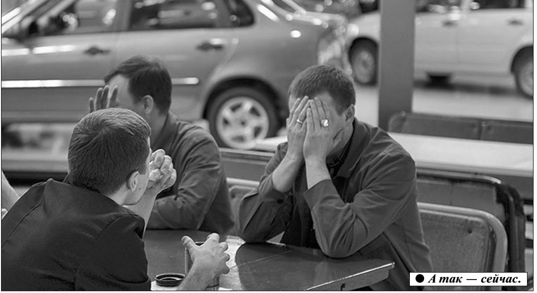
А так — сейчас.

принудительный выкуп акций у членов трудового коллектива и ветеранов ПАО «АвтоВАЗ» владельцами предприятия, что вызывает возмущение у горожан, где и без того высокая социальная напряжённость. Инициатором принудительного выкупа акций АвтоВАЗа является компания Allians Rostec Auto (зарегистрирована в г. Амстердам). По предварительной оценке, ситуация с выкупом акций