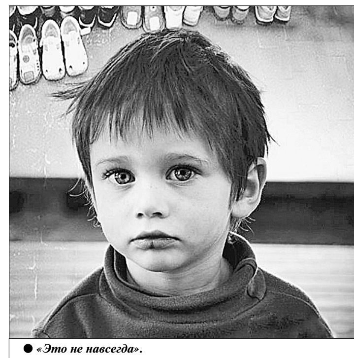
«Это не навсегда»

длукриминального окружения. Герой фильма «Трезвый водитель» режиссёра Резо Пигиенишвили тоже отправляется в Москву на поиски удачи и для «разбегта» соглашается «подкалывать» ночами на машине друга, но в пер-