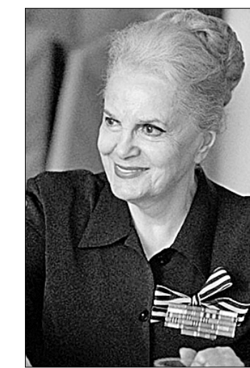
«Правда», №7 от 26—27 января 2016 г.

Нелегко даётся нам Победа, а роль в этом советских песен, советского кино, советской идеологии исключительно велика. Участие культуры в целом и тех незабываемых концертных бригад в достижении Победы невозможно переоценить.