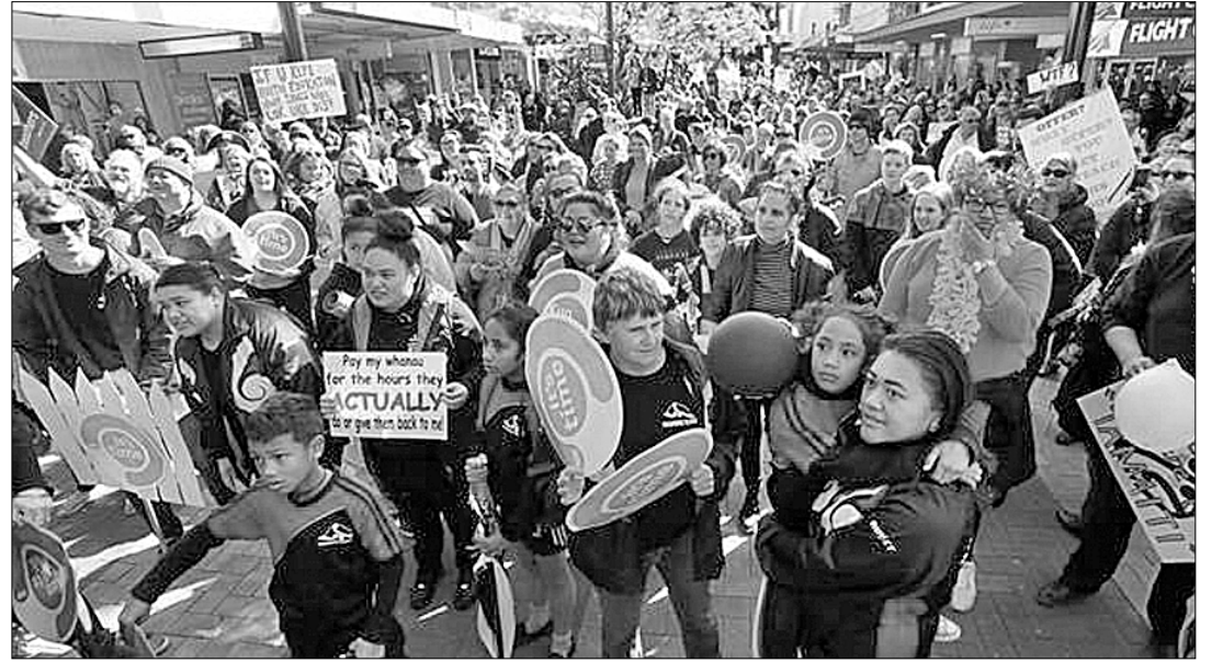
По всей Новой Зеландии проходят акции протеста школьных учителей, требующих повышения зарплат, улучшения условий труда, уважения к их профессии, сообщает местная газета «Нью-Зиланд геральд».

ТЫСЯЧИ педагогов уже трижды за последнее время выходили на улицы городов и других населённых пунктов страны. На сей раз их число превысило 50 тысяч, в одном только Окленде протестовало 10 тысяч человек.