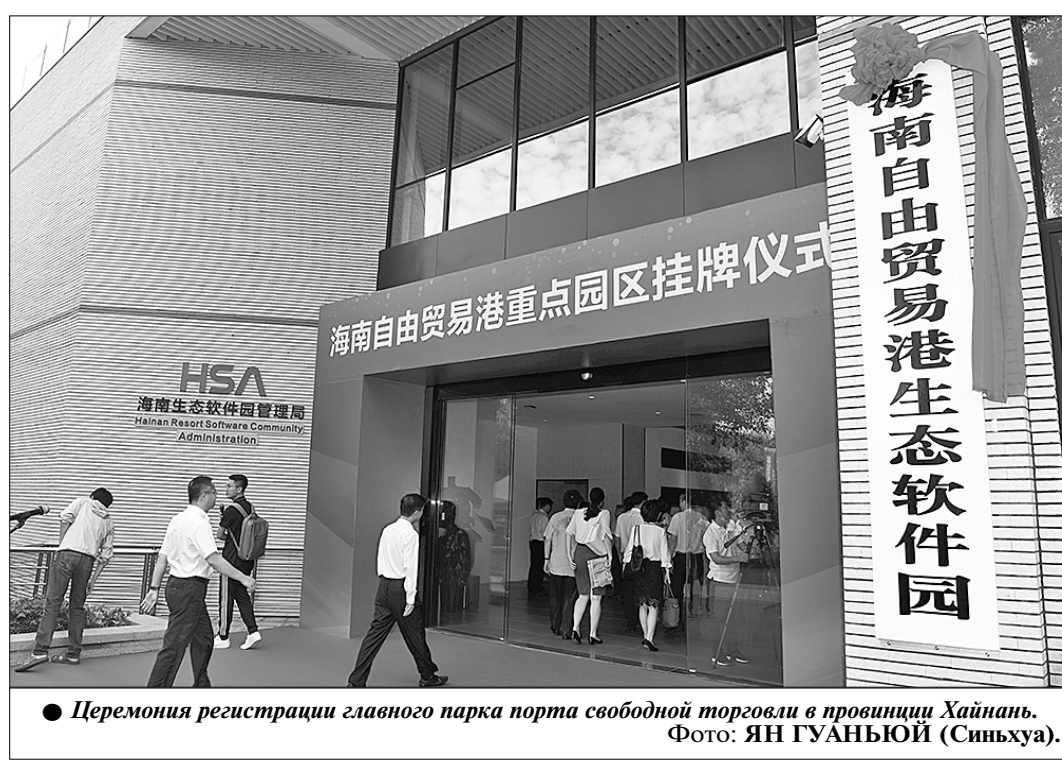
● Церемония регистрации главного парка порта свободной торговли в провинции Хайнань.

Вместо излишней торопливости ради сиюминутных интересов и немедленных результатов Китай будет постепенно продвигать реализацию наме-