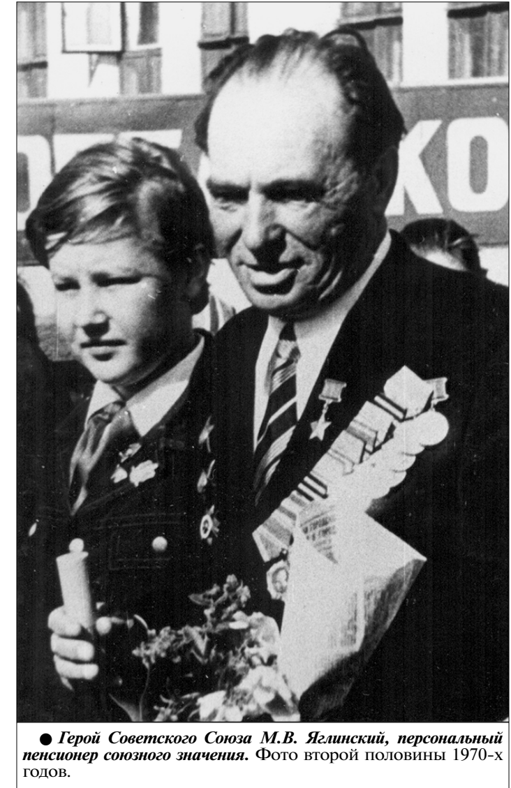
Герой Советского Союза М.В. Яглинский, персональный пенсионер союзного значения. Фото второй половины 1970-х годов.

Прошли уже около десяти километров, отдохнули в небольшом овражке и оказались на зна-