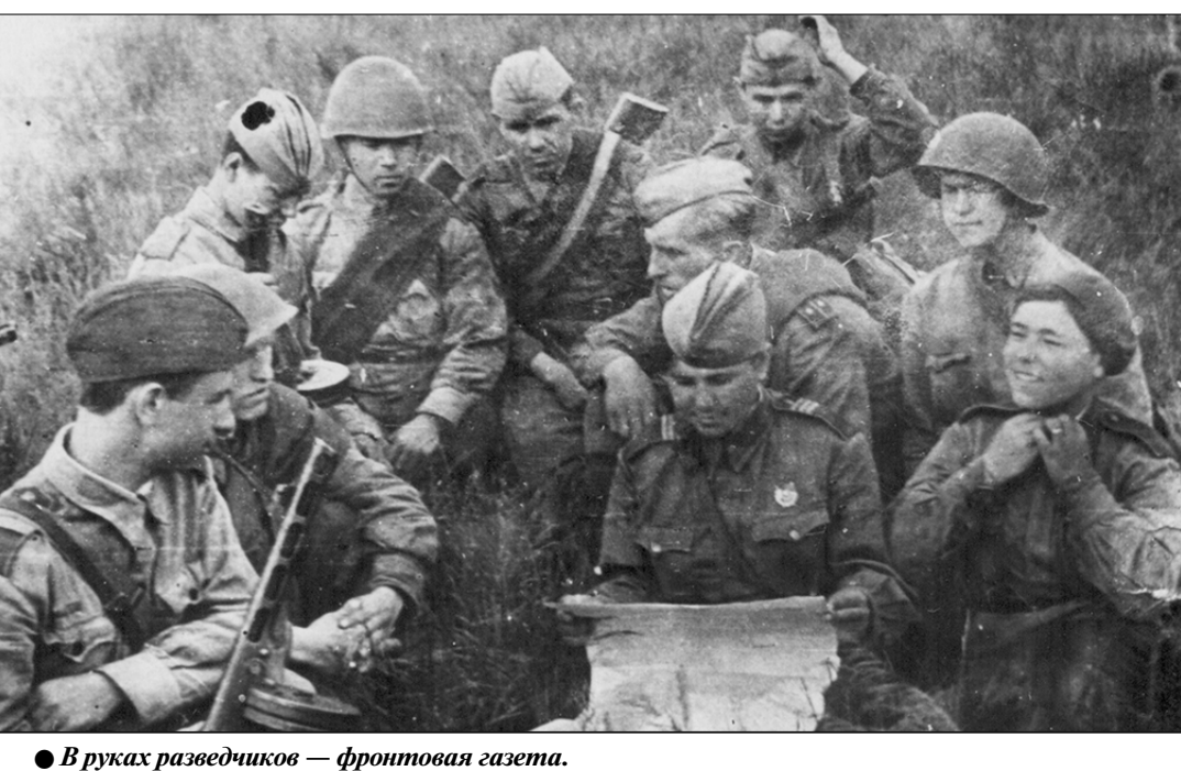
● В руках разведчиков — фронтовая газета.