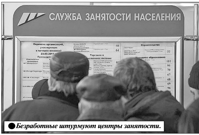
Безработные штурмуют центры занятости.

По сообщению преподавателей ВШЭ, руководство под видом реорганизации готовится со-