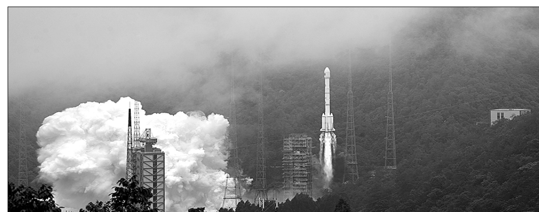
● Успешно запущен последний спутник «Бэйдоу-3».