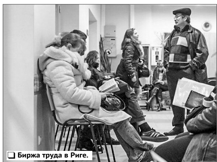
Биржа труда в Риге.