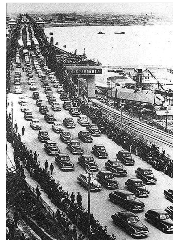
В октябре 1957 года Уханьский мост через реку Янцзы был открыт для движения транспорта.

В октябре 1957 года, после более двухлетней напряжённой работы, большой Уханьский мост через реку Янцзы, который назывался «первым мостом через реку Янцзы», был открыт для движения транспорта. Этот мост не только изменил облик Уханя, но и взбудоражил дух всего китайского народа. Достигнутый успех связывают с заслугами советского эксперта по строительству мостов Константина Сергеевича Силина.