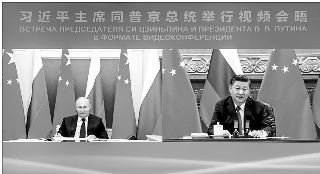
28 июня председатель КНР Си Цзиньпин и президент РФ Владимир Путин провели встречу в формате видеоконференции.

Китай и Россия готовы к продвижению двустороннего сотрудничества на новый уровень