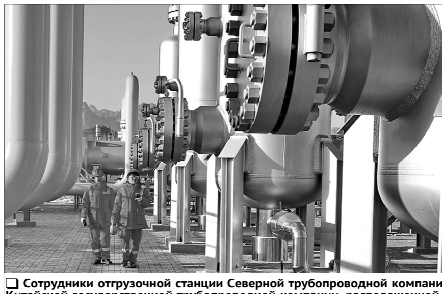
Сотрудники отгрузочной станции Северной трубопроводной компании Китайской государственной трубопроводной компании, расположенной в районе Хайган города Циньхуандао провинции Хэбэй, проводят ежедневную проверку восточной линии газопровода Китай — Россия.