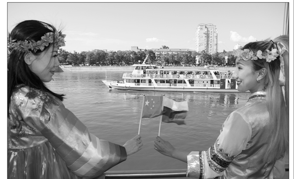
21 июня 2021 года молодёжь КНР, участвующая в 11-й Российско-китайской культурной ярмарке, с китайским и российским флагами.

Исполнилось 20 лет со времени подписания китайско-российского Договора о добрососедстве, дружбе и сотрудничестве. За два прошедших десятилетия, опираясь на этот документ, двусторонние отношения выдержали разные риски и вызовы, постоянно достигли новых исторических высот. Недавно председатель КНР Си Цзиньпин провёл встречу в формате видеоконференции с президентом РФ Владимиром Путиным, стороны опубликовали совместное заявление, официально приняв решение продлить действие Договора о добрососедстве, дружбе и сотрудничестве между Китаем и Россией.