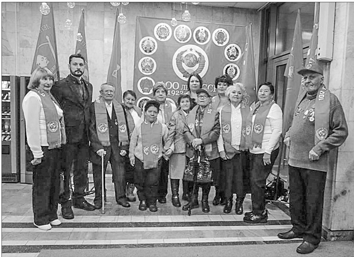
риевич выразил глубокую уверенность в победе нашего общего дела — возрождения СССР. Завершился концерт общим исполнением Гимна Советского Союза, который спели педагоги Ольской средней школы и все зрители, собравшиеся в зале. Пресс-служба Магаданского обкома КПРФ.

3 декабря на самой большой сценической площадке Магадана — в Центре культуры прошло торжественное мероприятие по случаю юбилея создания Советского Союза.