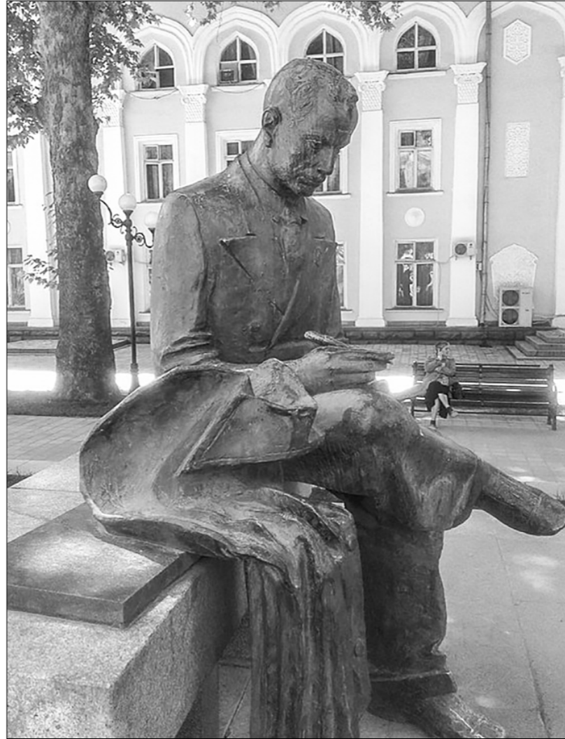
Памятник А. Лахути в Душанбе.

Примечательно и то, что эти написанные поэтом стол лет назад стихотворения в СССР сразу обрели своего восторженного читателя. С поразительной быстротой распространялись они в Средней Азии, так как для таджикоязычного населения были понятны и полнилки. А «Рабочая клятва» — короткое стихотворение с энергичным, мажорным звучанием, написанное в маршевом ритме, — так и поддалось текстом торжественного обещания для пионеров Таджикистана: