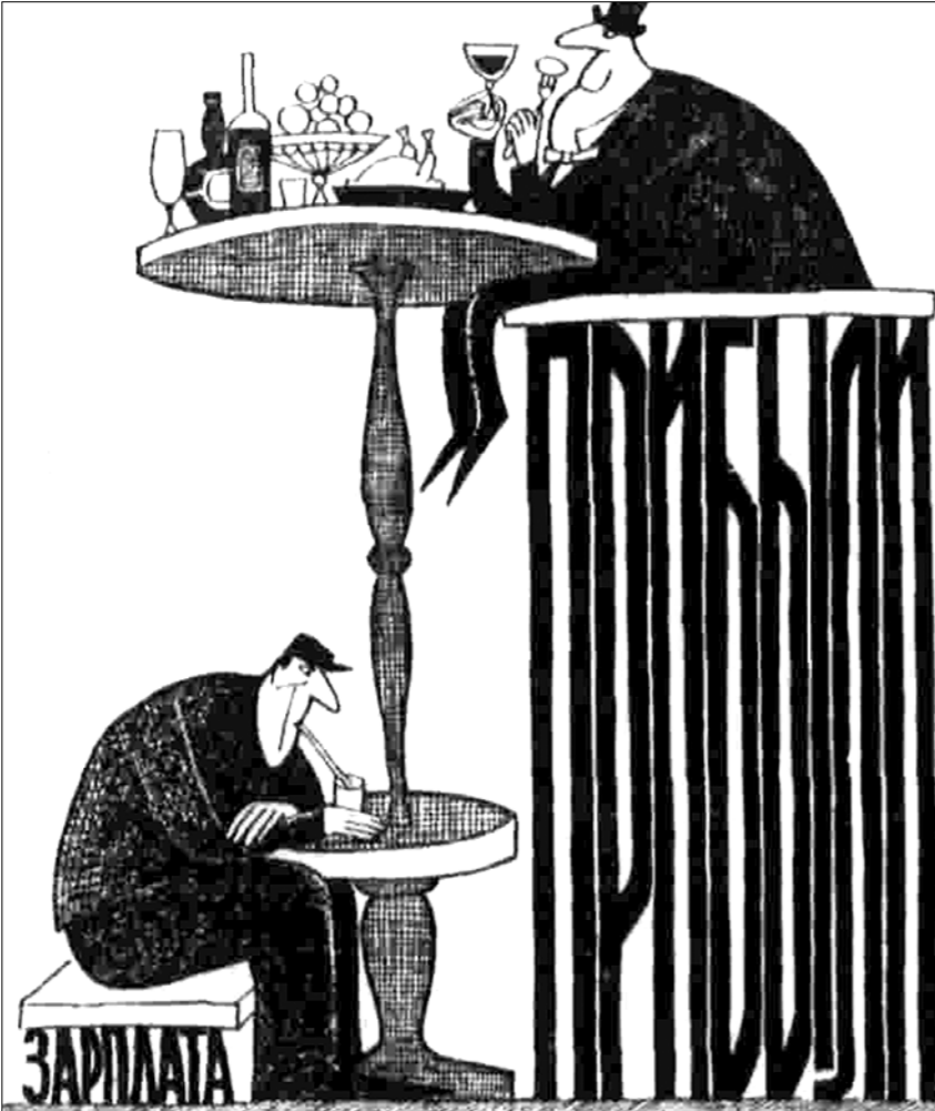
«Правда», №213 (20452), 1 августа 1974 г.