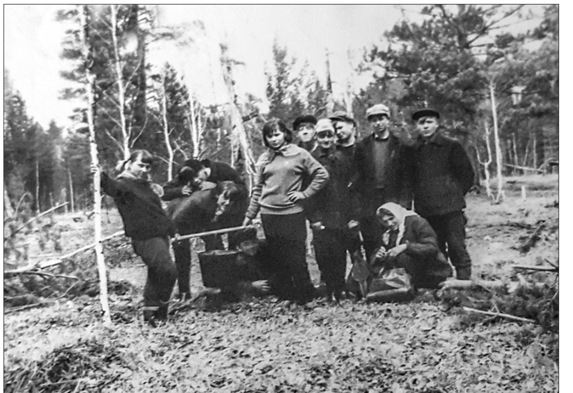
Поход с ночёвкой. Красноярский край, село Михайловка, 1969 г.

Как сейчас помню: школьный двор, пионерские отряды выстроились на торжественную линейку. Сданы рапорты, слышится команда «Знамя пионерской дружины вёсти!».