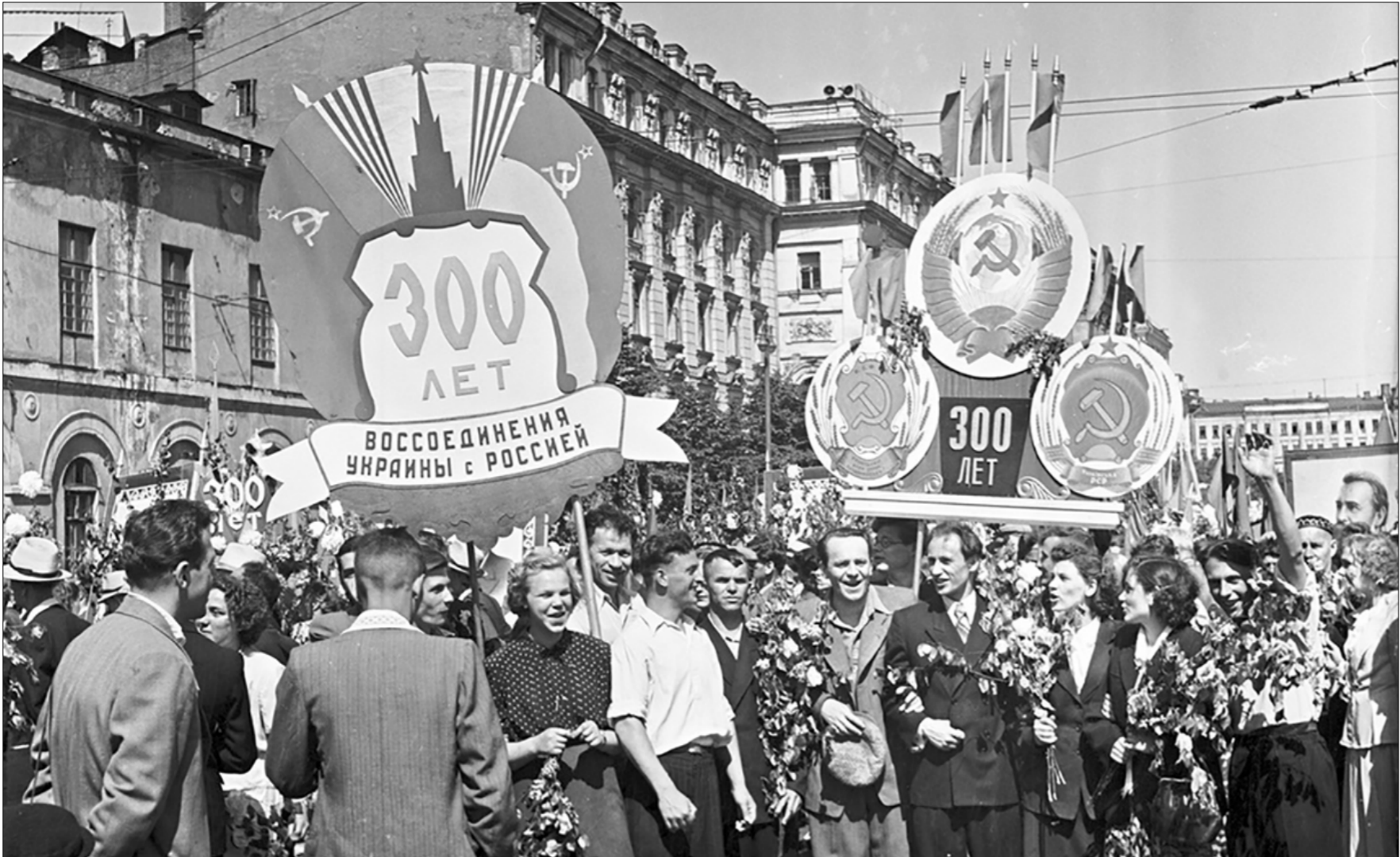
Такой была Советская Украина. Киев, Крещатик. 1954 год.

В то же время в течение 1942 года под эгидой местных лидеров ОУН(м) и ОУН(б) возникли вооружённые отряды, противостоявшие немецким карателям, польским националистам и советским партизанам. К апрелю 1943-го они насчитывали до 10—12 тысяч бойцов. Начиная с 9 апреля представителями ОУН(б) вели переговоры с Т. Боровцом, требуя от него признать платформу бандеровцев как единственно верную, с чем тот не согласился. Но с этого времени отряды ОУН(б) стали именовать себя Украинской повстанческой армией — УПА (командующий — К. Савур (Клячицкий)), а с середины августа бандеровские боевики и служба безопасности начали разоружать бойцов Т. Боровца и А. Мельника, расстреливая