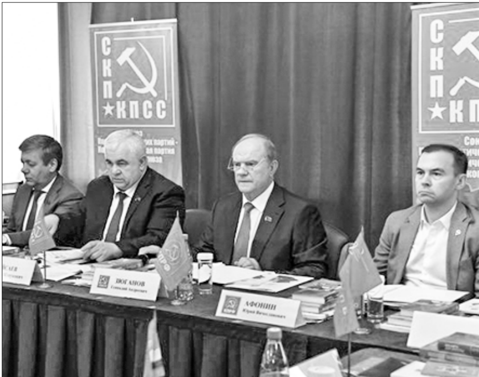
В зале заседаний Политисполкома Центрального Совета СКП-КПСС.