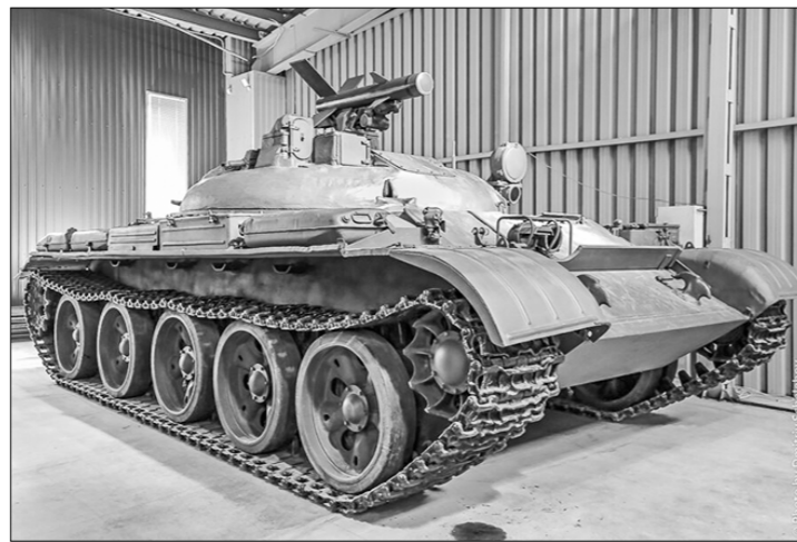
□ Ракетный танк ИТ-1 в Центральном музее бронетанкового вооружения и техники в Кубинке.

Период 16-летней деятельности Карцева в должности главного конструктора был одним из наиболее плодотворных в послевоенном отечественном танкостроении. Карцев выбрал эволюционный путь развития для тагильской школы. КБ двигалось отдельными шагами, оперативно беря и внедряя в серийный танк всё, что появлялось нового в науке и технике.