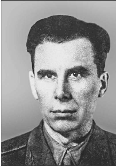
□ Леонид Карцев.