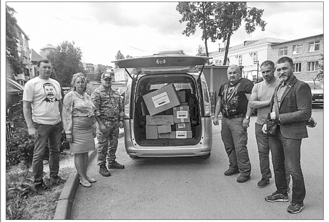
Пермский краевой комитет КПРФ продолжает сотрудничать с Благотворительным фондом «Добровольцы Донбасса».

Благодаря активному участию в этой акции жителей края и помощи местных партийных отделений для защитников Донбасса удалось собрать медикаменты, средства личной гигиены и предметы первой необходимости.