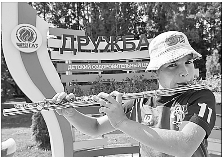
В детском оздоровительном центре «Дружба» Шумилинского района Витебской области на летних каникулах ребяташки отдыхают с пользой для здоровья. Здесь, как сообщает БЕЛТА, есть бассейн, соляная пещера, кинотеатр, теннисный корт, тренажёр на воздухе и целая галерея уличных арт-объектов, которые изготовили своими руками работники всех филиалов унитарного предприятия «Витебскоблгаз».