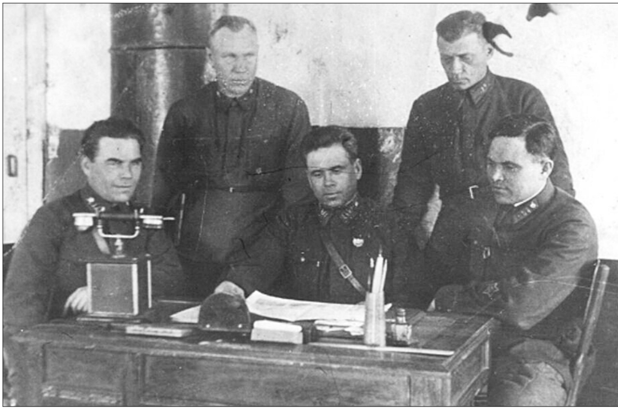
Командование зарождающейся в снегах Башкирии 124-й стрелковой бригады. Аксаково, зима 1942 года.

вывать отдельные стрелковые ячейки во взводные и ротные пункты обороны с комплексом инженерных полевых сооружений. В ходе обучения начинающие сапёры отремонтровали несколько деревянных мостов: сапёрам наука и колхозам подмога. Но как строить противопехотные, противотанковые заграждения без учебных мин и взрывателей формирования бригада не имела. Обходились даже без винтовок. Всё вооружение состояло из офицерских пистолетов.