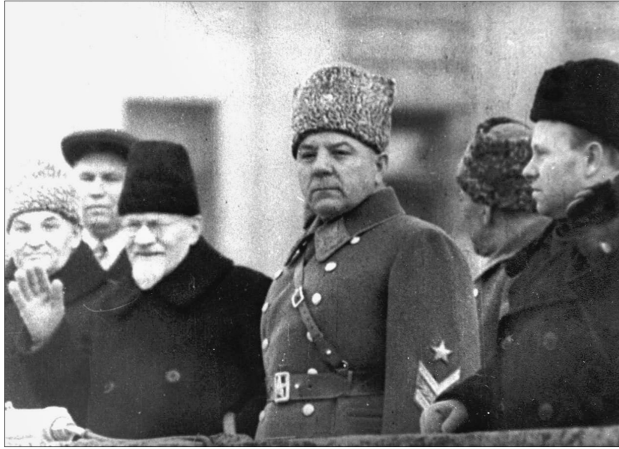
Представитель Ставки ВГК по формированию войск, Маршал Советского Союза К. Ворошилов на военном параде в Куйбышеве 7 ноября 1941 года. В феврале 1942 года К.Е. Ворошилов инспектировал формирование 124-й бригады на станции Аксаково в Башкирии.

Февраль 1942 года был на исходе. Наконец тревоги, сомнения развеялись. Рано утром прибыл эшелон дальневосточников. В штабе брига-