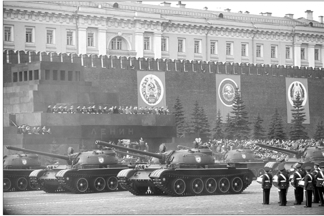
□ Танки Т-55 на Красной площади.

водил КБ в замечательную эпоху, когда его талант смог проявиться в полную силу. Были разработаны и приняты на вооружение боевые машины, каждая из которых можно отнести определению «первый». На Т-54Б был впервые установлен 2-плоскостной стабилизатор вооружения; Т-55 — самый массовый танк XX столетия; на Т-55А впервые в мире установлена аппаратура противотанковой защиты; Т-62 — первый в мире серийный танк с гладкоствольной пушкой калибром 115 мм; объект 167Т — первый в мире танк с газотурбинным двигателем; ИТ-1 — первый в мире серийный ракетный танк.