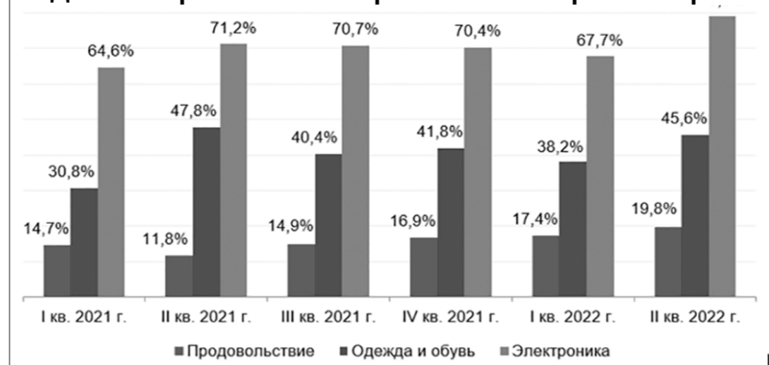
Доля импорта в оптовой торговле по категориям товаров