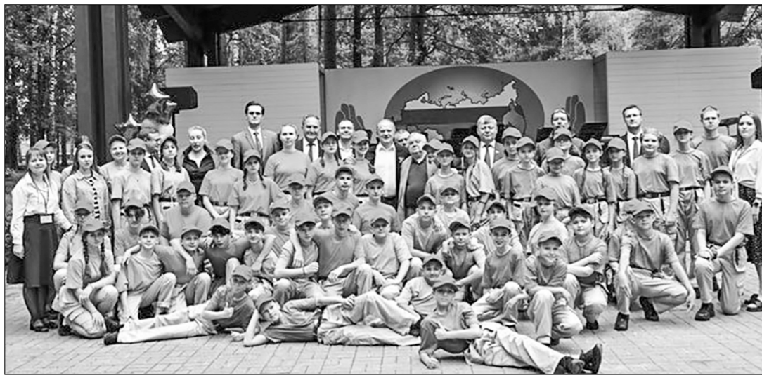
14 июля в подмосковном оздоровительном комплексе «Снегири» состоялась открытие детского военно-спортивного центра «Юный патриот». На торжественной линейке выступил Председатель ЦК КПРФ Г.А. Зюганов.

Военно-спортивный центр «Юный патриот» заехала третья группа из Луганской народной республики в количестве 60 человек. До этого здесь же прошли военно-спортивную подготовку и оздоровились ещё две группы (одна из Луганской, а другая — из Донецкой народной республики). А всего при непосредственном участии КПРФ в последние годы в комплексе «Снегири» оздоровились с территорий новых регионов России около 14 тысяч детей.