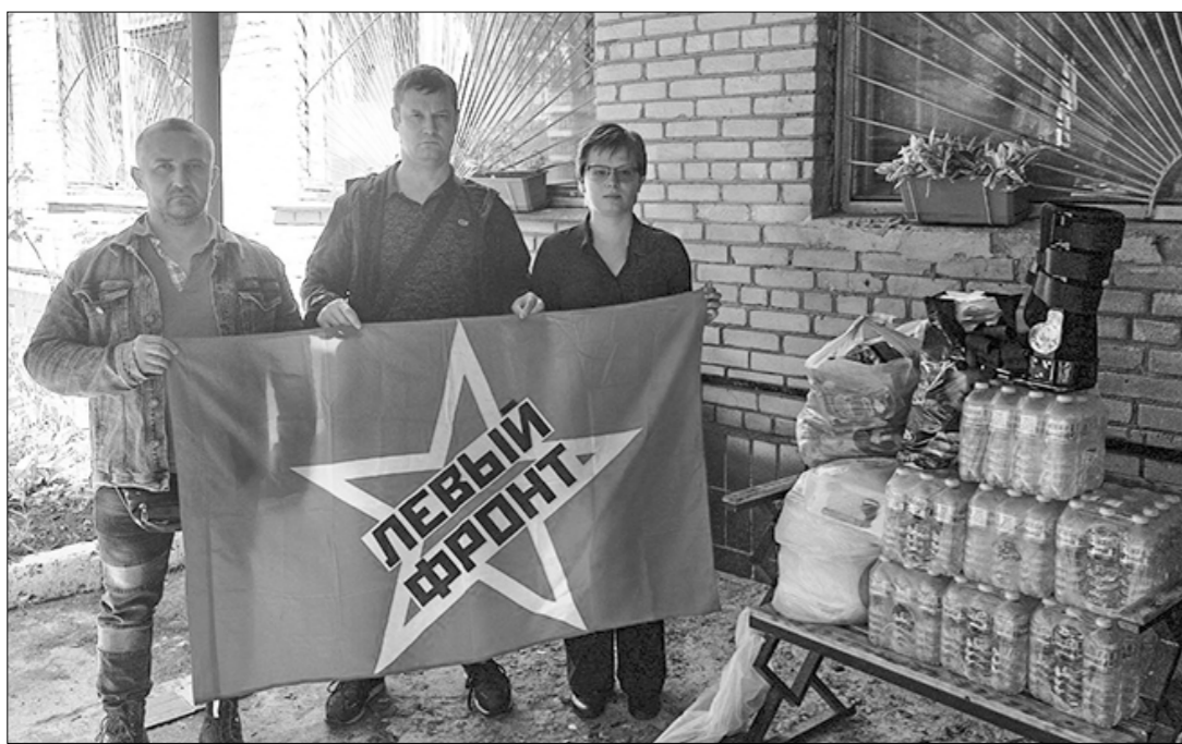
Активисты «Левого фронта» Московской области собрали и отвезли в филиал военного госпиталя им. Бурденко продукты питания и разнообразные бытовые вещи для находящихся там на лечении раненых бойцов.