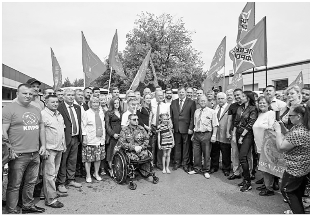
20 июня КПРФ во главе с лидером партии Геннадием Зюгановым отправил из подмосковного совхоза имени Ленина 126-й гуманитарный конвой в Донбасс.

В гуманитарном грузе переданы крупы, мясные и рыбные консервы, картофель, макаронные изделия, мука, подсолнечное масло, хлебцы, конфеты, крекеры, пряники, печенье, сладости, мёд, спужёнка, вода, чай, средства личной гигиены, кровоостанавливающие препараты, бинты, баллоны с газом, горелки, носилки, медицинские наборы, прищипы, генератор и многое другое.