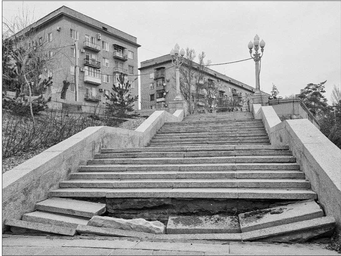
В Екатеринбурге строительная техника беспощадно разрушает старинную усадьбу, которую в недавних пор местная администрация отказалась считать памятником культурного наследия.

Стоит отметить, что капитальный ремонт был совсем недавно, а непосредственно перед обрушением по этой лестнице в преддверии выборов шли на