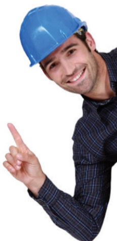
График работы: 2/2

Мы предлагаем: Полное соблюдение ТК РФ. Официальную з/плату. Выплаты 2 раза в месяц. Бесплатную спец. одежду. Корпоративные подарки.