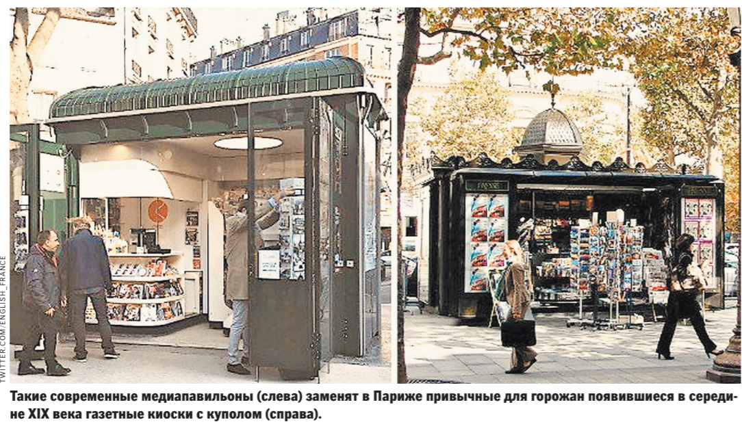
Такие современные медиапавильоны (слева) заменяют в Париже привычные для горожан павильоны XIX века газетные киоски с куполом (справа).

«Необходимо разнообразить их деятельность: они должны оставаться продавцами газет, но в то же время нужно, чтобы у них была возможность увеличить число предоставляемых услуг», — защищает идею новых павильонов один из руководителей французского концерна «Медиакиоск».