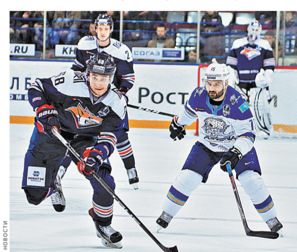
В серии «Металлурга» и «Барыса» хватало всего четырех матчей, чтобы выявить сильнеего.