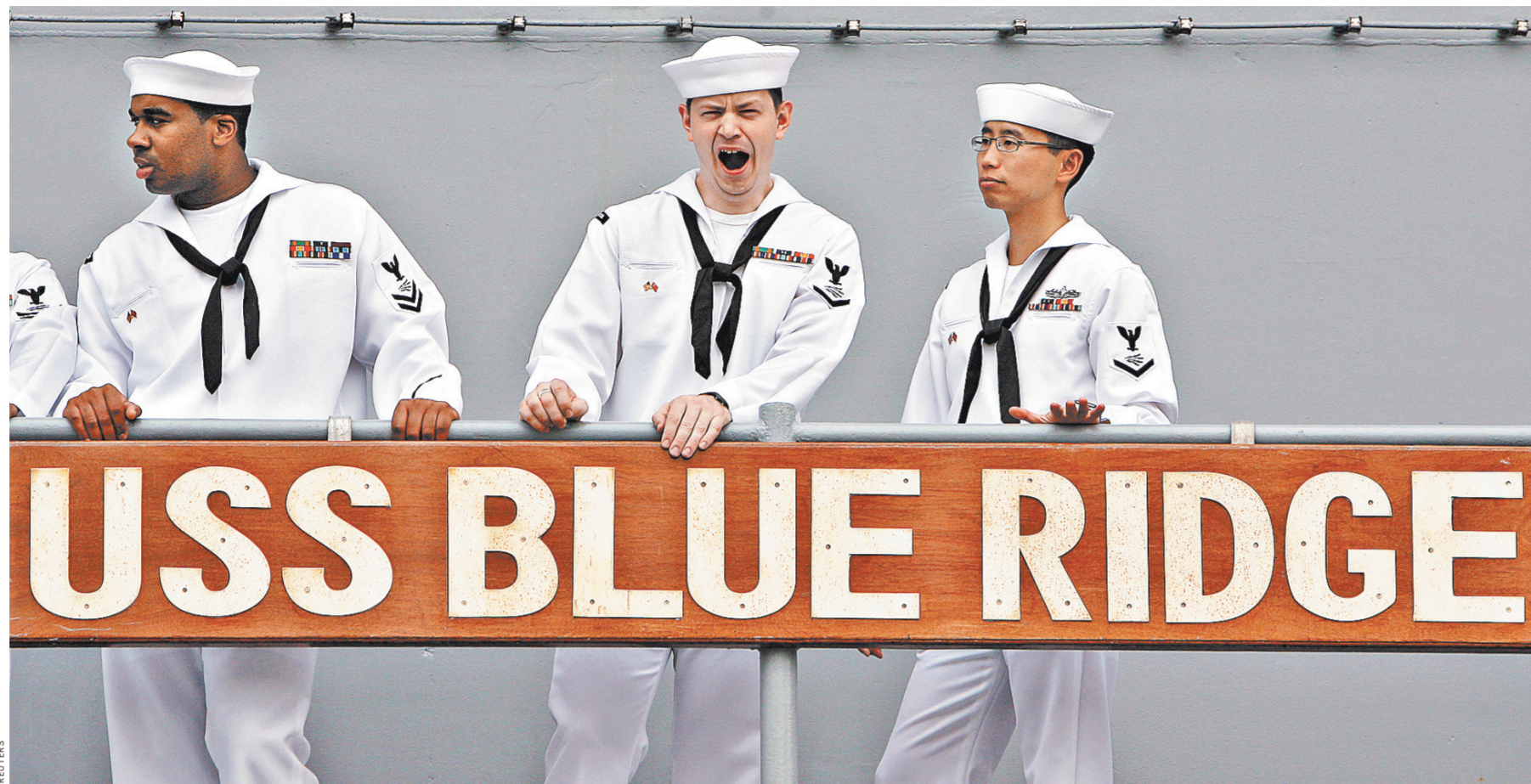
Поведение моряков с флагманского корабля американского флота в прокуратуре назвали «предательством ВМС США в эпическом масштабе».

Игорь Дунаевский, «Российская газета», Вашингтон