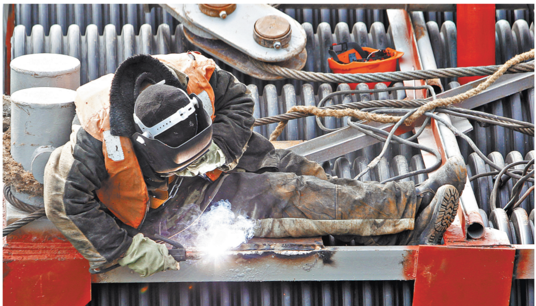
Зима и осень выдались достаточно суровыми, но строителям удалось преодолеть все трудности.