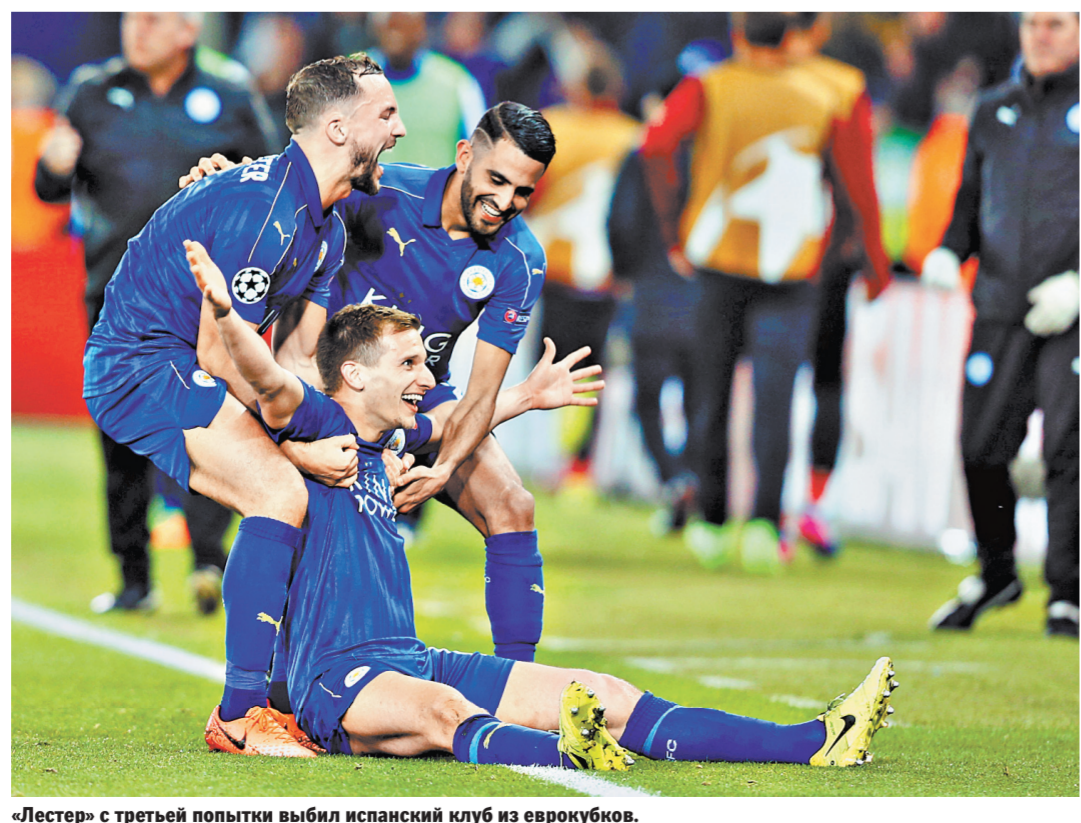
«Лестер» с третьей попытки выбил испанский клуб из еврокубков.

В другом полуфинале испанская «Валенсия» выиграла первый матч серии у израильского «Хапоэля» (Иерусалим) — 83:68.