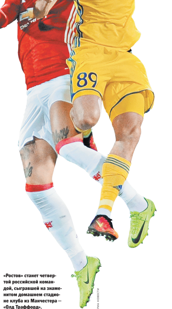
«Ростов» станет четвертой российской командой, сыгравшей на домашнем стадионе клуба из Манчестера — «Олд Траффорд».

Ну а в Краснодаре вечером четверга пройдет, быть может, не