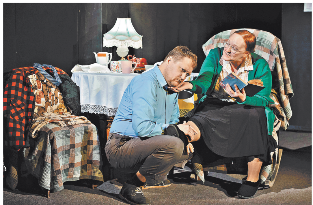
Задача была — показать, что все бывают какими-то странными, и все люди с особенностями, каждый со своими.