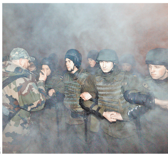
Украинские силовики оказались неспособны эффективно противостоять «ветеранам АТО».

Порошенко сам предложил такое решение на заседании СНБО: «Предлагаю Совету принять решение о временной полной остановке транспортного, а не только железнодорожного сообщения с оккупированной территорией», — заявил украинский президент. Запрет, по его словам, будет действовать до момента выполнения Минских соглашений и возврата предприятий Донецкой и Луганской народных республик в украинскую юрисдикцию. Порошенко не скрывает, что возглавить блокаду его вынудили действия «ветеранов АТО» и их покровителей: «Мы должны остановить сценарий дестабилизации ситуации на Украине и переиграть те политические силы, ко-