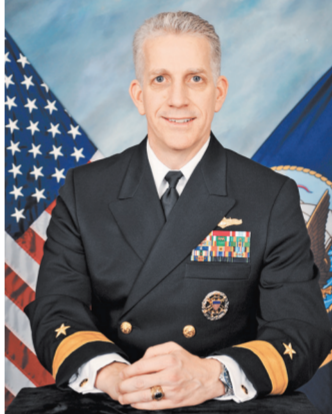
Адмирал Брюс Лавлесс поплатился за тягу к красивой жизни.

Это предательство ВМС США в эпическом масштабе, — считает исполняющая обязанности про-