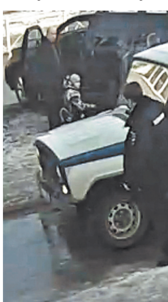
Полицейских, которые отпустили водителя с места происшествия, ждет отдельное разбирательство.