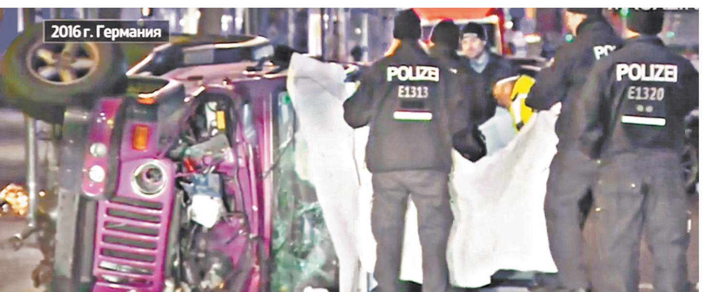
Павел Крашенинников не убежден, что ужесточение наказания, вроде пожизненного срока для водителя этой машины, сделает дороги безопаснее.

Работа большинства судей незаметна, они добросовестно делают свое дело и честно, по духу и букве закона решают судьбы людей.