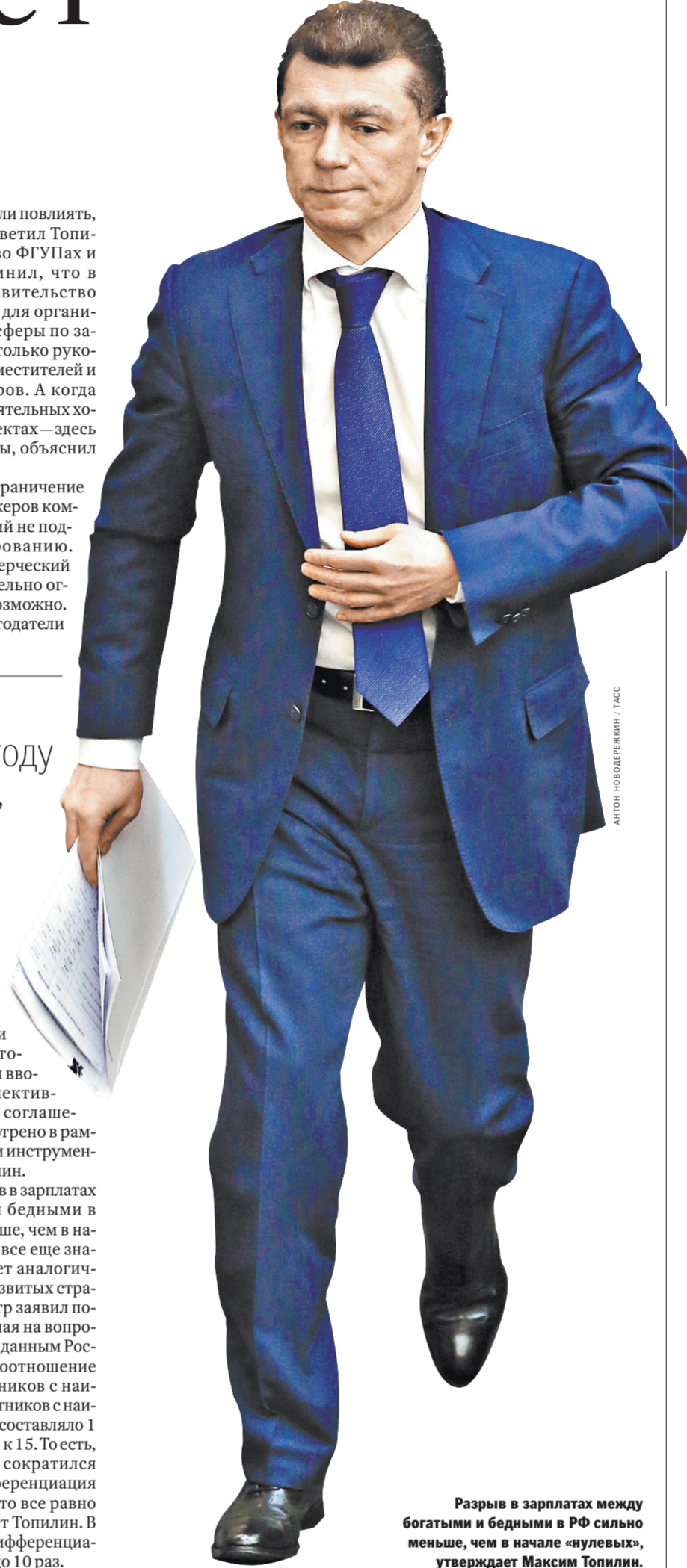
Разрыв в зарплатах между богатыми и бедными в РФ сильно меньше, чем в начале «нулевых», утверждает Максим Топилин.

В целом же разрыв в зарплатах между богатыми и бедными в России сильно меньше, чем в начале «нулевых», но все еще значительно превышает аналогичные показатели в развитых странах. Об этом министр заявил после заседания, отвечая на вопросы журналистов. По данным Росстата, в 2000 году соотношение доходов 10% работников с наибольшей и 10% работников с наименьшей зарплатой составляло 1 к 30, а в 2015 году — 1 к 15. То есть, разрыв по доходам сократился вдвое. Однако дифференциация зарплат в 15 раз — это все равно очень много, считает Топилин. В развитых странах дифференциация составляет от 7 до 10 раз.