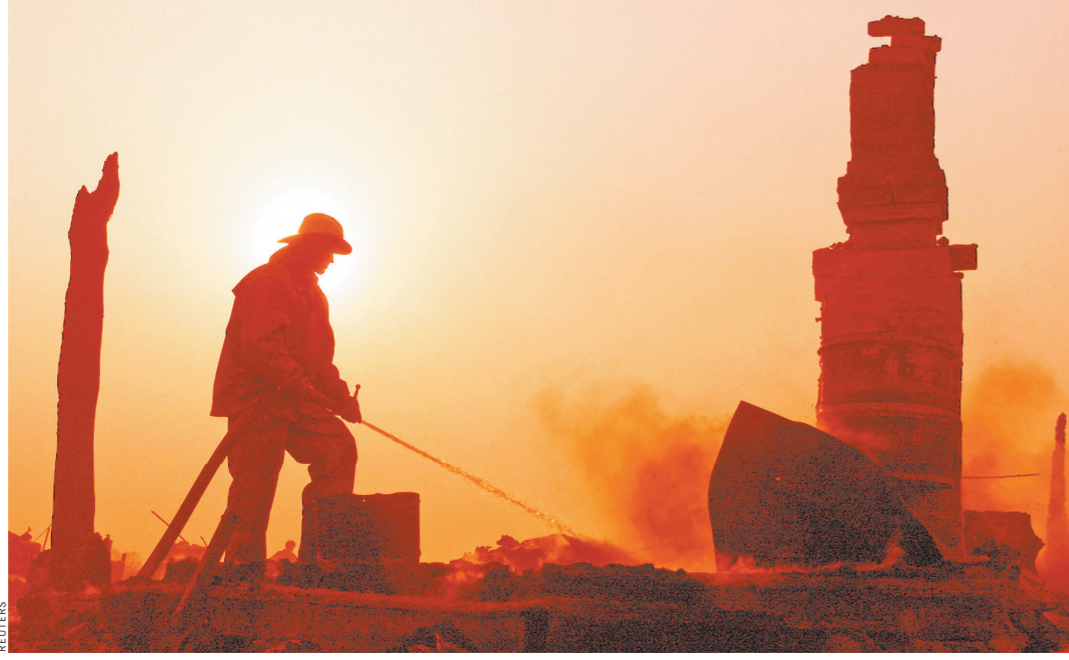
Возникнув в лесу, пожары зачастую перебарываются на населенные пункты.