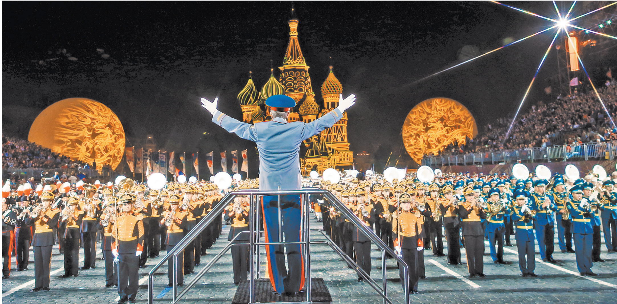
Валерий Михайлович Халилов на Красной площади дирижирует сводным оркестром из тысячи музыкантов. Его должность решено не занимать, а за дирижерским пультом будут по очереди работать ученики Халилова.