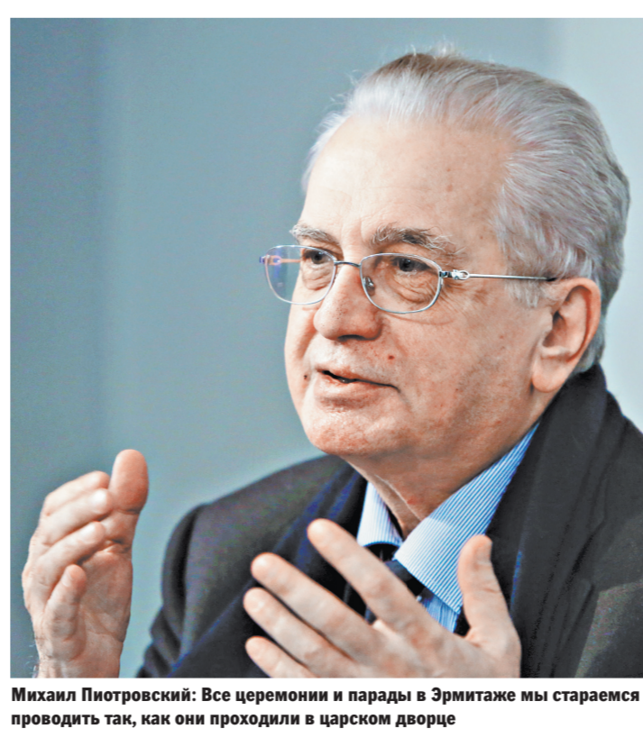
Михаил Пиотровский: Все церемонии и парады в Эрмитаже мы стараемся проводить так, как они проходили в царском дворце

МИХАИЛ ПИОТРОВСКИЙ: Может быть, монархия и не идеальная управленческая система, но эстетически она прекрасна. Лучшие образцы культуры, что ни говори, существуют наверху общества. Питаются снизу, но существуют наверху. Пушкин — это Пушкин.