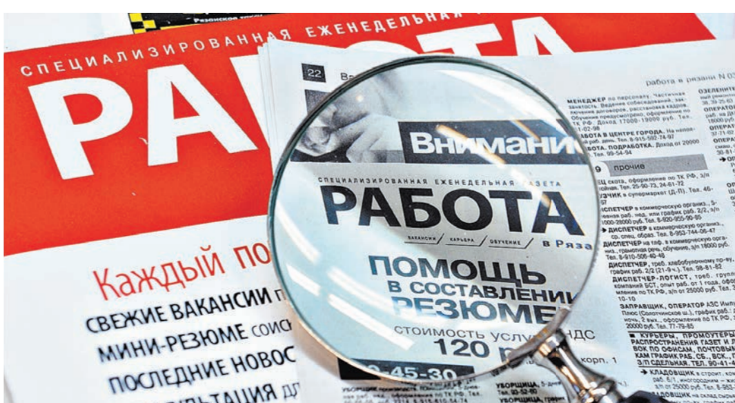
Для людей предпенсионного возраста будут создавать банки вакансий и открывать учебные курсы.

Как пояснили «Российской газете» в Роструде, защите интересов работников старших возрастов сейчас уделяется особое внимание. В октябре в регионах и муниципалитетах создадут специальные комиссии, которые будут работать с предприятиями, где трудятся люди предпенсионного возраста. Их задача — выявить перспективы этих работников, кто из них может остаться трудиться на предприятиях, кто нет, какие рабочие места для них есть в муниципалитете, районе или регионе.