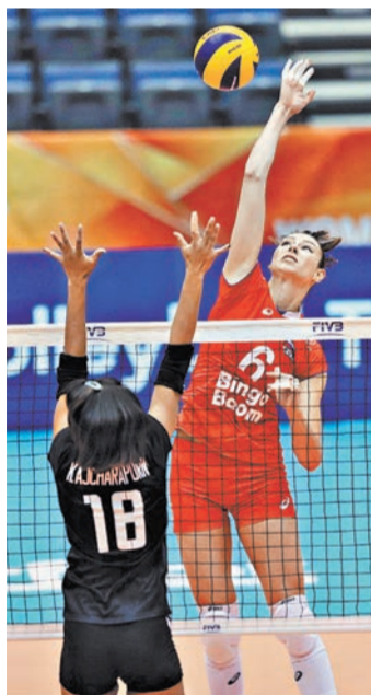
Задача для нашей сборной на первом этапе — войти в сильнейшую четверку.

Кстати, в минувшую субботу исполнилось ровно 30 лет со дня эпитической победы сборной Советского Союза на Олимпиаде в