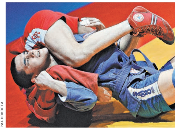
Нашим самбистам не было равных на завершившемся в Северной Ирландии Кубке президента.

Кубок президента подтвердил: в мире выросло немало отличных самбистов. Они во многих командах. А в некоторых странах, где самбо только набирает обороты, в отдельных весовых категориях появились пусть и отдельные, но какие классные мастера. И все они обязательно приедут в Бухарест. Вот где на чемпионате мира 9–11 ноября соберется весь цвет нашего вида спорта.