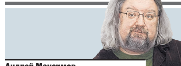
Андрей Максимов писатель, телеведущий