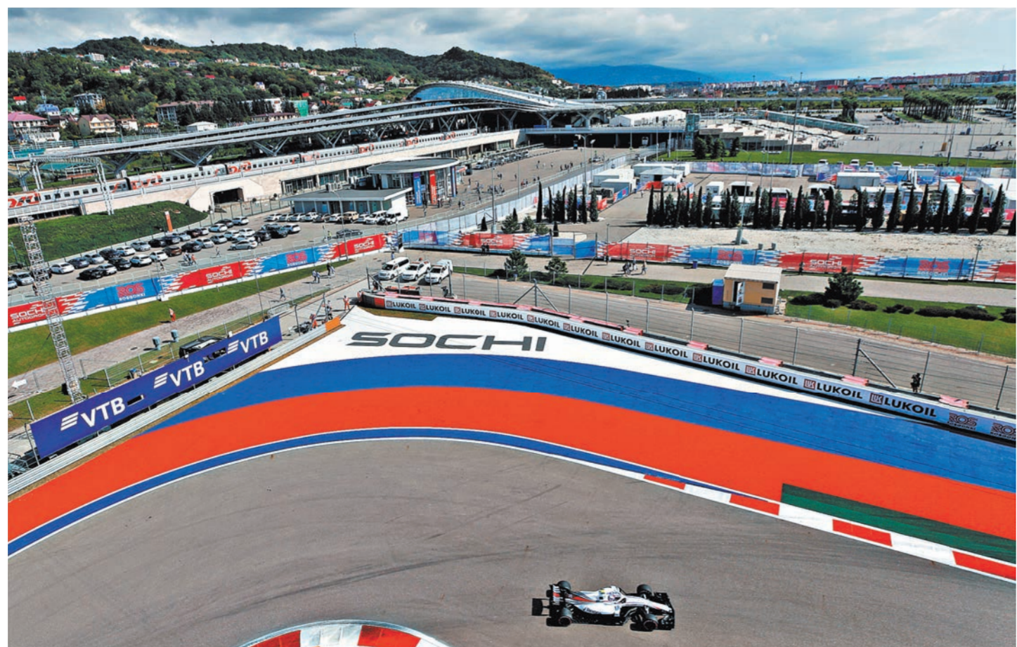
На Гран-при России борьба за попадание в очковую зону шла до самого финиша гонки.

Фото и видео смотрите на сайте rg.ru/sujet/5291