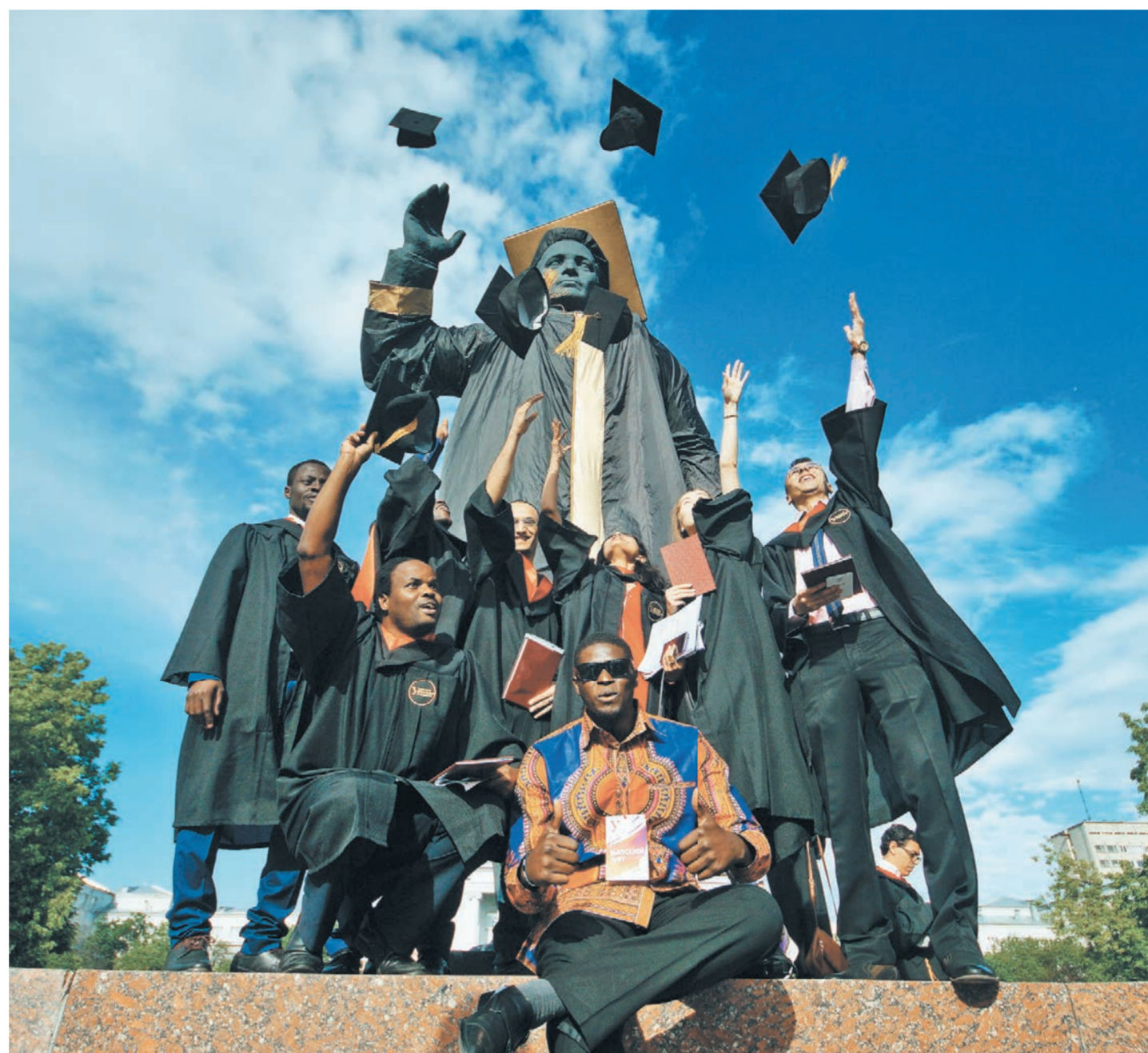
МЕСЯЦ ВПЛАТ / КОМПОЗИЦИОННЫЕ ПРАВА