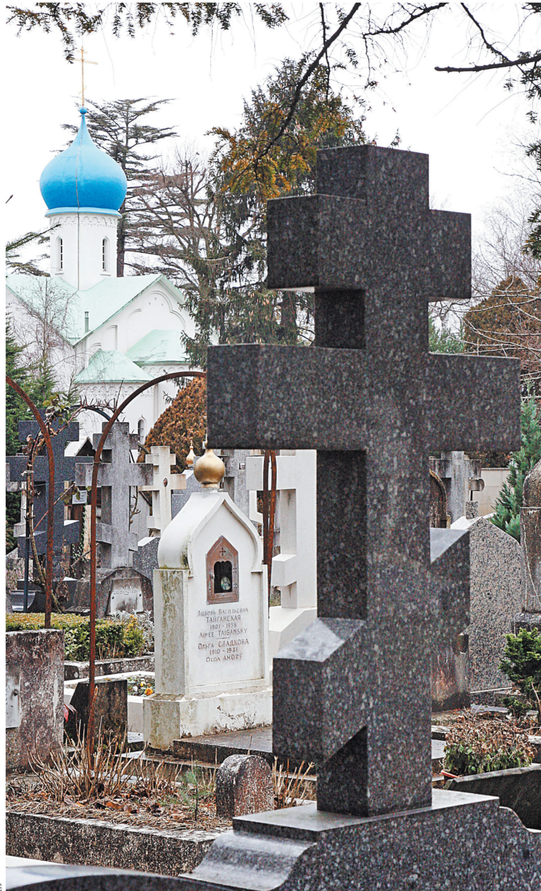
Русский некрополь на знаменитом кладбище не изменится по меньшей мере еще лет 50.