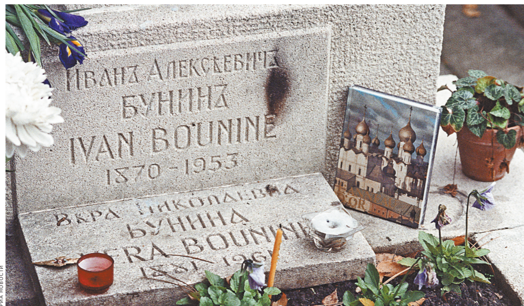
Нобелевский лауреат Иван Бунин и его супруга похоронены на кладбище Сент-Женевьев-де-Буа.

Как сообщили «РГ» в посольстве РФ во Франции, за последние годы совместно с мэрией Сент-Женевьев-де-Буа выработан надежный механизм, предусматривающий выделение российскому государству на регулярной основе средств, необходимых для продления концессий, срок которых подходит к концу. Так, например, в 2017