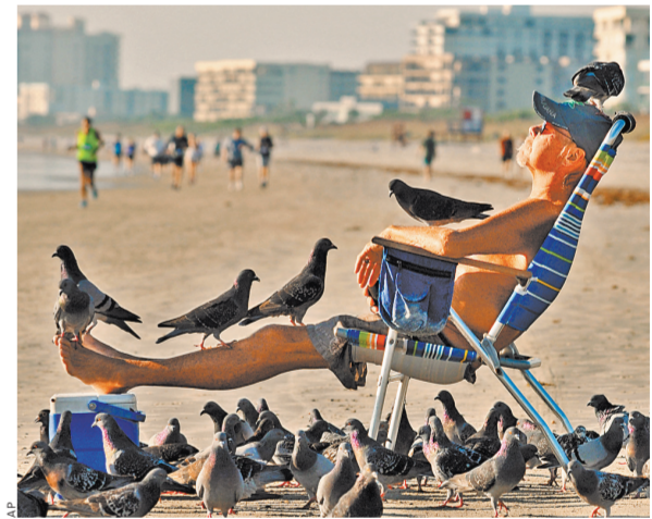
Не стоит пренебрегать простым советом врачей-онкологов: не сжигайте себя на солнце, как бы вы его не любили.