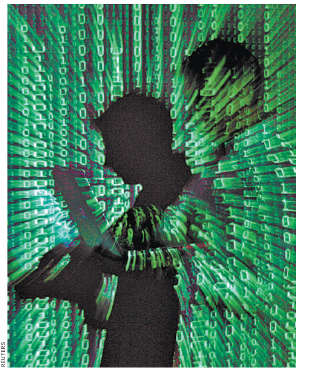
Взаимное оповещение об опасностях внутри ЕАЭС усилит кибермошенникам атаки с территории соседних стран.

Именно на России хакеры часто тестируют новые виды атак, а затем переносят их на сопредельные страны