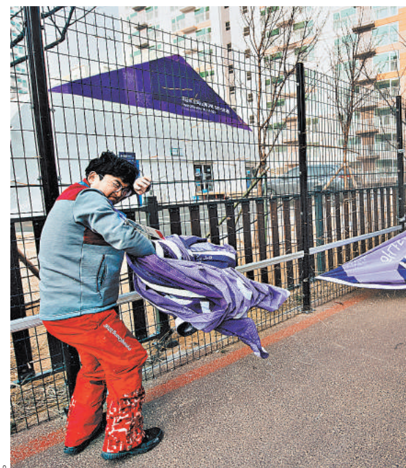
Погода внесла серьезные коррективы в расписание олимпийских стартов.

Ветер в конечном итоге добрался до Олимпиады. Что неудивительно, поскольку очень многие объекты инфраструктуры на Играх представляют собой временные шатры. В обычных условиях находиться в них весьма комфортно. Теперь же стены и потолок ходят ходуном так, что нет уверенности в том, что эта конструкция не сложится как картонный домик. Очевидно, так же посчитали и в оргкомитете. Сначала просто рекомендовали журналистам, работающим в олимпий-