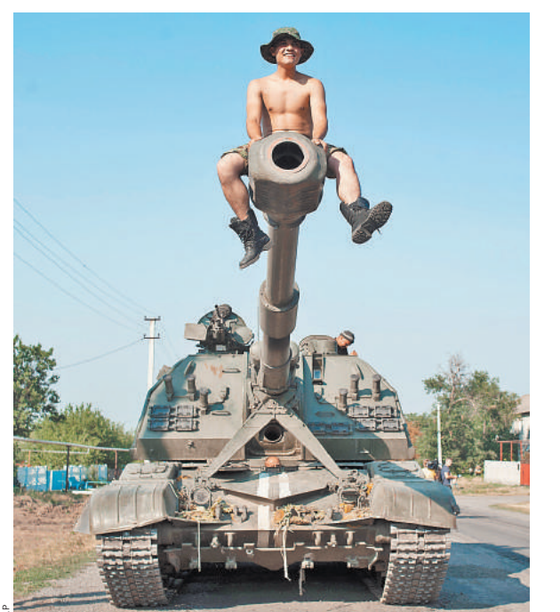
Украинский военнослужащий позирует на стволе орудия перед отправкой бронетехники на Донбасс.

Во вторник диагноз Украине поставили вытолканный в шее с Украины на территорию Польши экс-президент Грузии Михаил Саакашвили. Он назвал украинское государство «нуждающимся в генеральной уборке», поскольку страна «нерботоспособная и самая бедная в Европе». И объяснил причины: «семь олигархов взяли в заложники все богатство Украины исключительно для собственного обогащения».