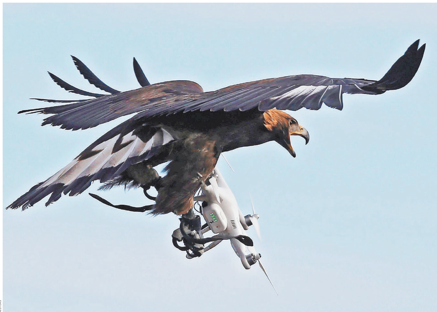
Избавиться от надоедливой дрона можно не только с помощью оружия, есть уже опробованная практика перехвата беспилотников с помощью хищных птиц.

1 Сегодня, напомним, контролем за полетами беспилотников занимается Росгвардия. Полномочия силовых ведомств могут быть расширены и при угрозе терактов. Беспилотники-нарушители могут быть принуждены к посадке, повреждены или уничтожены. Но это пока обсуждают.