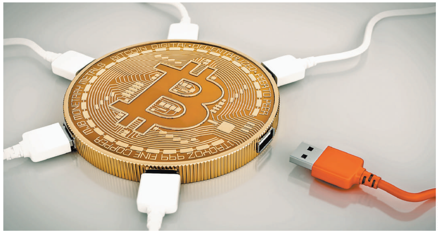
Криптовалюты часто связаны с отмыванием денег и финансированием терроризма, а потому их регулирование неизбежно.

Некоторые специалисты вы- сказывают опасения, что опера- ции с криптовалютой позволяют их участникам легко и без препят- ствий переносить свои «офисы» за границу: ведь для блокчейн- проектов размера ноутбука вполне достаточно. Так они уже решают свои личные и частные пробле-