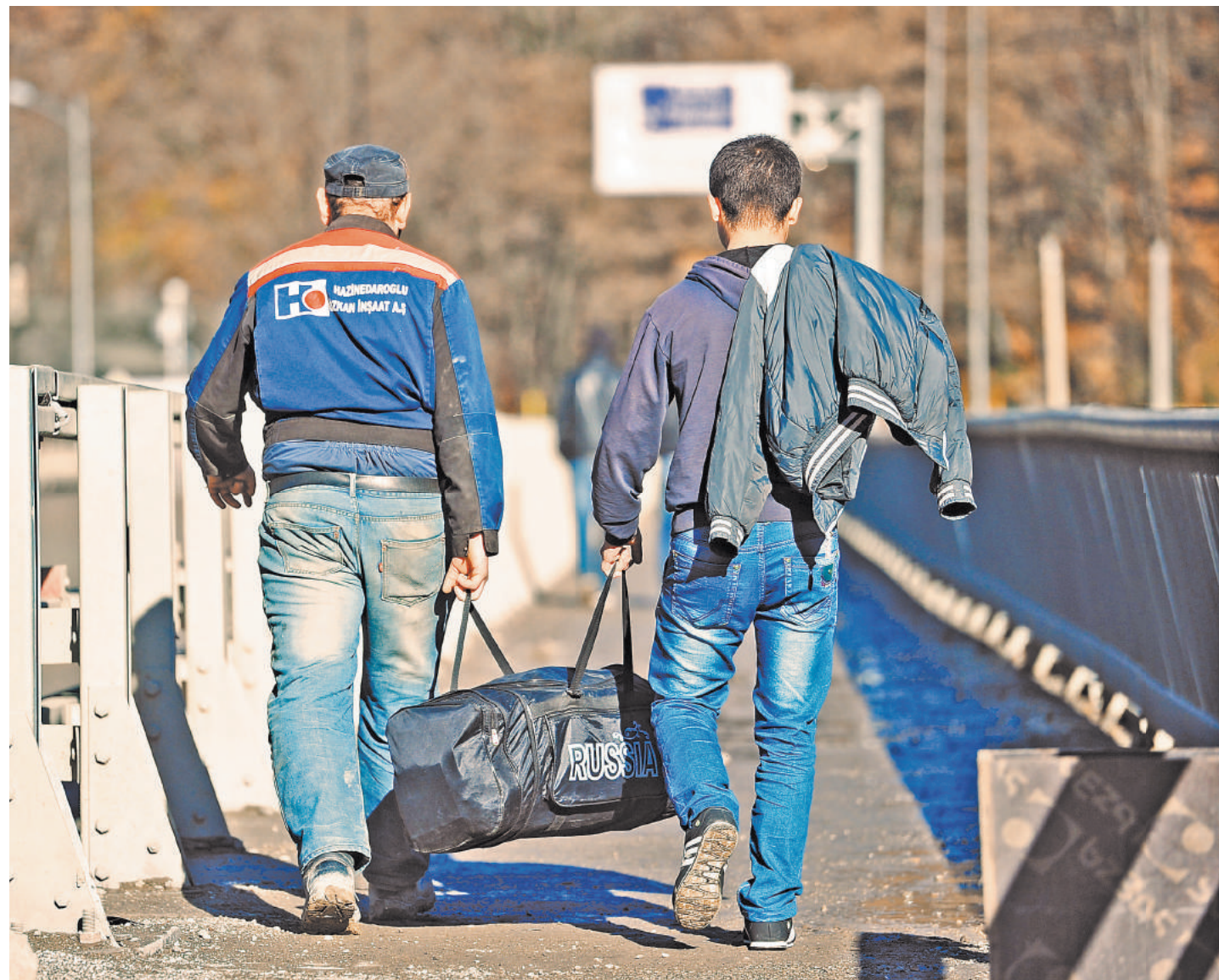
ВЛАДИМИР СЫРЬОВ / ТАСС