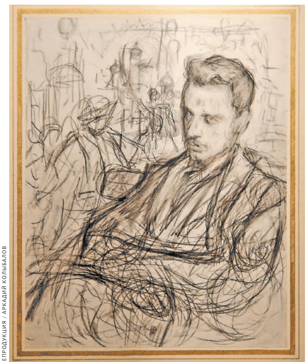
Самый знаменитый портрет Рильке — карандашный набросок работы Леонид Пастернака.

Кажется, можно показать в выставочном пространстве некую «связь» литератора с чужой страной? Письма, фотографии, издания? «Рильке и Россия» — это не филологическое мероприятие для знатоков. Выставка сделана довольно просто, концептуально и наглядно. По разным залам бродить между скромных строгих стеллажей, которые напоминают архитектуру Малевича, но ассоциация неуместна: модернистская Россия Рильке не интересовала, только — архаика, только то, что отличает ее от Запада. Оформление не отвлекает: письма и фото подсвечены холодным светом. Действительно — все видно, и карандашные надписи Марины Цветаевой на крышечках книжках Рильке, и автографы поэта. Отличный у него был почерк, между прочим, — даже на русском! Экспонаты были собраны по разным архивам, некоторые предоставили наследники Рильке.