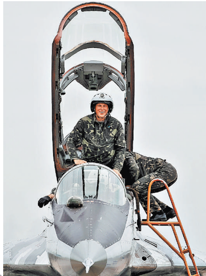
После ремонта хорватских МиГов на украинском ремонтном заводе у них стало подтекать топливо и начала барахлить навигационная аппаратура.

Но, как заверили в российской самолетостроительной корпорации «МиГ», модернизация истребителей МиГ-29 ВВС Украины не безопасна для дальнейшего использования. «Продление ресурса МиГ-29 на 20–40 лет на мощностях имеющихся на Украине ремонтных заводов попросту небезопасно для дальнейшего их использования. Так как устаревшая конструкторская документация,