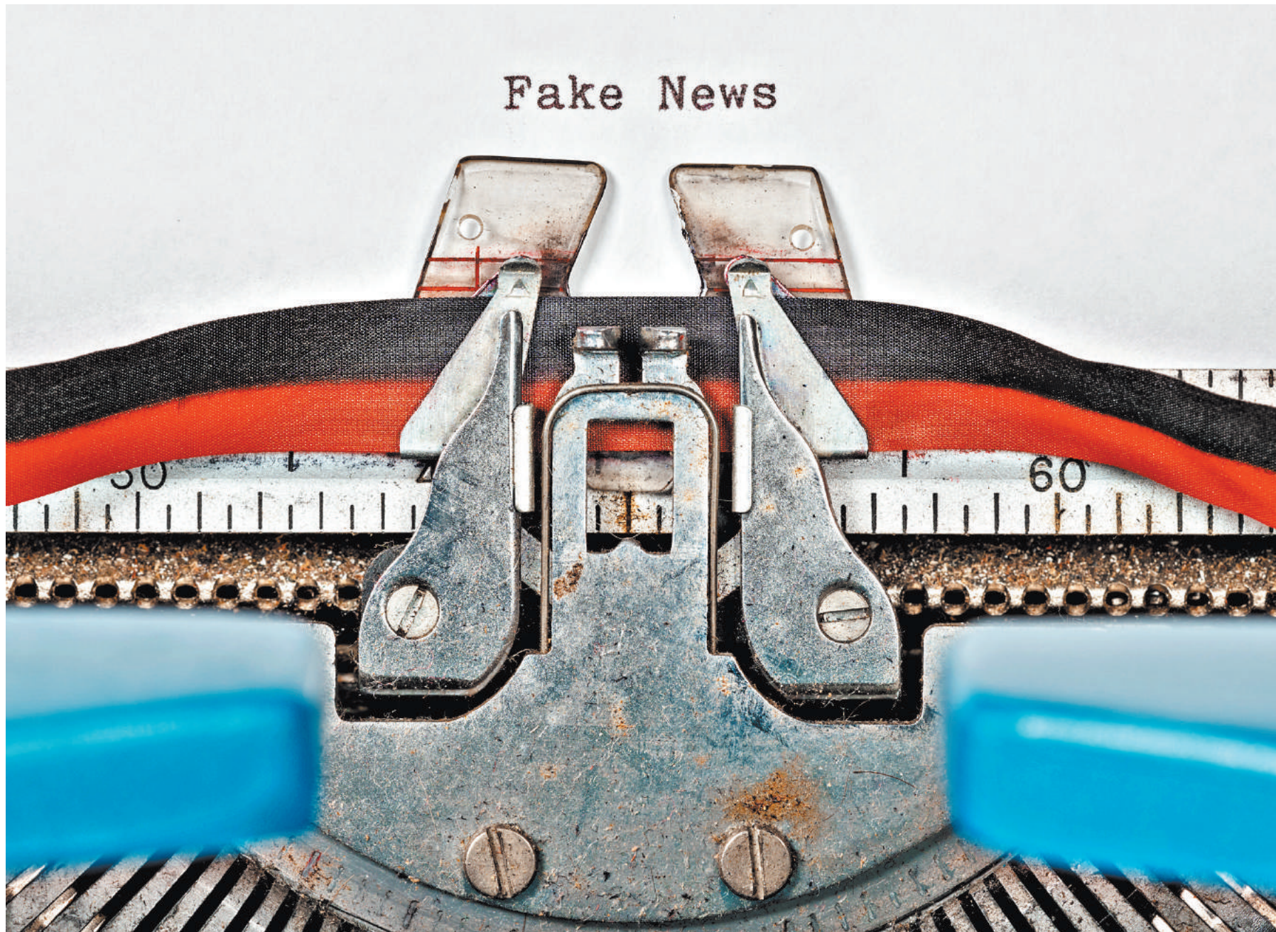
Высший совет Франции по аудиовизуальным средствам информации получит право отбирать у СМИ лицензию на вещание, если сочтет транслируемые сведения недостоверными.