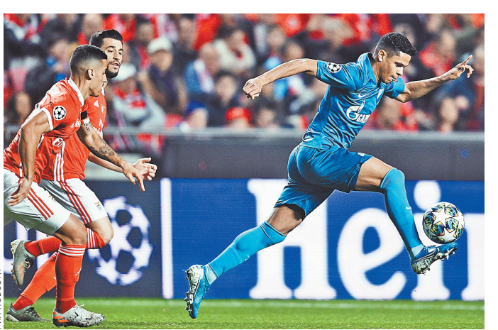
В 2019 году наши клубы потратили на новичков 285,6 миллиона долларов.

Продолжает привлекать к себе внимание европейских клубов Федор Чалов. На этот раз появилась информация об интересе к форварду ЦСКА со стороны «Вест Хэма». Главный тренер «молотков» Дэвид Мойес подтвердил, что его клуб готов пригласить россиянина. Остается теперь дождаться реакции армейцев. ●