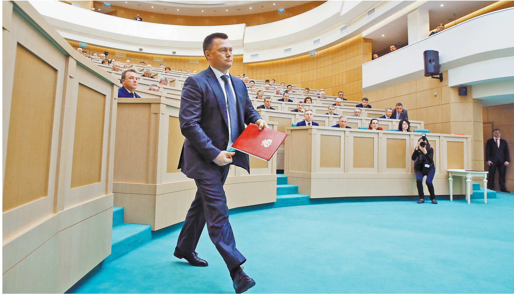
Игорь Краснов одной из важнейших своих задач назвал борьбу с коррупцией.