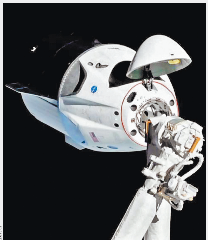
19 января г.г. компания SpaceX успешно испытала спасательную систему своего нового космического пилотируемого корабля Crew Dragon.