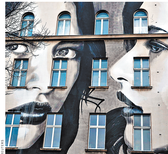
Для счастливой совместной жизни печать ЗАГСа не нужна. А вот заранее оформить права на недвижимость стоит.

В последние годы пара жила в частном доме. Городской квартире сдавали. Все деньги за аренду гражданский муж перечислял сожигателю. После его смерти гражданская жена пошла к нотариусу для получения наследства, а параллельно подала заявление в суд, чтобы подтвердить, что жила на иждивении гражданского супруга. Другой иск она подала о признании права собственности на его квартиру.