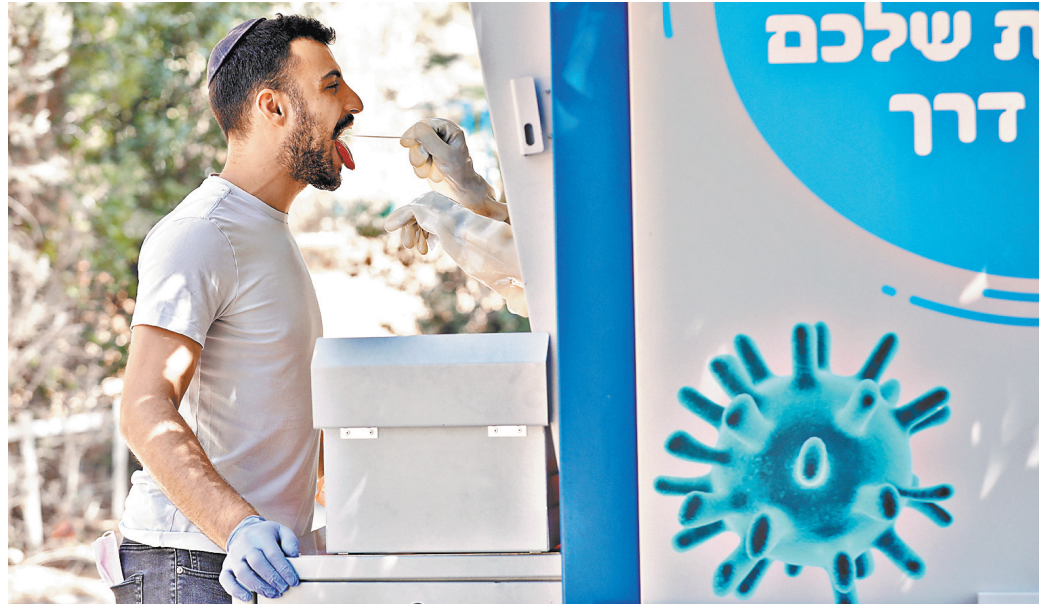
С 18 сентября в Израиле вновь закроют школы, детские сады, отели, рестораны и торговые центры.