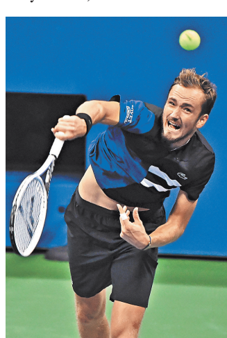
Даниил Медведев во второй раз в карьере примет участие в Итоговом турнире года.

— Это был отличный матч. Все произошло совершенно неожиданно и непреднамеренно.