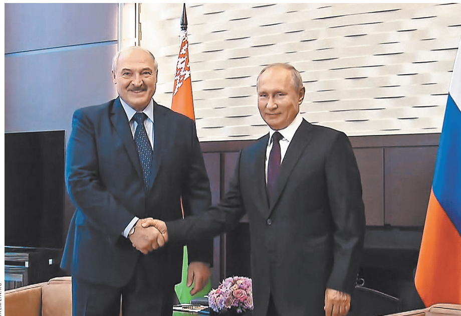
В повестке дня переговоров президентов России и Беларуси — ключевые вопросы двусторонних отношений.

Предложение Александра Лукашенко начать работу по Конституции Владимира Путина назвал логичным, своевременным, целесообразным.