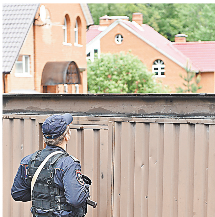
Если дом ограблен, потерпевшие должны точно указать, что у них пропало.

По его словам, в судебной практике встречается случай умышенного завышения суммы ущерба потерпевшими. «В связи с этим доказывание суммы имущественного вреда должно учитывать эти обстоятельства, и для достижения достоверного вывода требуются не только показания потерпевшего, но и иные доказательства, как правило, из независимого источника, — говорит Евгений Рубинштейн. — К