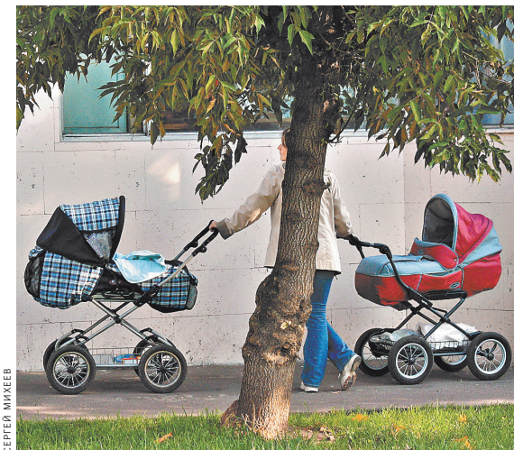
С 15 апреля сертификат на материнский капитал в беззаявительном порядке получили более 335 тысяч семей.

Как пояснили в Минтруде, все эти меры соцподдержки и соцобеспечения составляют обязательные расходы Пенсионного фонда. Его доходы на 22% формируются из страховых взносов на обязательное пенсионное страхование, а также за счет средств, которые поступают в качестве трансфертов из федерального бюджета, и прибыли, полученной от реализации конфискованного имущества, инвестирования и временного размещения средств пенсионных накоплений. При этом общий бюджет Пенсионного фонда в 2021 году составит 9,6 трлн рублей. Несмотря на то, что для отдельных категорий плательщиков страховых взносов со следующего года предусмотрены льготы (например, для организаций, занятых в области информационных технологий, отчисления снижены до 6%), дефицита в бюджете Пенсионного фонда не предвидится, благодаря привлечению переходящих остатков на начало 2021 года, пояснили в Минтруде. Проект бюджета планируется обсудить на заседании Российской трехсторонней комиссии по регулированию социально-трудовых отношений.