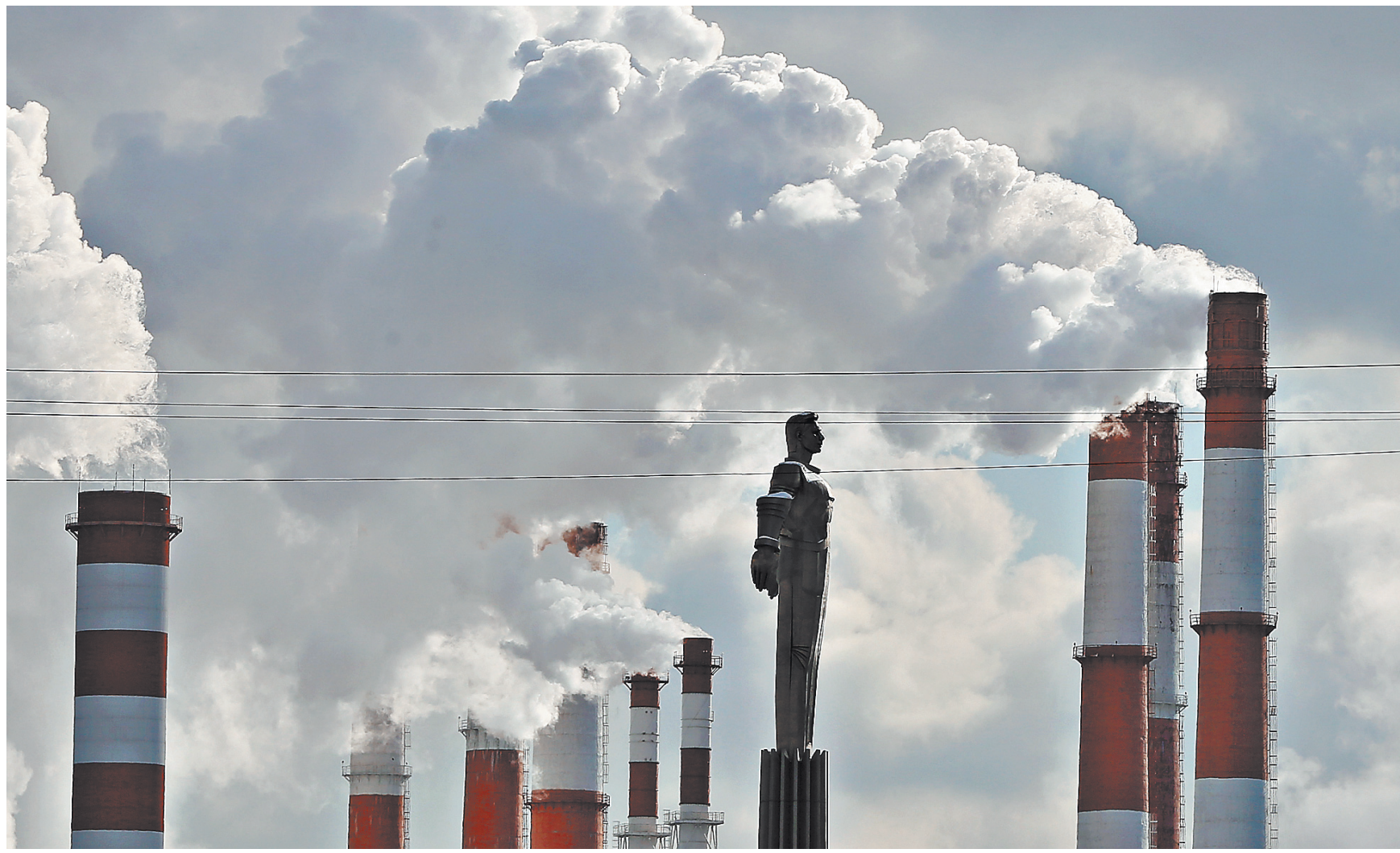
Для Росприроднадзора лучший результат любой проверки — ноль выбросов, загрязнений и ущерба.

Вакансий разработчиков на языке Java оказалось 11,7 % от общего числа в «удаленном» IT. В число самых востребованных также вошли разработчики на C# (номер 3), PHP (номер 4), Kotlin (номер 8), Python (номер