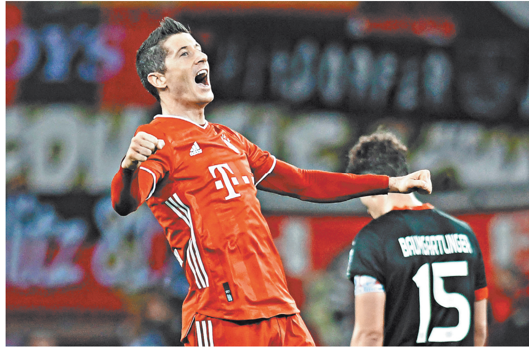
Левандовски провел отличный прошлый сезон и не сбавляет оборотов в нынешнем.

Также ФИФА объявила символическую сборную года. В нее попали: Алиссон («Ливерпуль»), Кевин де Брюйне («Манчестер Сити»), Йозуа Киммих («Бавария»), Тьяго Алькантара («Ливерпуль»), Лионель Месси («Барселона»), Кристиану Роналду («Ювентус»), Роберт Левандовски («Бавария»). ●