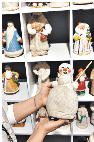
В ArtStory история начинается с коллекции дедов-морозов...