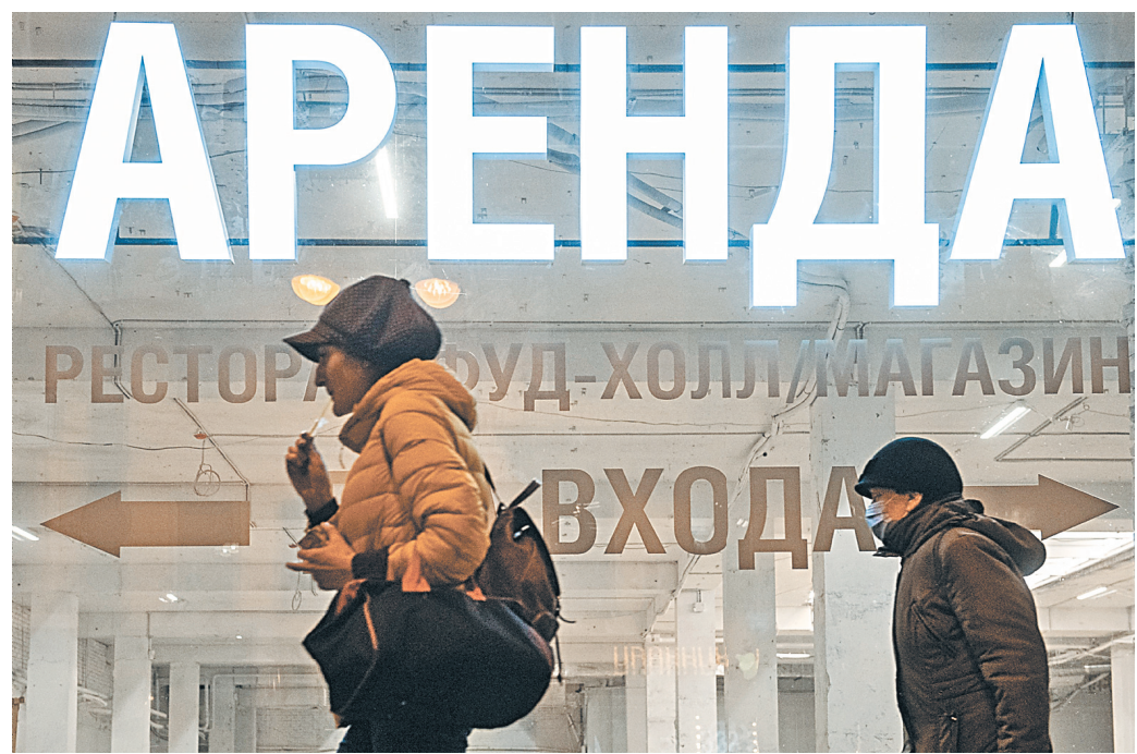
По прогнозам аналитиков, доля свободных помещений к середине 2021 года увеличится до 16 процентов.

ПРОЦЕНТА составляет доля пустых ресторанов в центре столицы