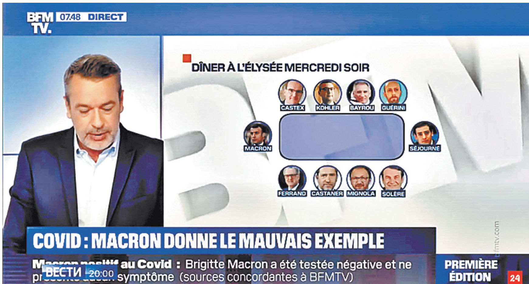
Вернувшись из Брюсселя, Макрон поужинал в Елисейском дворце с соратниками. По левую руку от него сидел премьер Жан Кастекс, по правую — спикер Национального собрания Ришар Ферран.