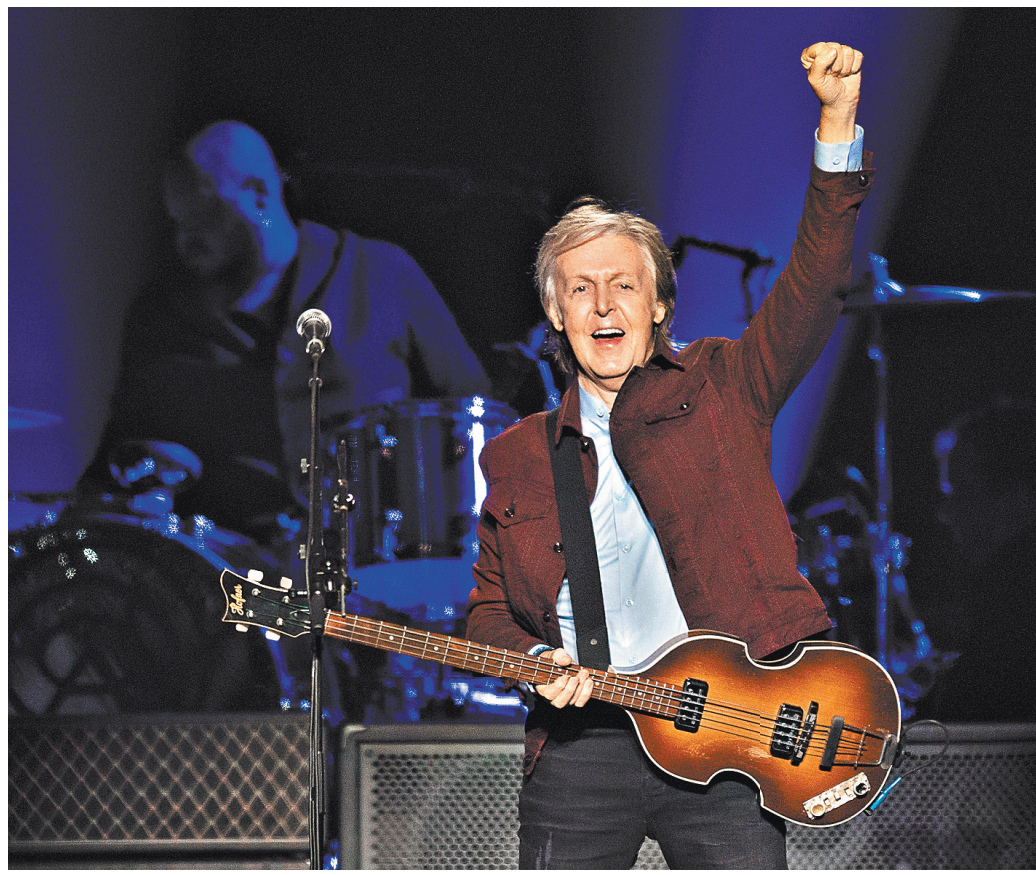
Над альбомом Пол Маккартни работал один, на своей ферме. Правда, есть трек, записанный с гитаристом и ударником.

Кстати, может быть, и благодаря влиянию ранней Тейлор Свифт (если такое можно представить) сэр Пол попробовал себя на McCartney III и в стиле кантри, к которому, впрочем, уже обращался на альбоме Ram 1971 года. Вот и его новый кантри-трек Womem And Wives тоже заслуживает уважения и мировых чартов. Между прочим в этом году и Маккартни, и Свифт должны были стать хэдлайнерами главного британского open-air в Гластонбери. А накануне сэр Пол даже пригласил элегантно и улыбающую блондинку к себе в гости. Тейлор потом рассказывала, что очень робела и смущалась, спеша домой к легенде. Появилась одна, без своей привычной свиты и охраны. И вначале даже не знала, что сказать, стеснялась. Но потом они разговорились и даже подружились.