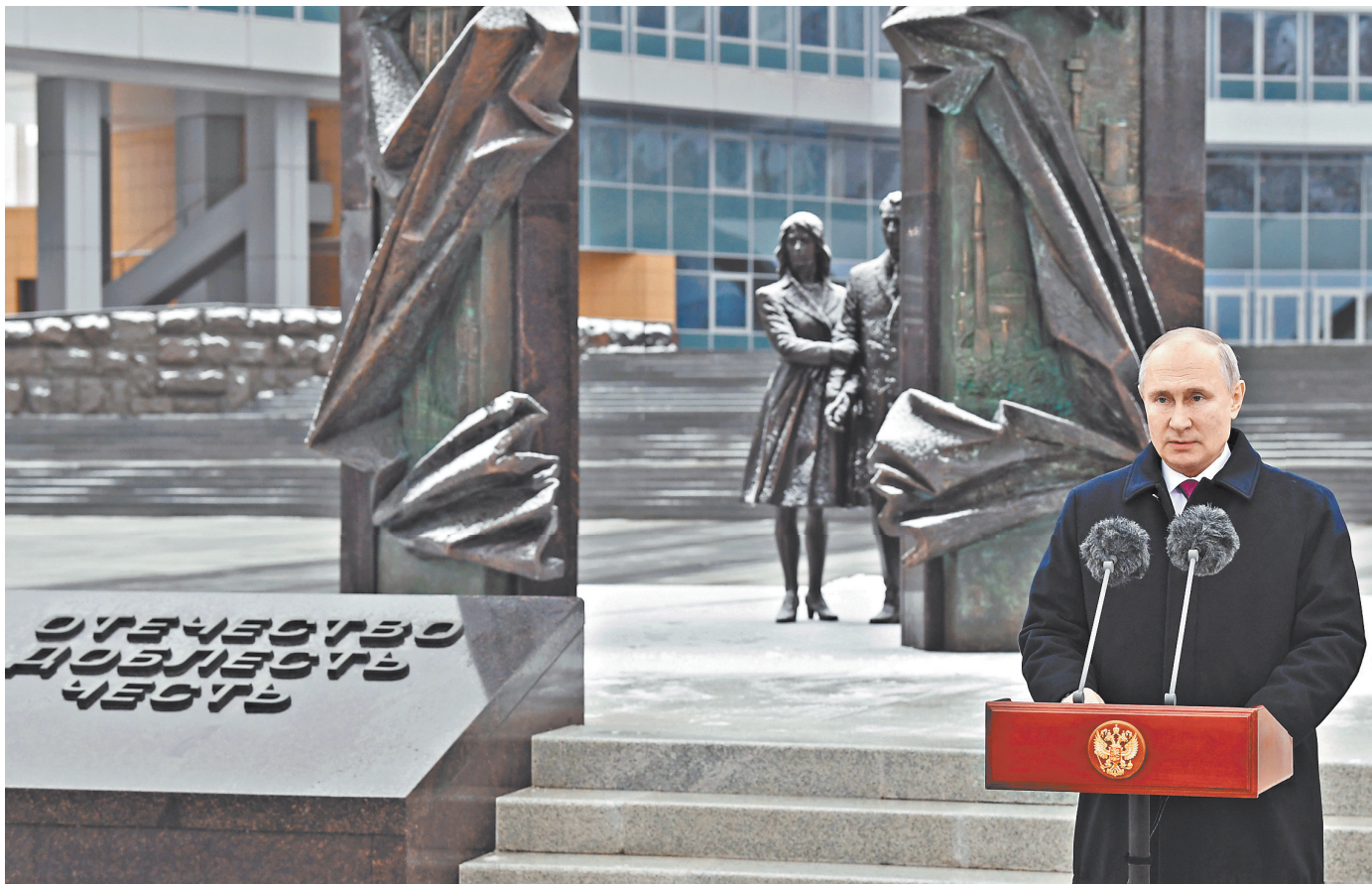
Глава государства возложил цветы к памятнику в честь отечественных разведчиков.

«В одном боевом строю с сотрудниками СВР представители всех российских органов безопасности», — продолжил президент. «Мы по праву гордимся славными страницами истории ваших ведомств», — подчеркнул