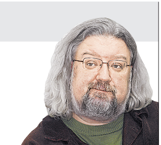
ВКЛ Андрей Максимов, писатель, телеведущий, режиссер