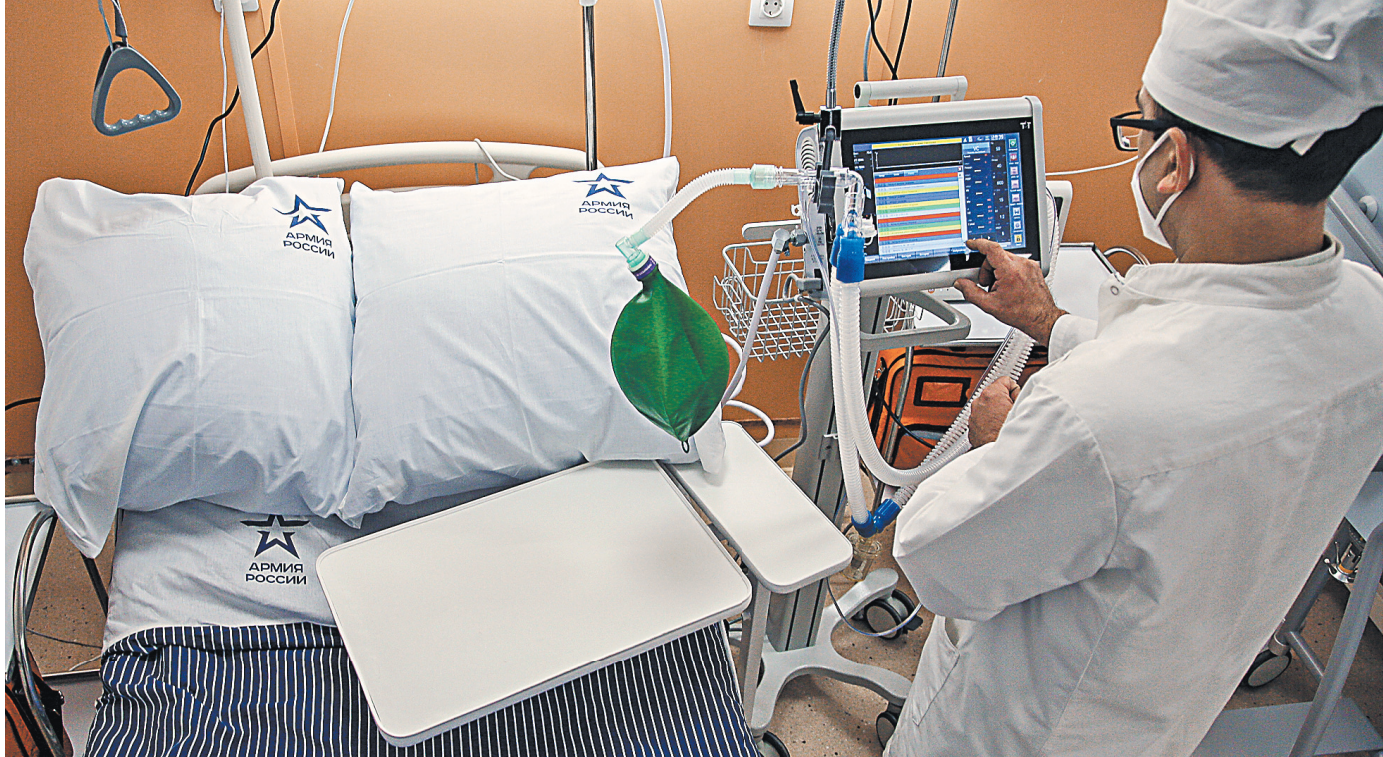
В декабре в Североморске был открыт ультрасовременный военно-морской клинический госпиталь.

Для обеспечения бесперебойных поставок стройматериалов и конструкций Минобороны России была выстроена особая логистическая схема. К примеру, доставка стройматериалов и спецтехники для возведе-