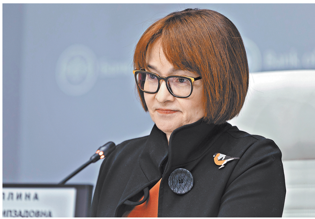
Брошь Эльвиры Набиуллиной в виде снегиря может подчеркивать период заморозок — как ключевой ставки, так и цен на некоторые продукты.

Вице-спикер Госдумы Ирина Яровая напомнила, что сейчас многие больные коронавирусом лечатся на дому. «Мы доставляем лекарственные препараты, но нигде и никогда этим больным не выдавались памятки о порядке их действий в отношении тех медицинских отходов — и инъекций, если таковые имеются, и индивидуальных средств — с точки зрения безопасности», — сказала она. Одновременно должна предоставляться информация о том, какие правила нужно соблюдать, чтобы не подвергать риску жизнь своих близких, соседей.