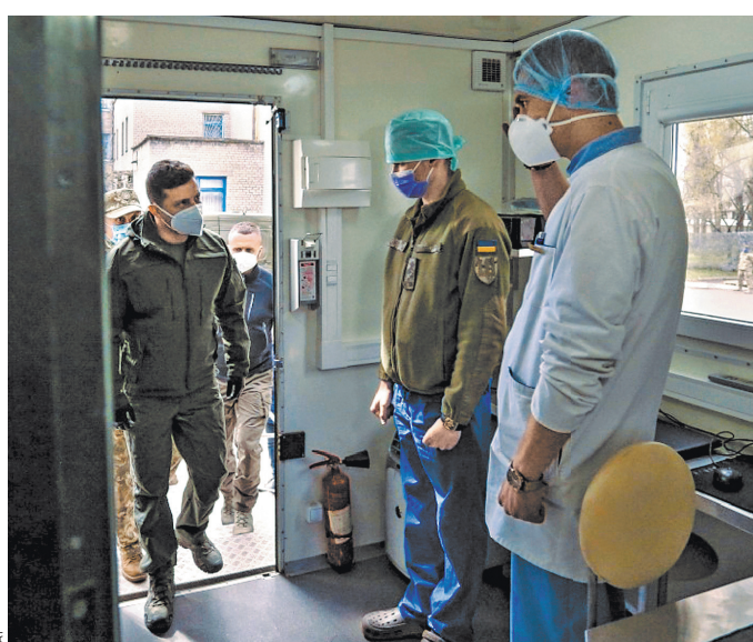
Для Зеленского стало обидным открытием, что никто в мире, кроме России, не готов поставлять на Украину вакцину.