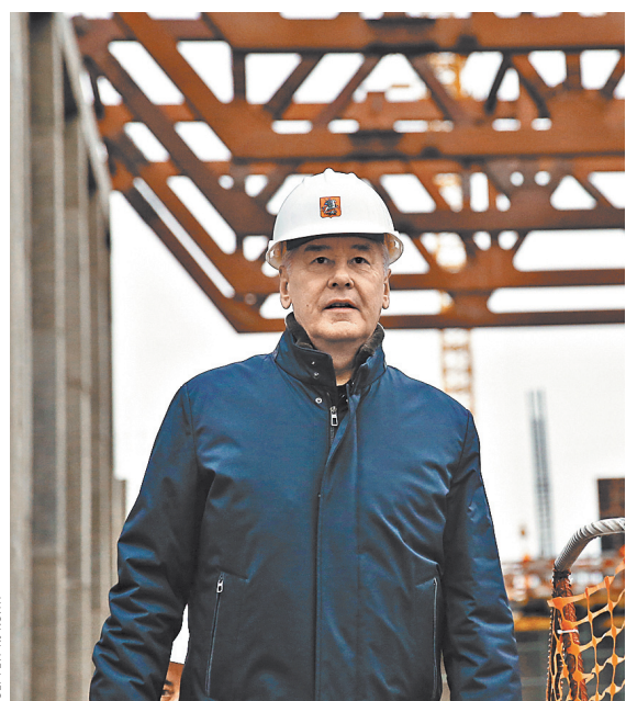
Сергей Собянин: Новые спортобъекты появятся в «Лужниках» в 2021 году.