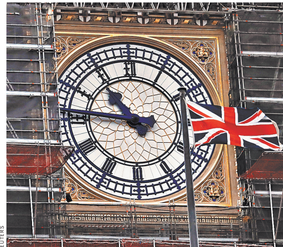
Этим часам предстоит поставить символическую точку в пребывании Британии в составе Евросоюза.