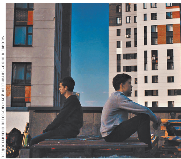
Фильм «Зови меня Дрозд» несет в себе живой урок воспитания чувств без тени менторства и назиданий.

Пресловутая бесконфликтность? Да здесь всё — тончайшей выделки конфликт! Все герои фильма собою пытаются совладать с тем неизвестным, что зреет в душе подростка. Именно его, Кости, существование не дает родителям окончательно порвать с прошлым. Именно они, родители, успели заложить в нем нечто важное, что определит всю его жизнь. Именно поэтому он не может переступить через себя и, влетев на скутере в чужой автомобиль и скрывшись с места преступления, решает заработать деньги на ремонт, все-таки прийти к повинной. Его соучастница Дина более цинична и видит в этом чудачестве. Ровесница Кости, она выглядит старше и опычнее — как всегда в этом возрасте выглядит девочка, имеющие все основания на одноклассников