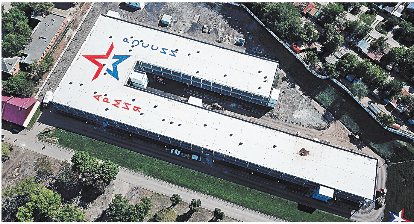
Многофункциональный медицинский центр в Ростове-на-Дону — для больных с различной инфекционной патологией.