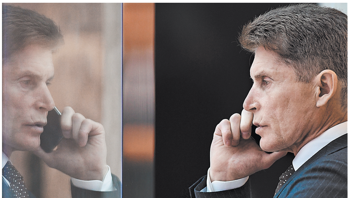
Олег Кожемяко уверен: Вирус отступит, и нормальная жизнь обязательно восстановится.

Главное — надо беречь себя и своих близких, особенно людей старшего поколения. Остальное поправимо