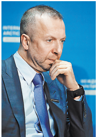
Погибший Дмитрий Босов занимал 86-ю строчку в списке «Форбс».

— Полную версию интервью читайте на сайте «РГ» rg.ru/art/1875949