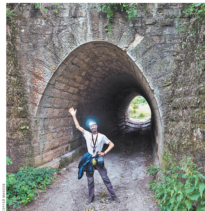
Туннели — очень романтично!