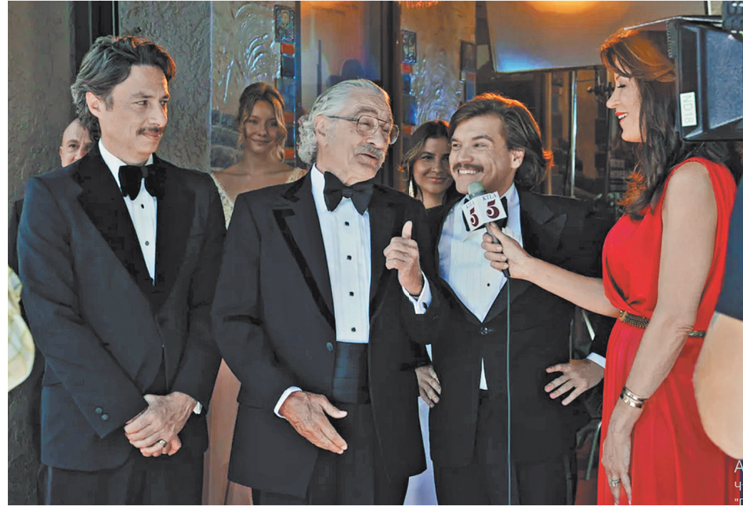
Какой ценой дается счастье надеть накрахмаленную премьерную рубашку — о том вам расскажет Роберт Де Ниро.

У нас фильм уже был в прокате — и, разумеется, растворился без осяда. Теперь он выходит в онлайн-кинотеатрах — вам дается новый и последний шанс.