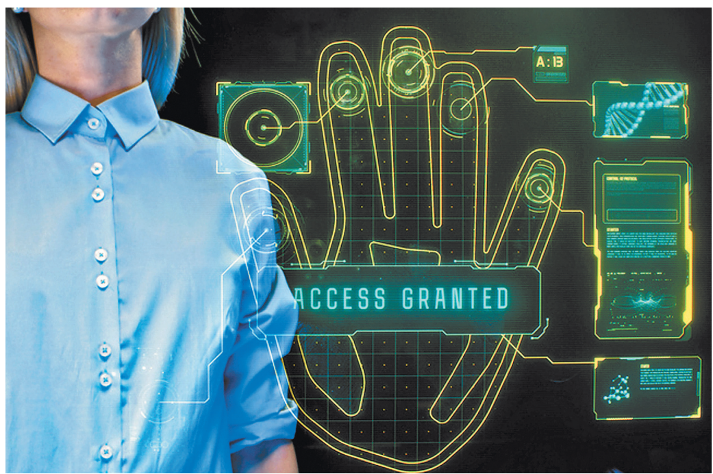
Некоторые крупные банки уже внедрили идентификацию по рисунку вен.

Семьи могут и рефинансировать кредит по льготной ставке