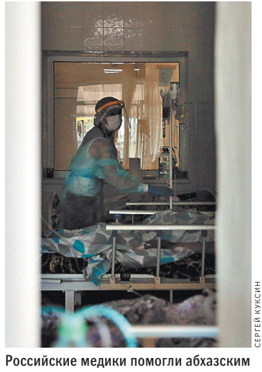
Российские медики помогли абхазским коллегам справиться с высокой нагрузкой на пике заболеваемости.