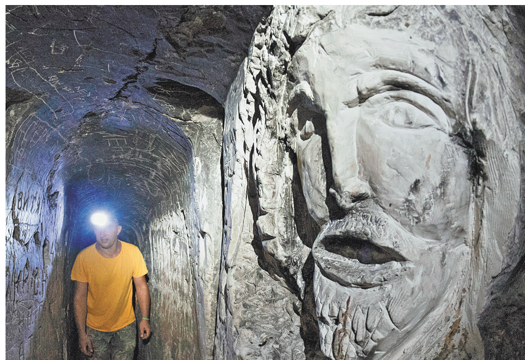
Если долго всматриваться в стены пещер Шатрища — стены начинают всматриваться в тебя.