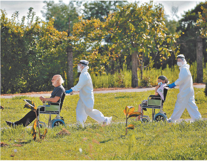
Гудаутская больница вылечила от ковида более 3 тысяч абхазов. Без нее могильных курганов в стране было бы на порядок больше.