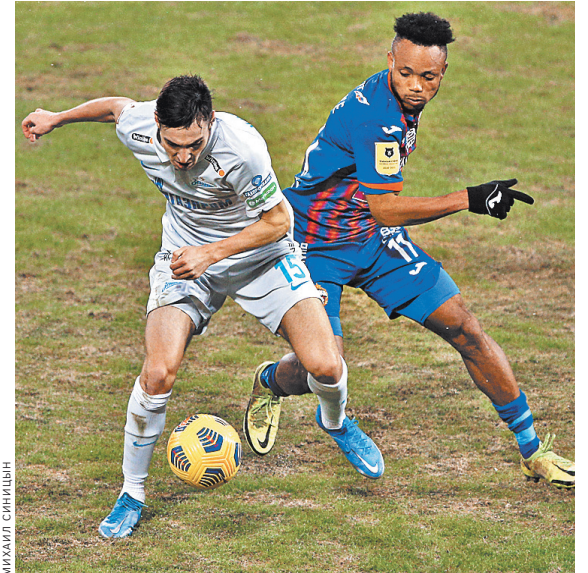
После двух ничьих подряд «Зенит» сыграет на своем поле с ЦСКА, который отстает от питерцев лишь на два очка.

МЕЖСЕЗОНЬЕ В «ПСЖ» заявили, что не будут мешать Мбаппе уйти из клуба