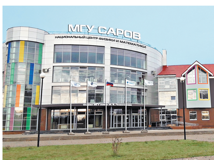
Основной Национальный центра физики и математики станут учебные корпуса МГУ Саров, передовые лаборатории РФЯЦ-ВНИИЭФ и объекты технопарка «Саров», главное здание которого уже передано университету.