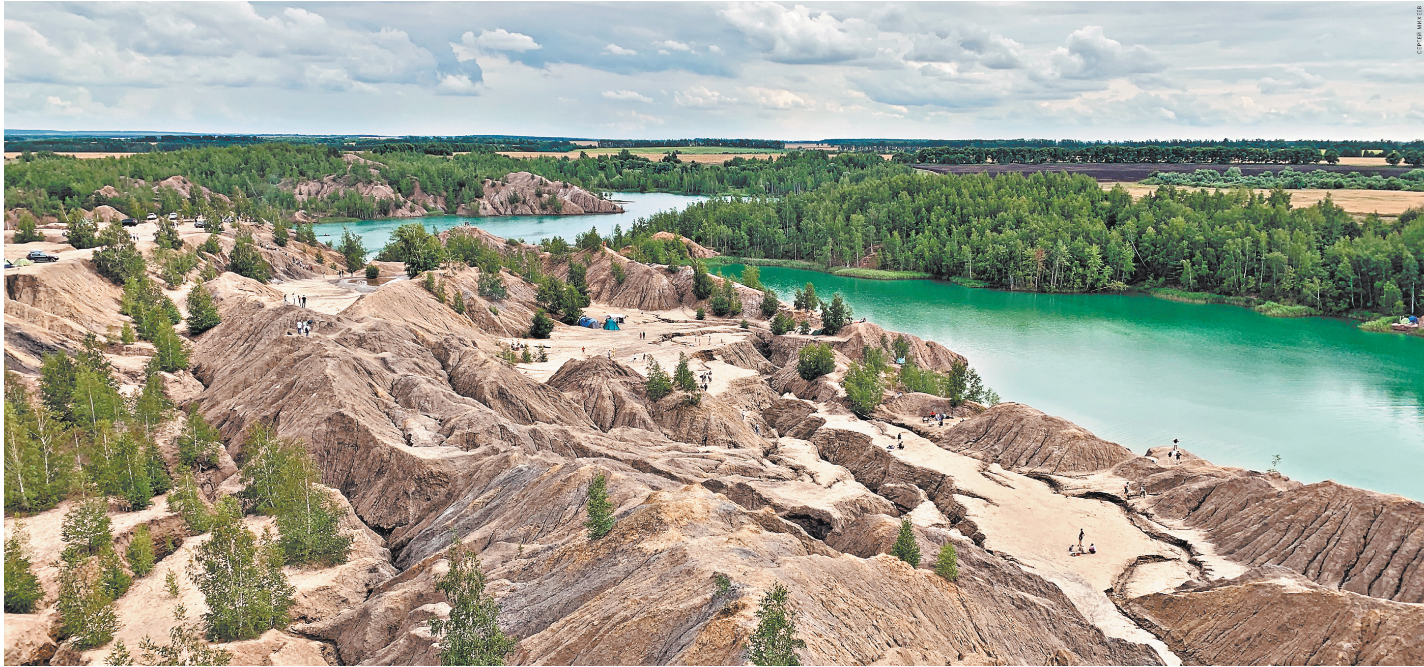
Кондуки — белые терриконы и бирюзовая вода, по-инопланетному красиво.