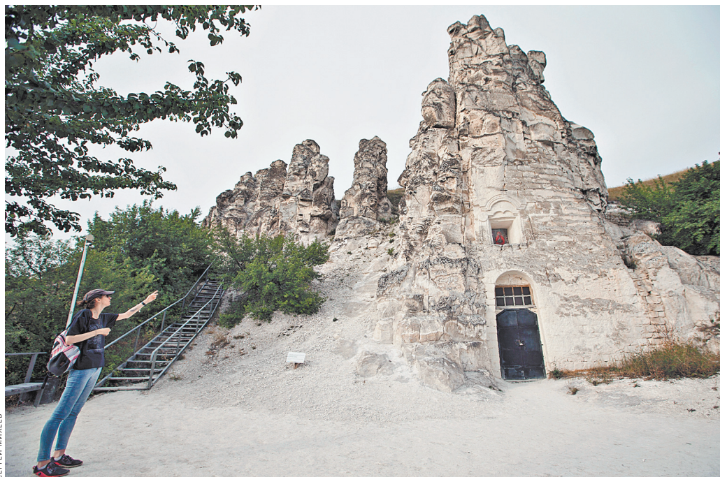
Дивногорье — в меловой скале вырублен храм — и вправду диво!

Утром (нелюбителям вставать с первыми лучами рекомендую надевать сразу с вечера на глаза маску для сна) вываливаемся в сапогах и с фотоаппаратом в туман — роса и солнце, день чудесный! Вдоль нафотграфировались, умываемся и варим кофе. На горизонте начинает маячить УАЗик нашего воронеж-