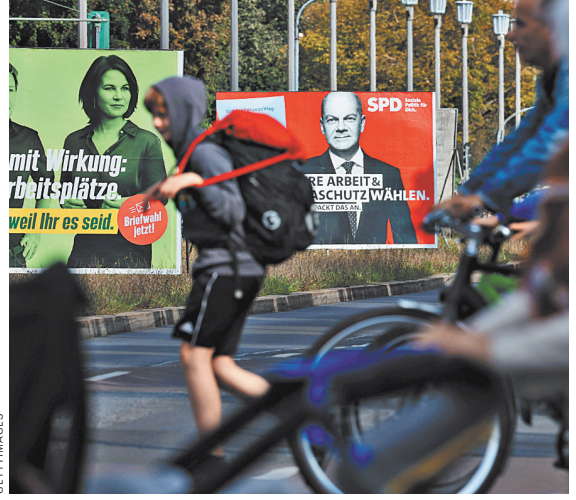
Кандидаты Аннелена Бербок от «Зеленых» и Олаф Шольц от СДПГ (справа) сулят избирателям с плакатами всеобщие блага.

Хотя Социал-демократическая партия Германии в своем манифесте «Для тебя. Наша программа будущего» местами также опонирует России, но там все же есть конструктив: «Это в германских и европейских интересах, если мы сумеем вместе с Россией добиться прогресса в вопросах общей безопасности, разоружения и контроля над вооружениями, а также климата, устойчивого развития, энергетики и борьбы с пандемиями... Мир в Европе возможен только с Россией, но никак не против нее». Социал-демократы не отрицают членство ФРГ в НАТО, но считают, что «параллельно ЕС должно становиться самостоятельным в вопросах безопасности и оборонной политики». Партия не в восторге от взятго Германией (как и другими нациями) обязательства каждый год отчислять на оборону 2 процента ВВП страны.