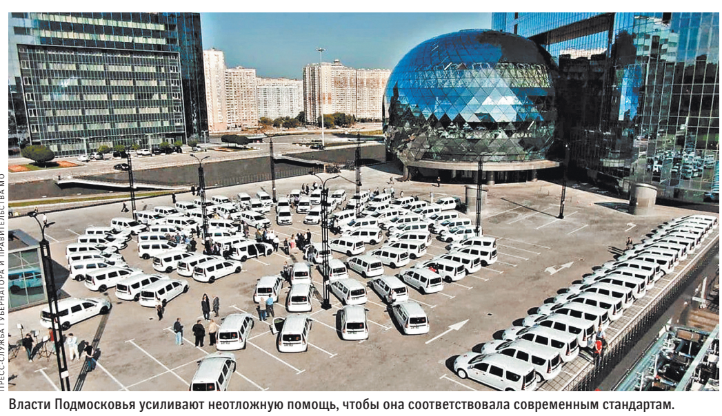
Власти Подмоскowie усиливают неотложную помощь, чтобы она соответствовала современным стандартам.

Андрей Воробьев заверил, что оставшиеся 179 автомобилей неотложной помощи поступят в муниципалитеты к концу октября. А до конца года власти закупят еще 150 машин для оказания экстренной помощи. Это полноценные реанимобили, оснащенные всем необходимым для реанимационного оборудования. В том числе и аппаратами для непрямого массажа сердца последнего поколения. Они все реанимационные действия производят самостоятельно, освобождая руки врачам, которые в этот момент могут оказать больному дополнительную помощь. ●