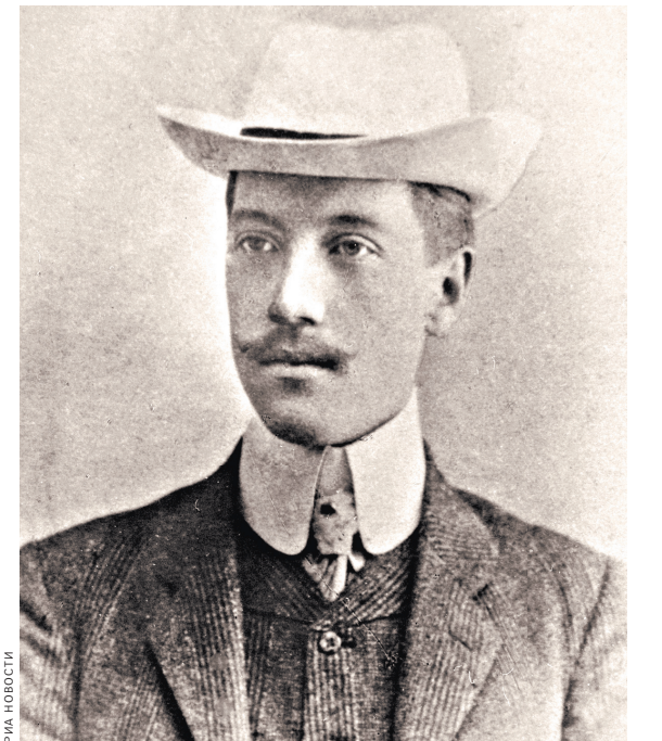
Свою смерть бывший боевой офицер Николай Гумилев встретил с выдержкой и достоинством.

Факт, что Гумилев, не написавший за всю свою жизнь ни одного политического стихотворения, был убежденным монархистом и не скрывал этого после революции. К тому же он был офицером царской армии, принимавшим участие в русско-немецкой войне и получившим два Георгиевских креста.