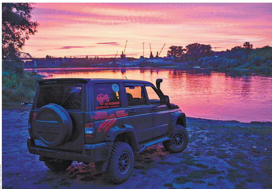
Ночевка на берегу Дона. Тихого Дона.