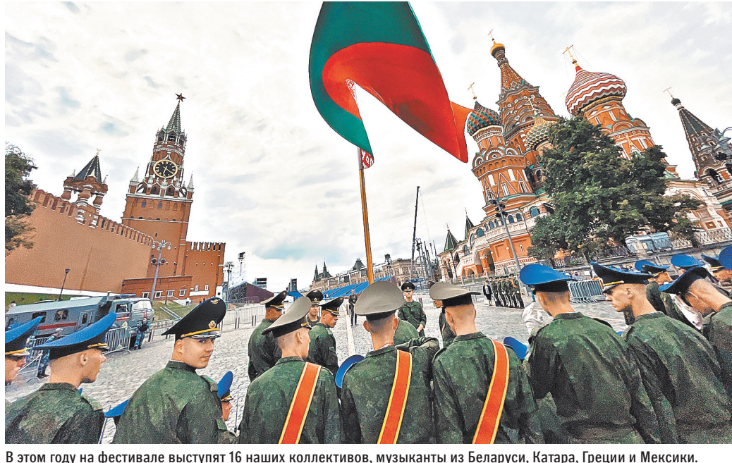
В этом году на фестивале выступят 16 наших коллективов, музыканты из Беларуси, Катар, Греции и Мексики.