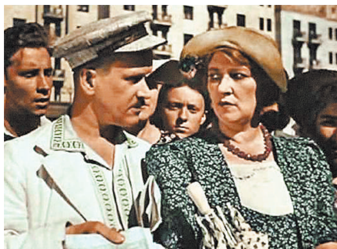
Я категорически прошу не вмешиваться в моего ребенка! («Подкидыш»).

Культурно-образовательные кластеры строятся по поручению Владимира Путина. Проекты реализуются сразу в четырех городах страны — помимо Калининграда это Кемерово, Владивосток и Севастополь. Заказчик строительства — Фонд проектов социального и культурного назначения «Национальное и культурное наследие», учредителями которого выступили Большой и Мариинский театры, Эрмитаж и Третьяковская галерея.