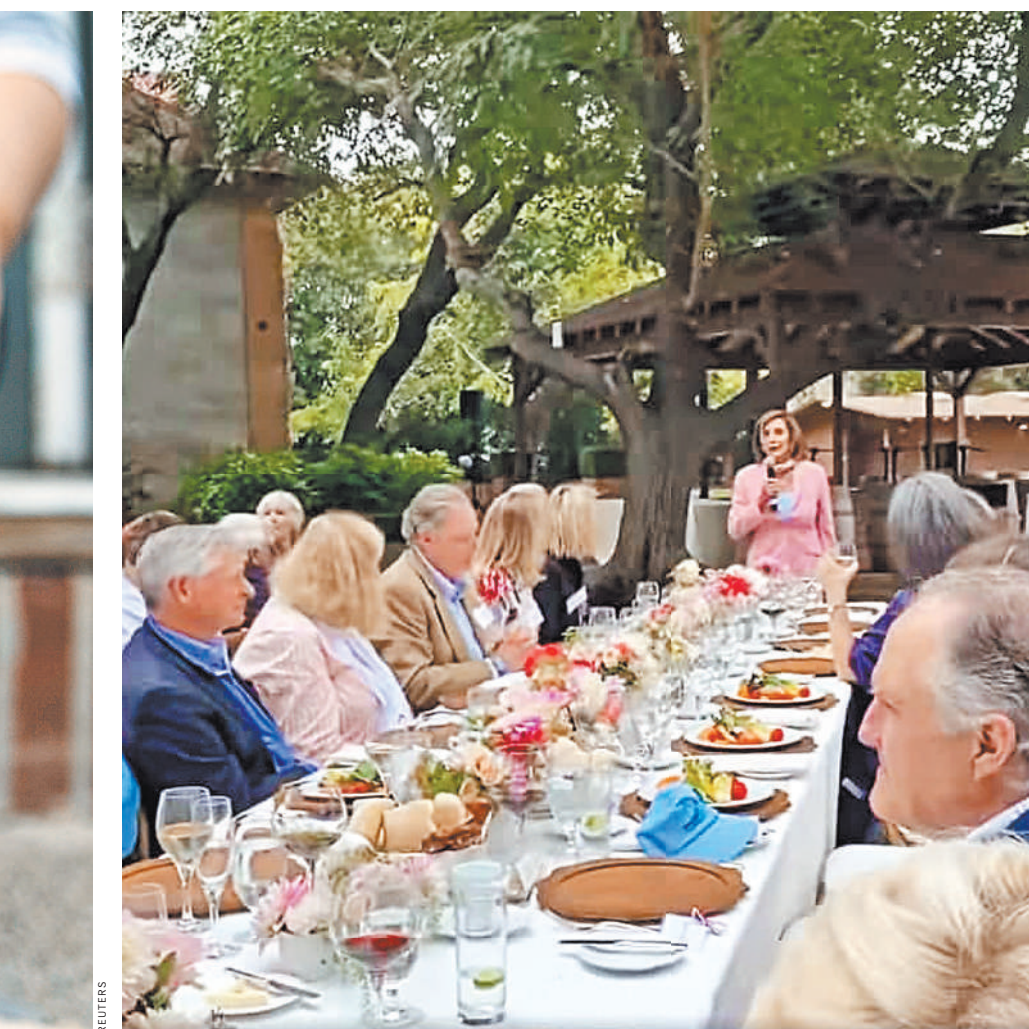
Цвет Демпартии на главе со спикером Палаты представителей Нэнси Пелоси (в розовом) наслаждается застольем в узком кругу в Калифорнии, игнорируя свои же призывы к социальности и маскам.

Руководство школьного округа под шквалом критики стало оправдываться, что браслеты отслеживают не все передвижения, а только фиксируют сближения двух носителей. Подразумевалось, что надевать их будут в основном в ходе тренировок. Авторы идеи хотели как лучше, поскольку раньше тренеры приходилось часто отменять в случае выяв-