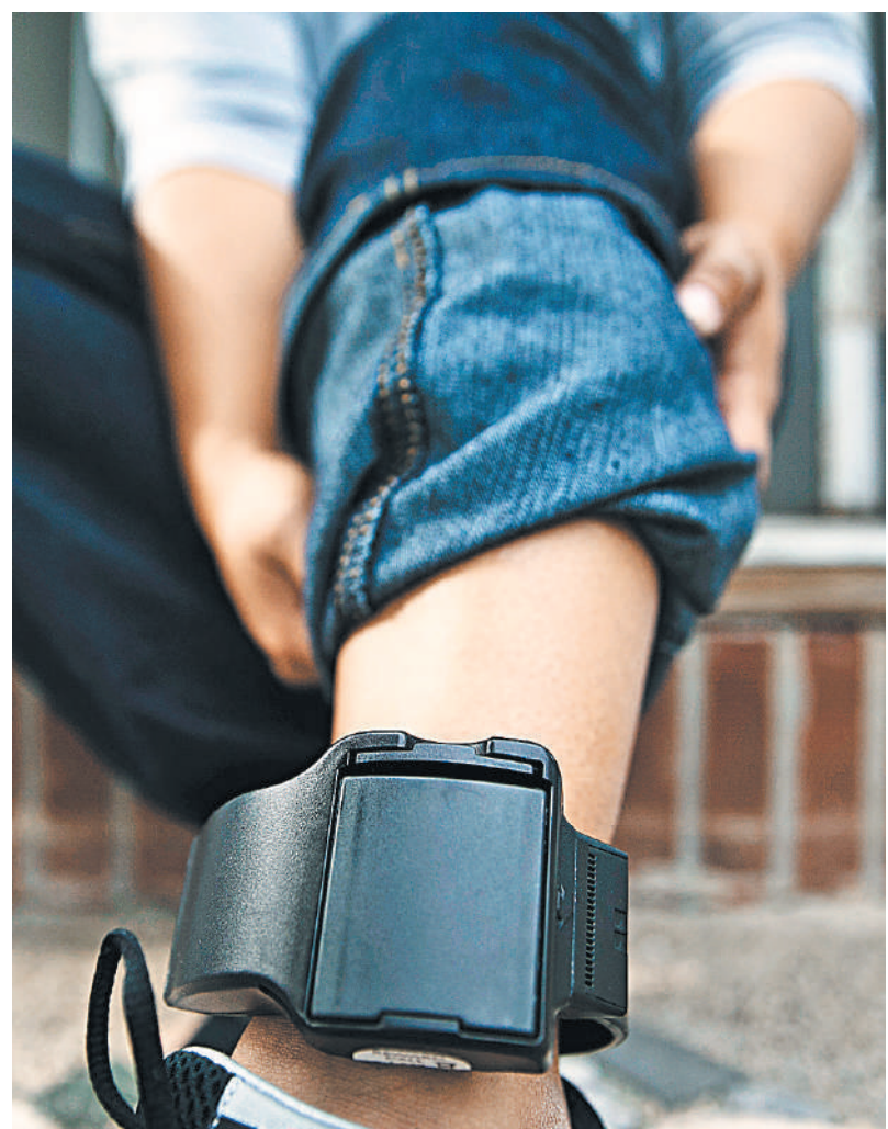
Такие браслеты для отслеживания контактов обязали носить школьников в американском Итонвилле, чтобы бороться с распространением коронавируса.