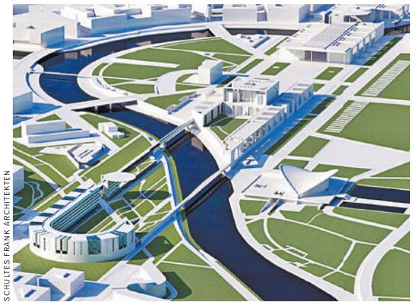
Так выглядит проект федеральной канцелярии ФРГ, по размаху обещающий затмить Елисейский дворец в Париже.

Планы по расширению территории обсуждались в Германии последние десять лет. Даже в таком просторном и современном здании сотрудникам было тесно, многим приходилось работать извне.