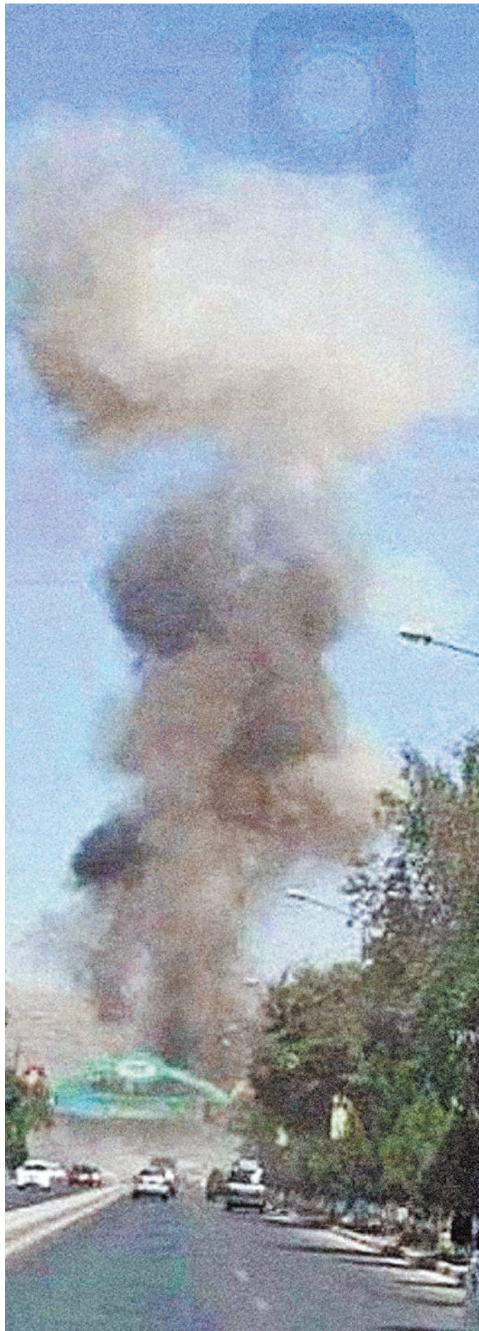
Взлетевшие в небо клубы дыма после мощных взрывов были видны далеко за пределами аэропорта в Кабуле.

До сих пор Байден и его окружение худо-бедно отбивались от шквала критики, который обрушился на них за организацию вывода войск США из Афганистана, которая спровоцировала