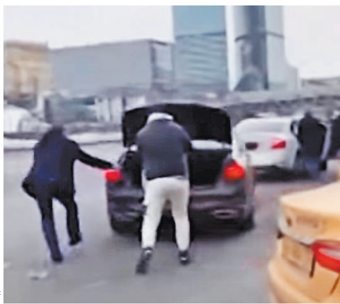
Тот самый момент, когда водитель такси премиум-класса кладет пакеты пассажирам-блогерам в багажник, а они в это время угоняют автомобиль.

И вот вчера очередной пранк — теперь уже с угонном автомобилем — дошел до суда. Как рассказали корреспонденту «РГ» в прокуратуре Москвы, в середине марта трое мужчин 24, 28 и 30 лет заказали автомобиль такси премиум-класса к ТЦ «Москва-Сити». После подачи машины «блогеры» попросили водителя сложить их пакеты в багажник. Когда потерпевший вышел из салона автомобиля, они сели в машину и скрылись в неизвестном направлении. При этом один из них находился за рулем автомобиля, второй — снимал происходящее на камеру мобильного телефона из салона автомобиля, а третий остался ожидать соучастников возле ТЦ и также снимал происходящее на камеру. Все это они потом выложили в социальной сети. Через несколько минут после угона троица вернула автомобиль, пояснив, что это был «розыгрыш». Правда, владелец такси «шутку-юмор» не оценил. За это им теперь грозит до 7 лет лишения свободы.