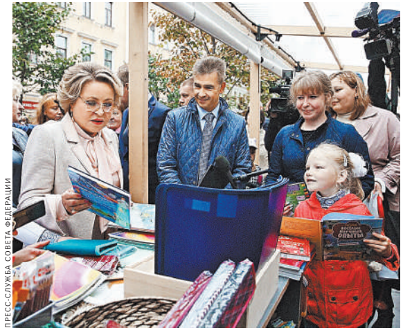
Валентина Матвиенко пообщалась с посетителями «Книжных аллея» — летний литературный городок работает на Малой Коношенной улице пятый год.

ВЫБОРЫ ЦИК направит иски в ВС по поводу зарубежных активов кандидатов в Госдуму