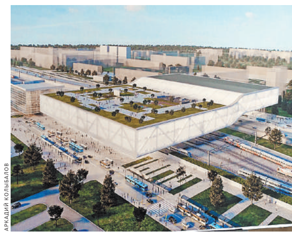
Современные ТПУ больше похожи не на вокзалы, а на современные академические городки, ведь правда?