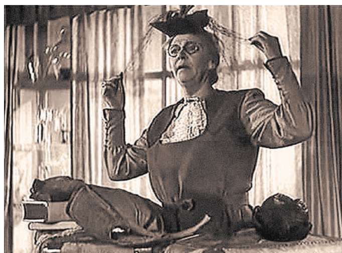
Да, красота — это страшная сила! («Бесна»).