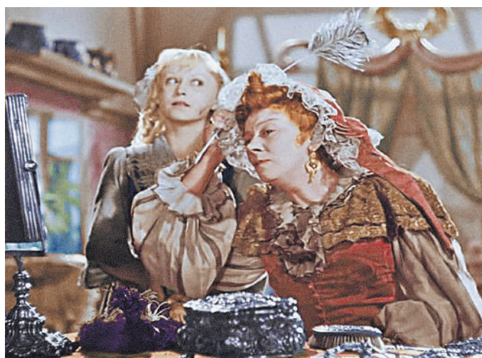
Выйди окна, натри полы, выколи грядки, познай самое себя. («Золушка»).