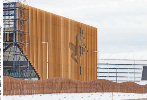
Танцующая балерина украшает фасад филиала Московской государственной академии хореографии.

Еще один серьезный проект в академии хореографии — концертный зал. Он будет вмещать 286 зрителей. Уже в начале сентября работы в нем, говорят, завершатся.