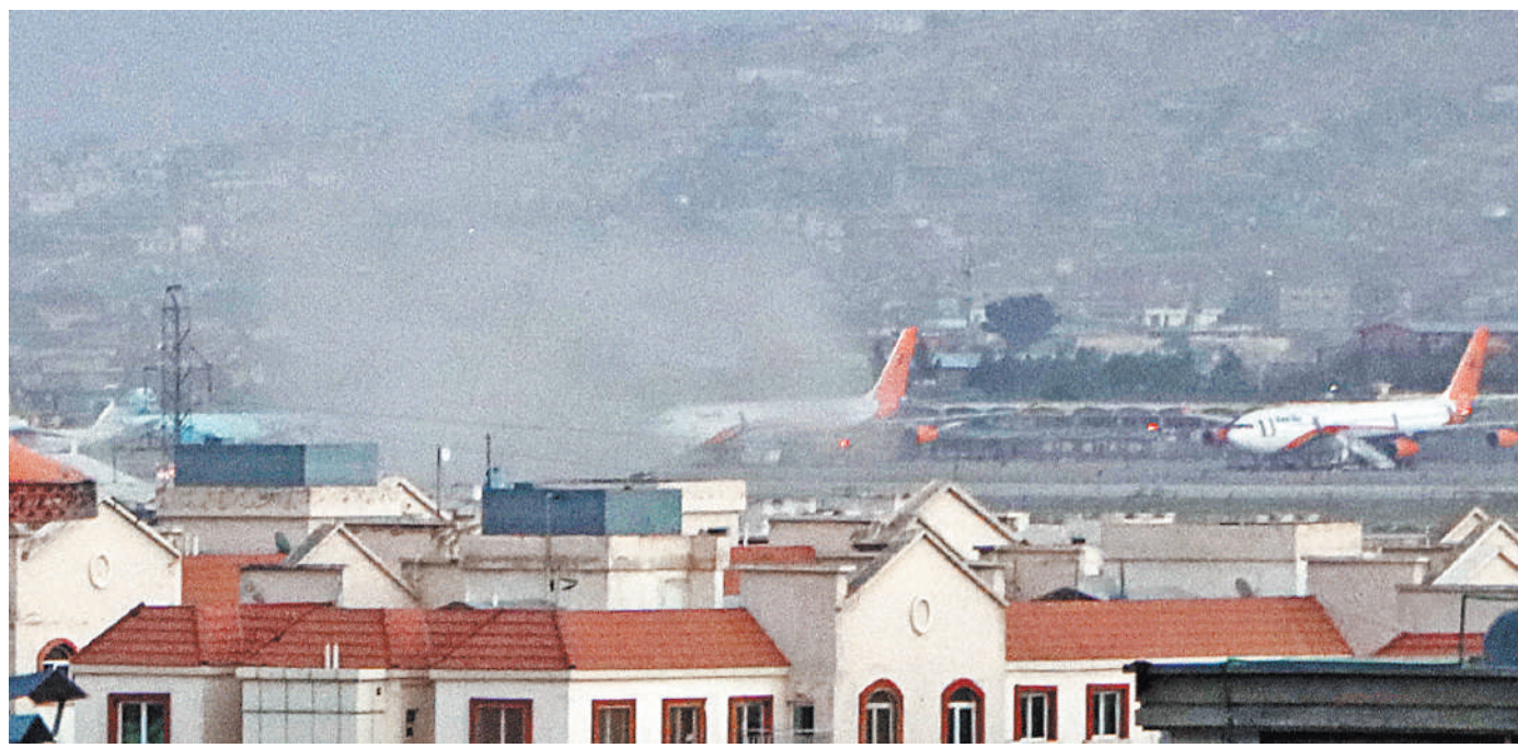
Взрывы у аэропорта Кабула могут окончательно закрыть эту воздушную гавань для афганцев, пытавшихся уехать из страны.

Между тем все россияне, которые хотели покинуть Афганистан, сделали это на самолетах Минобороны России, организовавшего вывозные рейсы.