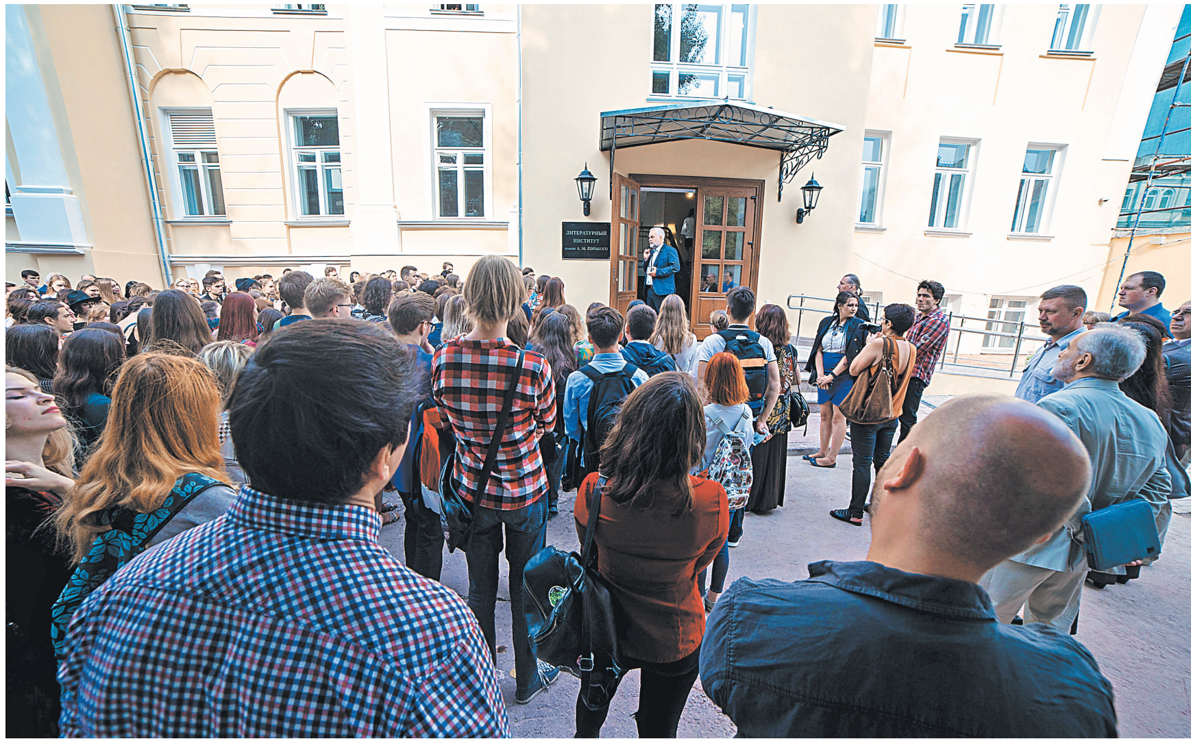
Так до пандемии выглядели собрания первокурсников перед зданием Литературного института 1 сентября.