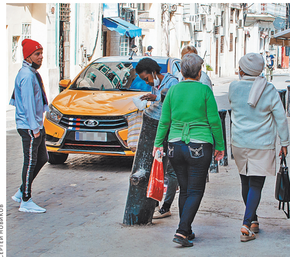
Шарфы, шапки и открытая обувь — не привычки к холодам кубинцам не знакома мудрость «держи ноги в тепле».