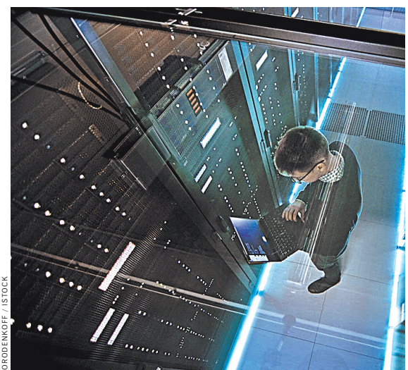
Суперкомпьютеры создают лекарства и новые материалы, предсказывают погоду, работают в криптологии и статистике.

Наряду с проектом синхротрона СКИФ суперкомпьютерный центр является крупнейшим объектом, который финансируется федеральным бюджетом. Его, как и СКИФ, курирует губернатор Новосибирской области, председатель Комиссии по науке при Госсвете Андрей Александрович Травников. Он сторонник создания центра «Лаврентьев» под эгидой вуза.