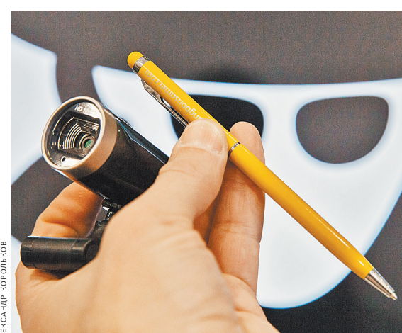
Если ручка пишет не только по бумаге, но и на скрытую камеру, ее владельцу грозит уголовная статья.

За полгода суды осудили 22 человека за использование различных «шпионских» гаджетов