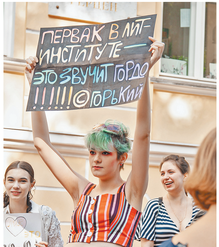
Студенты института литературно подкованы и обладают чувством юмора.