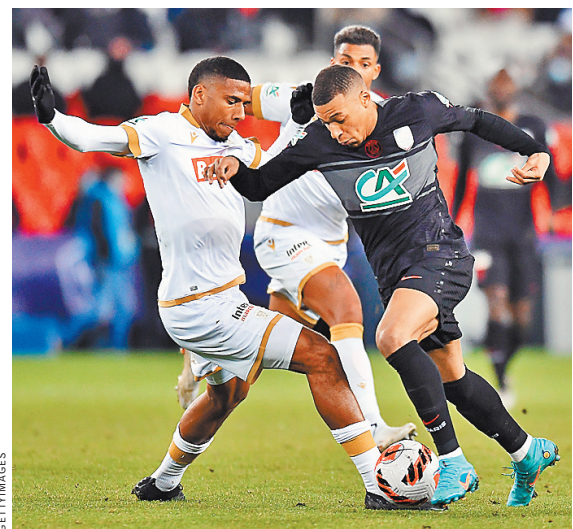
Килян Мбаппе с детства грешил выступлениями за «Реал». Совсем скоро его мечта исполнится.

Благодаря «слепому» жребию в четвертьфинальной стадии есть весьма оригинальные пары. К примеру, вышеупомянутые «Версаль» и «Бергерак» попали друг на друга. Это означает, что в полуфинале в любом случае будет представлять четвертого дивизиона. Позвело со жребием и «Монако», которому предстоит дома встретиться с «Амьеном», выступающим во второй лиге. Самая афишная пара — «Марсель» — «Ницца», плюс «Нант» сыграет с «Бастией» (второй дивизион). Матчи пройдут с 8 по 10 февраля. ●