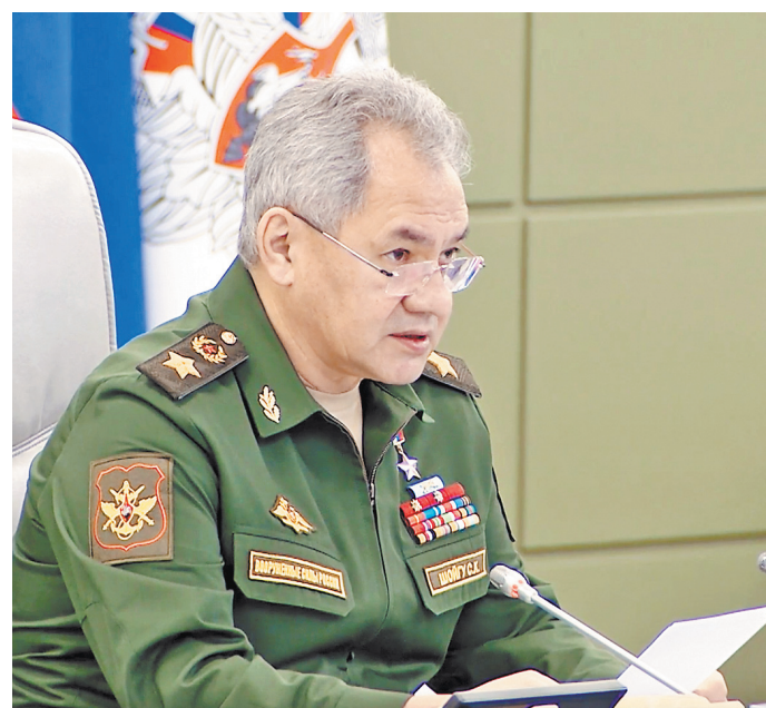
Сергей Шойгу. Задействованные в проверке сил реагирования Союзного государства войска переброшены на расстояние до 10 тысяч километров.

Министр напомнил: проводимая сейчас проверка сил реагирования Союзного государства организована по решению президентов РФ и Беларуси. «От российских Вооруженных сил задействованы органы военного управления и подразделения Восточного военного округа. В настоящее время проходит первый этап проверки. Войска переброшены на расстояние до 10 тысяч километров, в том чис-