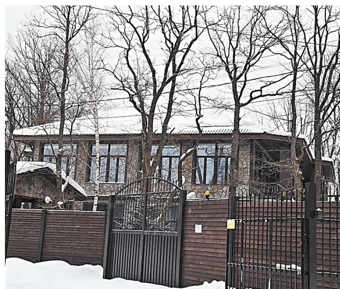
Преступники пришли в дом к вдове Александра Градского по наводке работающего там мужчины.

Всего к учениям привлекается свыше 140 боевых кораблей и судов обеспечения, более 60 летательных аппаратов. ●