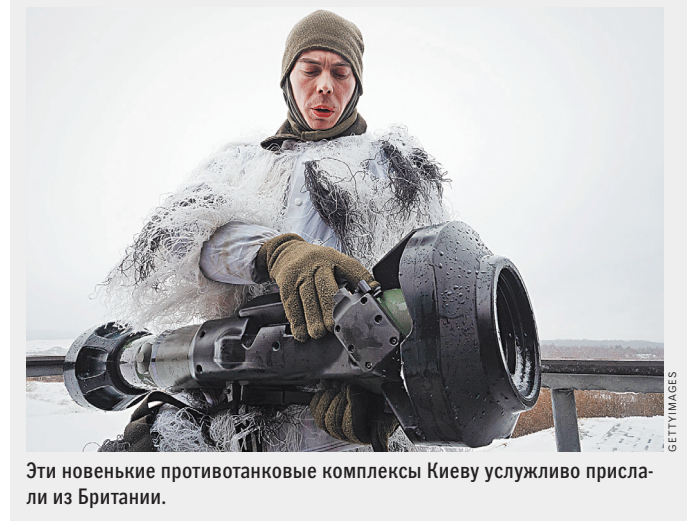
Эти новые противотанковые комплексы Киеву услужливо прислали из Британии.

«Этот указ не потому, что скоро война. Это я говорю для всех. Этот указ для того, чтобы скоро и в дальнейшем был мир, мир в Украине», — пояснил Зеленский свою инициативу.