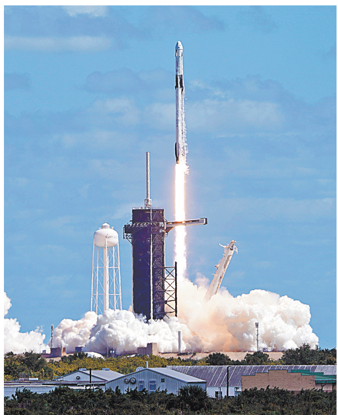
Космодром на мысе Канаверал. Старт ракеты-носителя Falcon 9 с кораблем Crew Dragon.