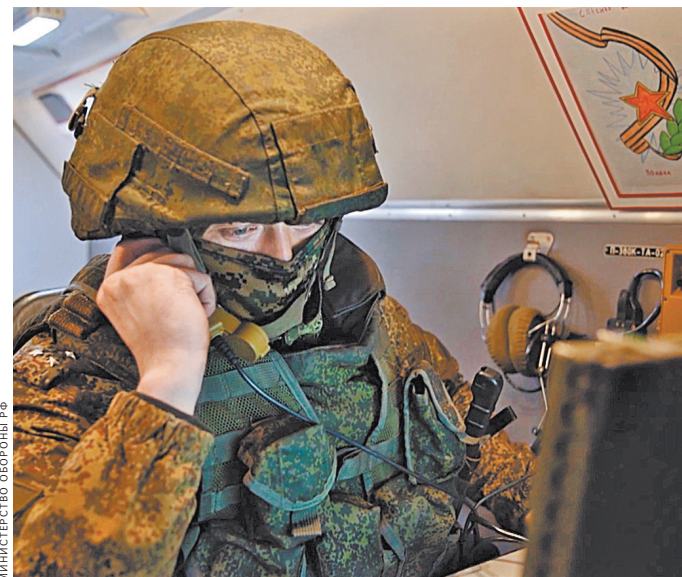
Министерство обороны РФ

ВКС России нанесли массированные удары по подразделениям 35-й бригады морской пехоты ВСУ в районе Давыдова Брода и позициям 128-й горноштурмовой бригады противника у населенного пункта Дудчане Херсонской области. Там уничтожено более 120 человек, два танка и восемь бронемашин.