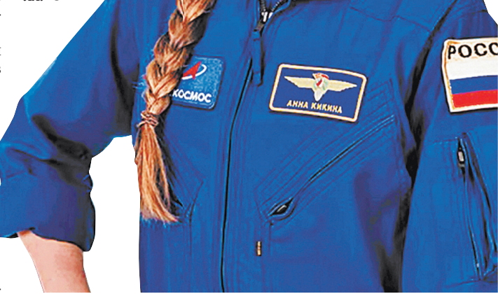
Космонавт, спортсменка и просто красавица. Это все о ней — Анна Кикина.

ном российско-американском эксперименте SIRIUS — по моделированию полета на Луну. В одном из «драконовских» испытаний не спала почти сорок часов. А еще выращивала овощи «на борту», погружалась в виртуальную реальность, тренировалась управлять луноходом, роботом-манипулятором... И даже испытывала мобильный моделирующий стенд нового российского пилотируемого корабля. ●