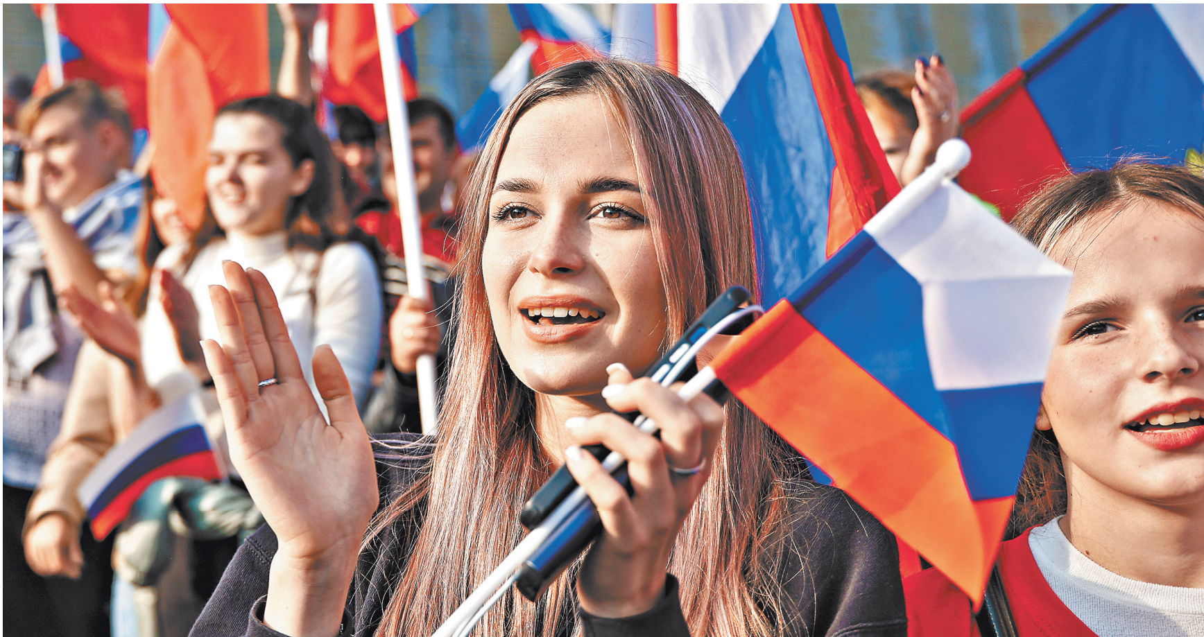
«За выбором миллионов жителей в Донецкой и Луганской народных республиках, в Запорожской и Херсонской областях — наша общая судьба и тысячелетняя история», — заявил Владимир Путин на церемонии подписания договоров.

Сегодня «Российская газета» публикует эти документы и дает ответы на главные вопросы, связанные с процессом интеграции.