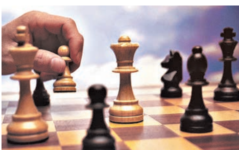
Под редакцией международного мастера Максима ОРЛИНКОВА

является выступление Фабиано Каруаны. Три поражения в первых семи партиях, привели к тому, что начал турнир первым по рейтингу, он не только опустился на 5 место, но и покинул ряды восьмисотников. Лишь в восьмом туре Фабиано удалось обыграть Хоу Ифань (пройдя через крайне тяжелую позицию) и догнать другого претендителя Китая Вей И. на весьма грустном для обоих рубеже минус 2. Теперь у российских шахматистов. Петр Свидлер и Максим Матлаков пока идут с 50% результатом. После поражений соответственно от Владимира Крамника и Вишнаватана Ананда, нашим гроссмейстерам вовремя «подвернулась» многострадальная Хоу Ифань, с помощью которой они и улучшили свое положение. Владимир Крамник демонстрирует очень глубокую содержательную игру, и по позициям должен был иметь больше, чем текущие +2. Особенно впечатляет его трактовка черными модного варианта итальянской партии, и как итог отличная победа