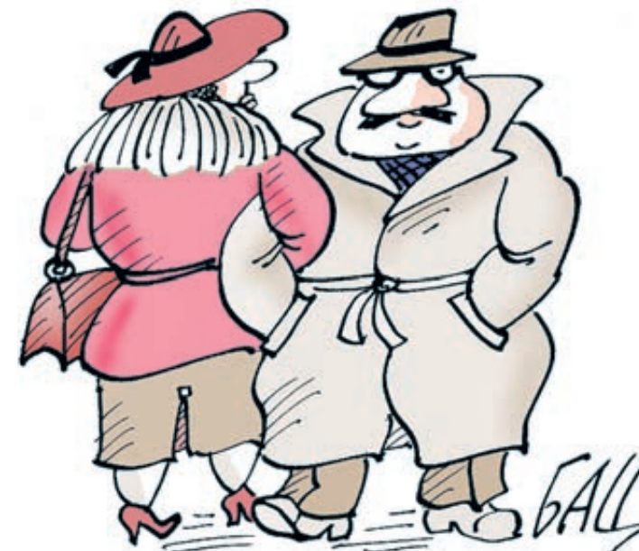
ИЛЛЮСТРАЦИЯ БОРИСА ЦЫГАНОВА, CARTOONBANK.RU

Да, штампы в паспорте стремительно теряют популярность, и это уже ни для кого не секрет. За окном наблюдается брачная засуха: в 2016 году в России, например, был зафиксирован абсолютный минимум официальных регистраций брака в новейшей истории нашей страны. Но это вовсе не означает, что наши граждане в массовом порядке дают обет безбрачия и перестают встречаться, влюбляться, съезжаться и да-