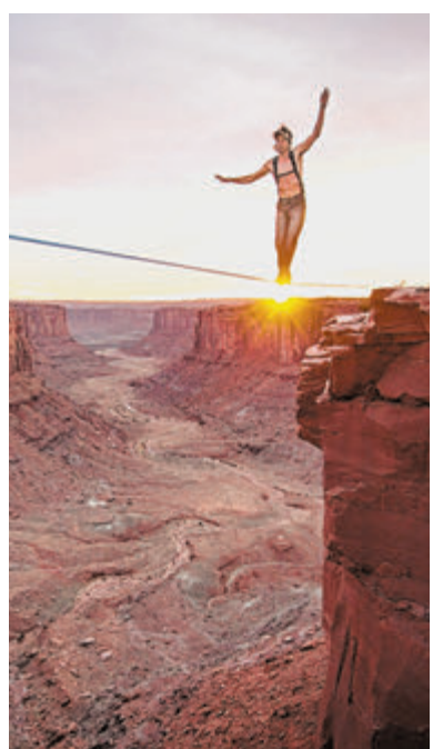
По канату на километровой высоте Дин ходил босиком без страховки и балансира.

Зачитчиков госбюджета, тем более американского, спешу успокоить: Поттер «развлекался» исключительно за счет частных капиталовложений. Спонсоры к профессионалам такого уровня (в мире их единицы) выстраиваются в очередь. Скажу больше. Деятельность профи столь высокого класса ускоряет технический прогресс. Здесь необходимо отметить: Дин был не просто безбашенным экстремалом, а весьма квалифицированным инженером. Он вносил принципиальные усовершенствования в конструкции вингсьюта и парашюта. Именно ему принадлежит разработка самого легкого в мире парашюта – весом всего 3 кг.