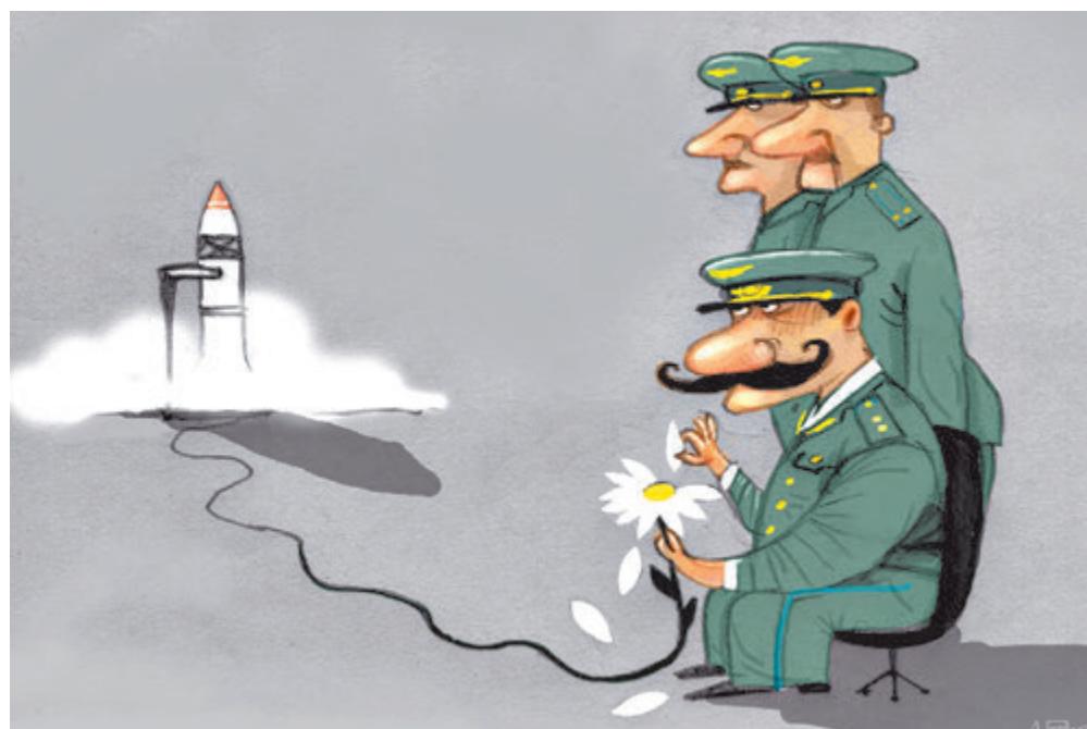
ИЛЛЮСТРАЦИЯ АНДРЕЯ ПОПОВА/САЙТОВЕБИ.РУ

Поясним: Rogozin говорил о Центре имени Хруничева. Причем не о нынешнем генеральном директоре, а о прежних начальниках разного уровня. Они, как выяснилось, сильно проштрафались. Заведено аж восемь (!) уголовных дел, вскрыты факты мошенничества, присвоения и растраты имущества на миллиарды рублей, злоупотребления полномочиями, подделки документов.