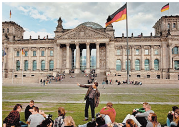
В Берлине все меньше российских туристов.

Получается, санкции против России больно ударили и по немецкой экономике, прежде всего по туристической отрасли. Не буду сгущать краски, туристическая Германия выживет и без наших денег. Но докризисные времена в немецких туристических офисах вспоминают с ностальгией. И надеются, что они еще вернутся. □