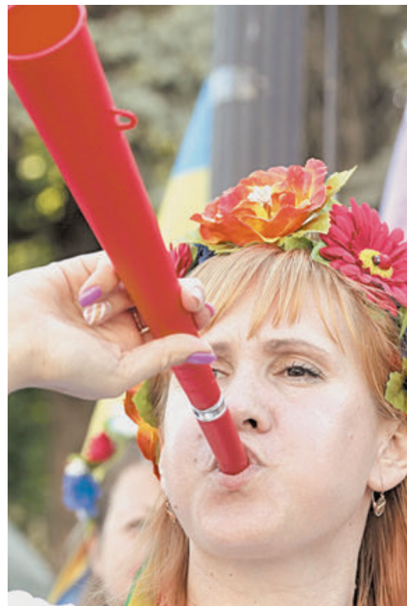
У Верховной рады теперь дудят участники «финансового майдана».

Но желудок добра не помнит. Теперь Украина не скрывает намерения отказаться от возврата долга и даже называет это справедливым. А правительство России мнется, не предпринимает никаких ответных шагов. Хотя у нас даже есть право предъявить этот кредит к досрочному погашению.