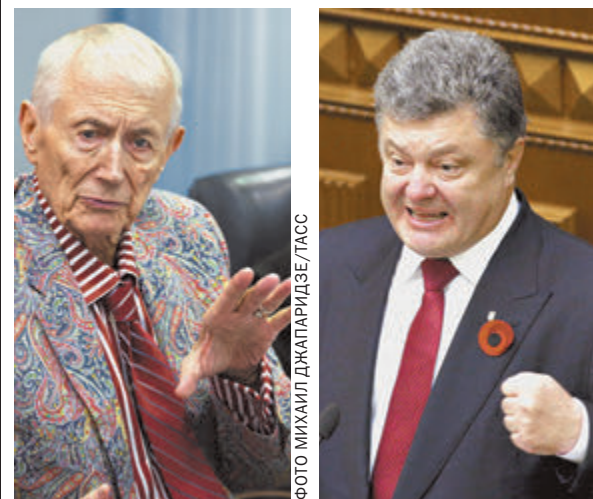
Евгений Евтушенко на сцене и Петр Порошенко на трибуне. Кто убедительнее?

Поэт и на сцену вышел будто раненый боец – поддерживаемый помощниками, очень исхудавший: болезни, оставшийся в прежней эпохе. Все это требует мужества и веры – в себя, в собственные силы и в своего верного зрителя. И