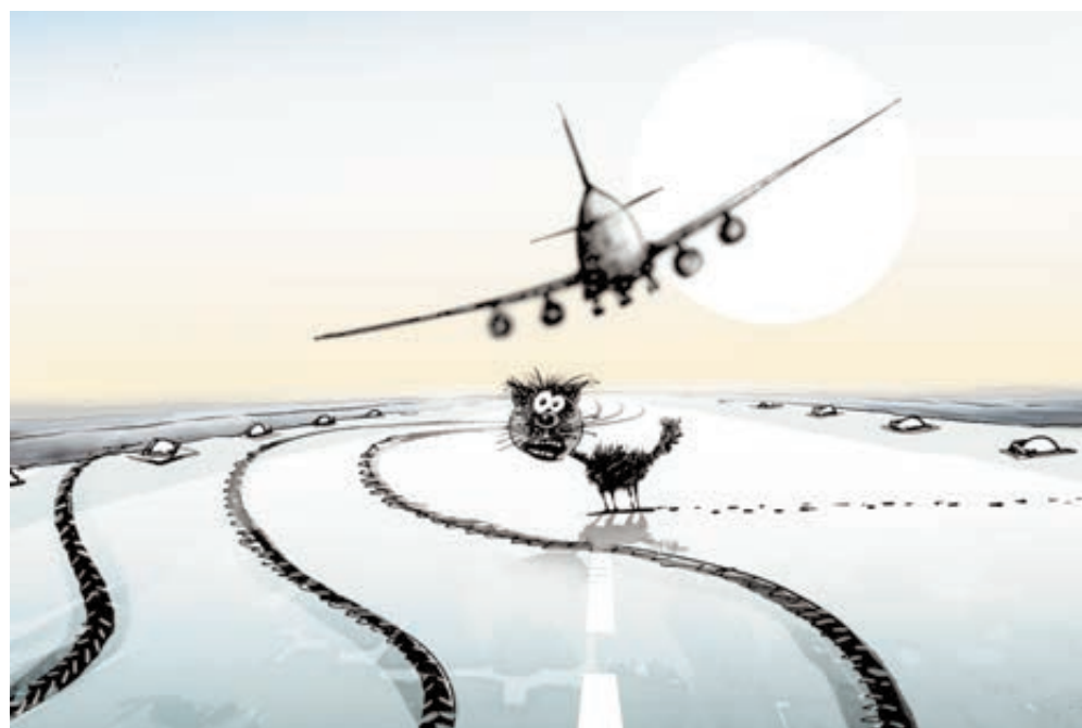
ИЛЛЮСТРАЦИЯ ВИКТОР ПОВДИНИКОВ/САТООЛБАНК.RU

Напомним, что 17 ноября 2013 года в казанском аэропорту разбился Boeing-737 авиакомпании «Татарстан». Погибли 50 пассажиров и членов экипажа. Данные бортовых самописцев шокировали специалистов. При уходе на второй круг один