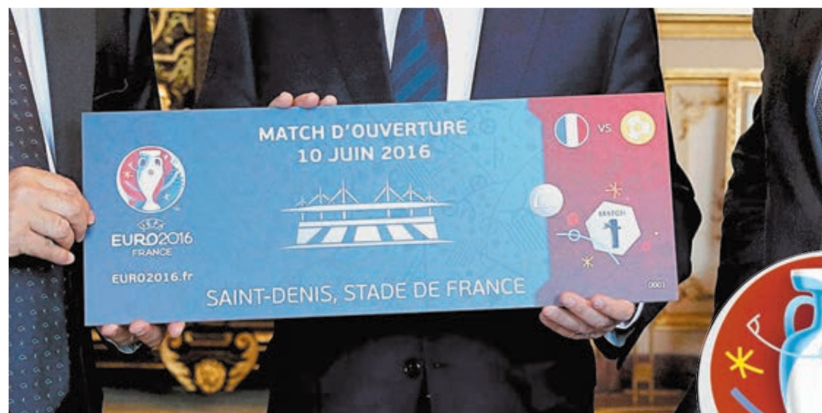
Билет на матч открытия чемпиона Европы по футболу 2016 года.

Есть два варианта: билеты на отдельные матчи и пакет «Следуй за командой» («Follow My Team»). Последний даст возможность наблюдать за всеми матчами сбор-