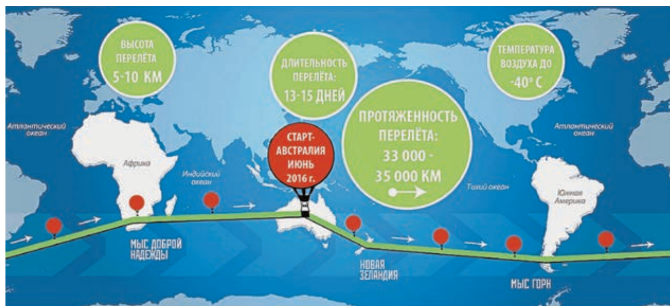
План кругосветного перелета на воздушном шаре.

— На комбинированном с объемом 15 тысяч кубометров я полечу вокруг света. Его делают в Англии. Но вовсе не потому, что российские технологии меня не устраивают.