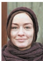
МАРГАРИТА РЯБЕЦКАЯ АРТИСТКА БАЛЕТА

Поисковая система «Яндекс» оценила запросы москвичей на тему новогодних подарков. Чаще всего ищут чайные наборы, книги и подарочные сертификаты. Но встречаются и такие запросы, как «подарочный топор». А что еще мечтают москвичи найти у себя под елкой?