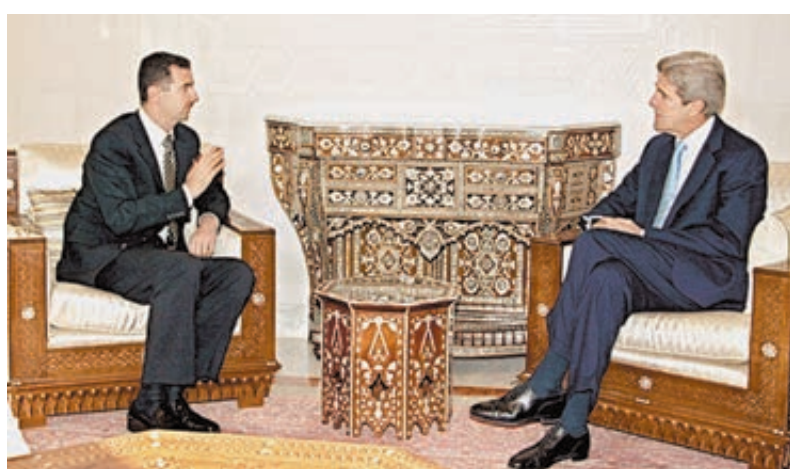
Асад и Керри когда-то находили общий язык. 2005 год.

Washington Post утверждает, что Керри уговаривал Лаврова и Путина оказать давление на Асада. Пусть-де сирийский президент направит своего представителя на переговоры с повстанцами в январе. Возможно, это и было сверхзадачей визита. Но главное, обе стороны публично подтвердили готовность к координации военных действий против ИГИЛ и обозначили все сирийские мирные переговоры как ключевой элемент урегулирования.