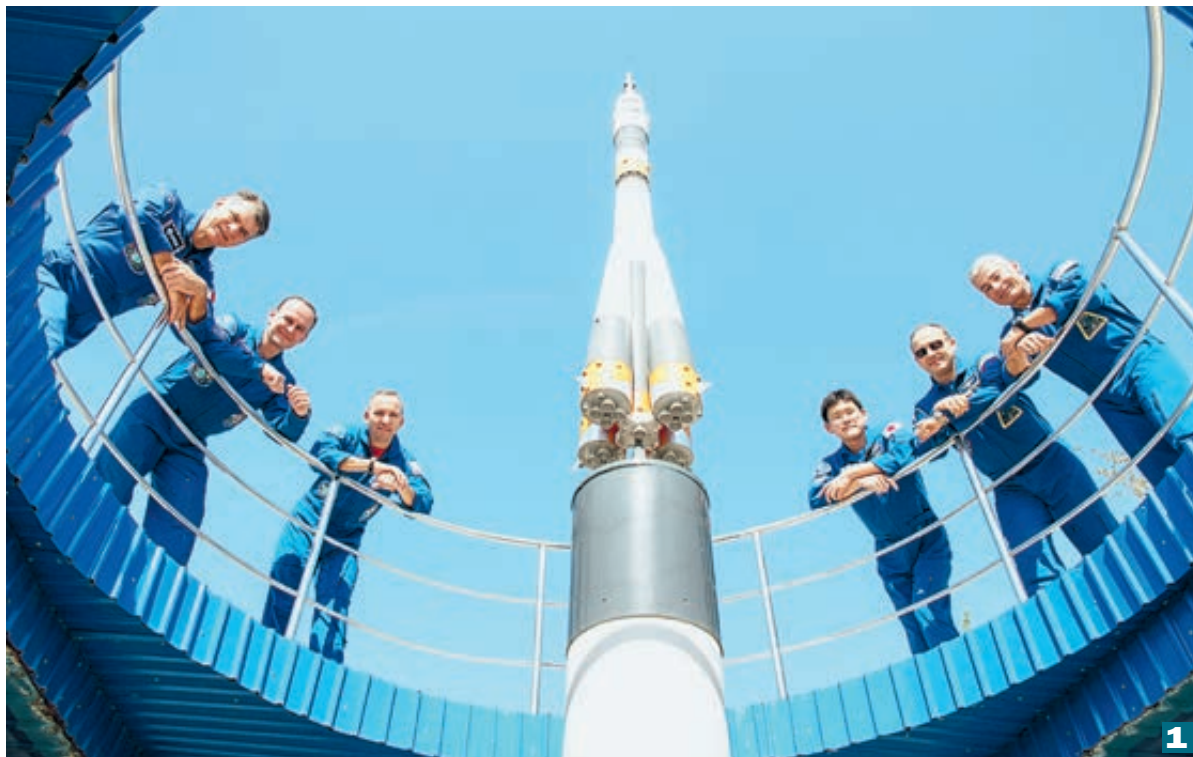
Дублирующий экипаж (слева направо): Норишиге Канаи, Александр Мисуркин, Марк Ванде Хай присоединится к основному составу (трое слева) в конце сентября.

Поэтому состав экипажа поменяли полностью. Тихонов в бли-