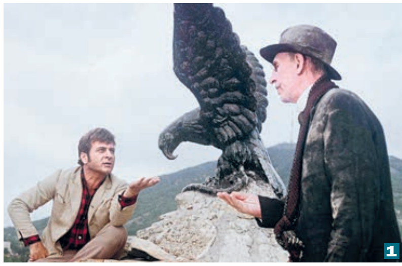
Кадр из фильма «Двенадцать стульев».

Помните монолог незабвенного Остапа Бендера в сцене знакомства с Кисей Воробьяниновым? «Вы не из Парижа. Конечно, вы приехали из Кологрива навещать свою покойную бабушку». Не надо иронизировать, Остап Ибрагимович! Репортеры «Труда» в очередную экспедицию отправились не в Париж, а в Кологрив, причем по своей воле. И увидели в этом тихом городке на севере Костромской области массу интересного.