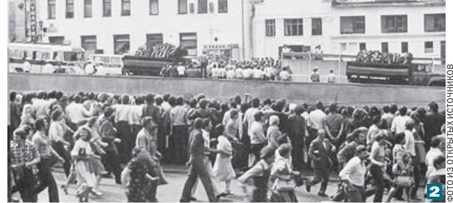
2 Прощание с Высоцким. 28 июля 1980 года.