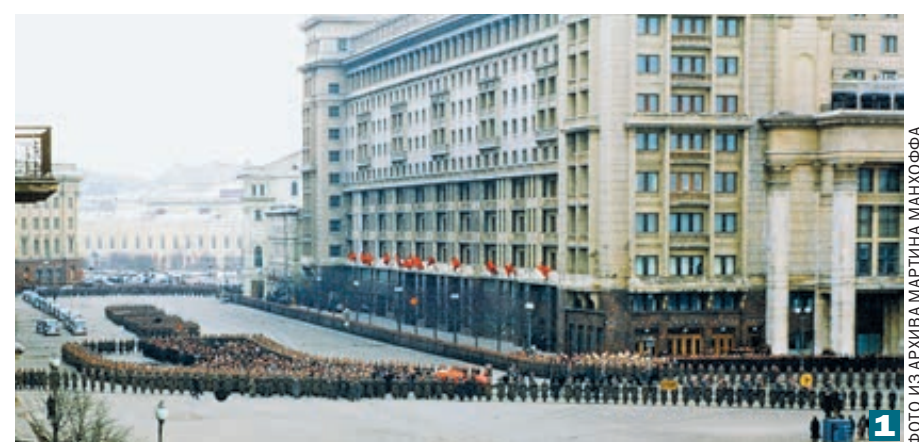
1 Похороны Сталина. 9 марта 1953 года.

А почему бы не пригласить тот же Филармонический к нам? На Мальте есть своя композиторская школа. Может, и эта идея найдет отклик в Европейском фонде поддержки культуры? ■