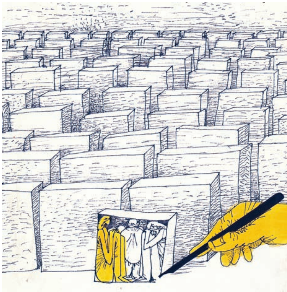
ИЛЛЮСТРАЦИЯ ДЕРЯЖЕВ ОЛЕГ/ARTSTOCKBANK.RU

«Нужно не упустить этот шанс, над этим надо устойчиво работать», – предупреждает президент. – Это одно из фундаментальных условий нормальной жизни человека и российской семьи».