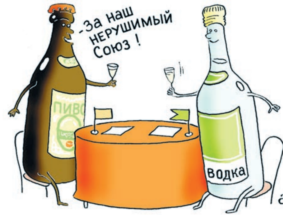
ИЛЛЮСТРАЦИЯ ВАСИЛИЯ АЛЕКСАНДРОВА / SAFTOOBANK.RU

То есть, говоря без обиняков, требуется фактически единое экономическое пространство. Как это произошло с Крымом.