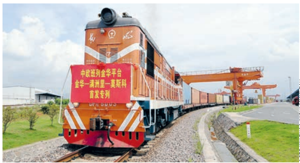
Товарный состав начал свой путь до Москвы из города Цзиньхуа провинции Чжэцзян.