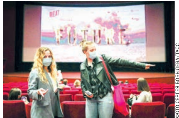
В Москве в среднем приходят сегодня четыре зрителя на сеанс.

Скромные кассовые сборы первого уик-энда — результат не только опасливости зрителей, которые боятся заразиться во время похода в кино, хотя на самом деле шанс подхватить вирус в кинотеатре неизмеримо меньше, чем, скажем, в магазине или метро. Дело еще и в хиллом кинорепертуаре. Фильмов-событий, способных заманить толпы в зал, в афише нет. В ней преобладают либо старые картины, чьи премьеры состоялись еще до пандемии, либо откровенные аутсайдеры проката, такие, например, как не самая удачная «Фея» Анны Меликян, которая уже была показана на онлайн-платформах и не снискала там успеха.