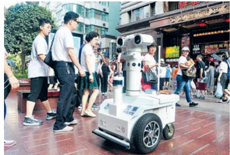
На пешеходной улице Нанцзинлу в Шанхае появился патрульный полицейский робот по имени Вали. Он обладает функцией распознавания лиц.

Китай уверен, что обладает всем необходимым для экономического восстановления, для всестороннего строительства среднестатистического общества и окончательной победы над бедностью.