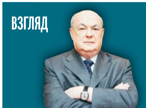
ВЛАДИМИР РЕСИН ДЕПУТАТ ГОСУДАРСТВЕННОЙ ДУМЫ, ПРЕДСЕДАТЕЛЬ ЭКСПЕРТНОГО СОВЕТА ПО СТРОИТЕЛЬСТВУ

В настоящее время эпидемия все еще распространяется по миру и оказывает влияние на мировую экономику. Экономическое развитие Китая по-прежнему сталкивается со множеством вызовов и проблем, но мы абсолютно уверены в будущем экономики Китая. Китай готов работать со всеми для координации макроэкономической политики, укреплять сотрудничество в профилактике и контроле эпидемии, восстановлении производства и других областях, сплоченно создавать мировую экономическую открытого типа, а также прилагать неустанные усилия для стабильного восстановления и скорейшего вывода мировой экономики из рецессии.