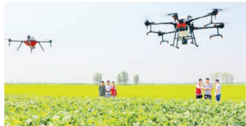
Обучение фермеров навыкам эксплуатации сельскохозяйственных дронов. Эти устройства ведут мониторинг, вводят удобрения, борются с вредителями.