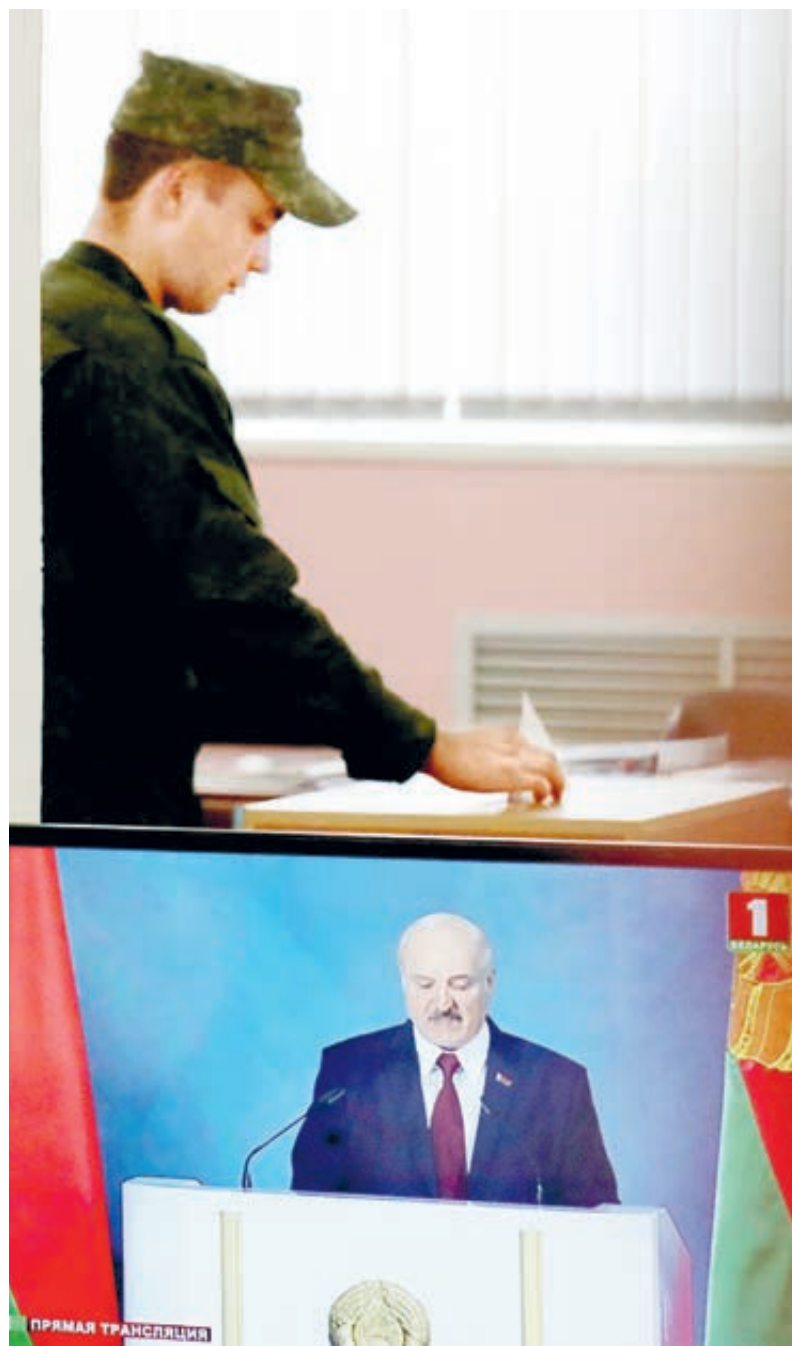
В Белоруссии уже идет голосование. О результатах узнаем в воскресенье?

Но официальная статистика свидетельствует: производительность труда в Белоруссии более чем в 6 раз ниже, чем в странах ЕС, и почти вдвое ниже показателя государств Центральной и Восточной Европы. Доля высокотехнологичной продукции в экспорте не превышает 3%. Почему так? Плохо работают или плохо управляют? Но где гарантия, что после вхождения республики в РФ у белорусов все будет иначе? Ведь с производительностью труда у России тоже неважно: от Европы отстаем в 3–4 раза, от США – в 4–5 раз. И доля высокотехнологичного экспорта у России мизерна: в 2016-м зафиксировано 2,35%, с тех пор почти не прибавилось. А если сравнить с мировым уровнем, получим «слезы»: нынешние российские поставки – лишь 0,3% от мирового объема высокотехнологичного экспор-