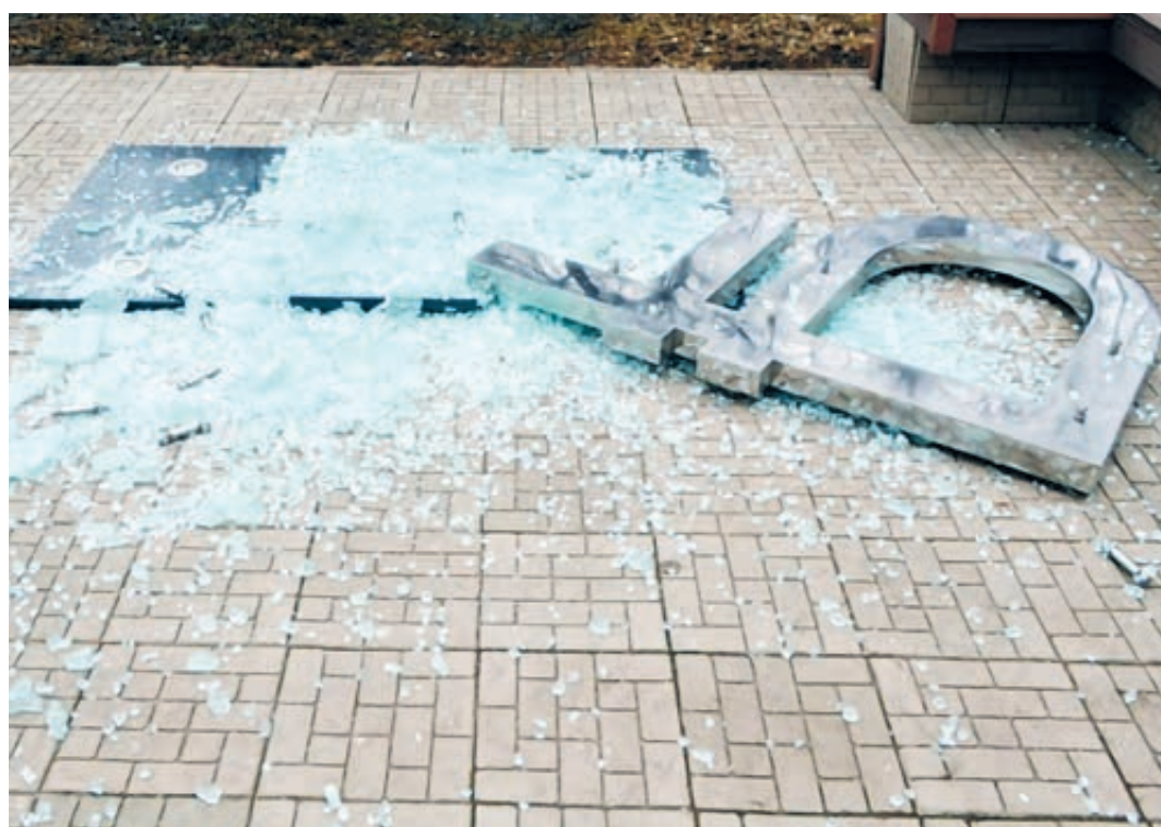
Что останется от рубля к осени? На этот счет хватает апокалиптических прогнозов.