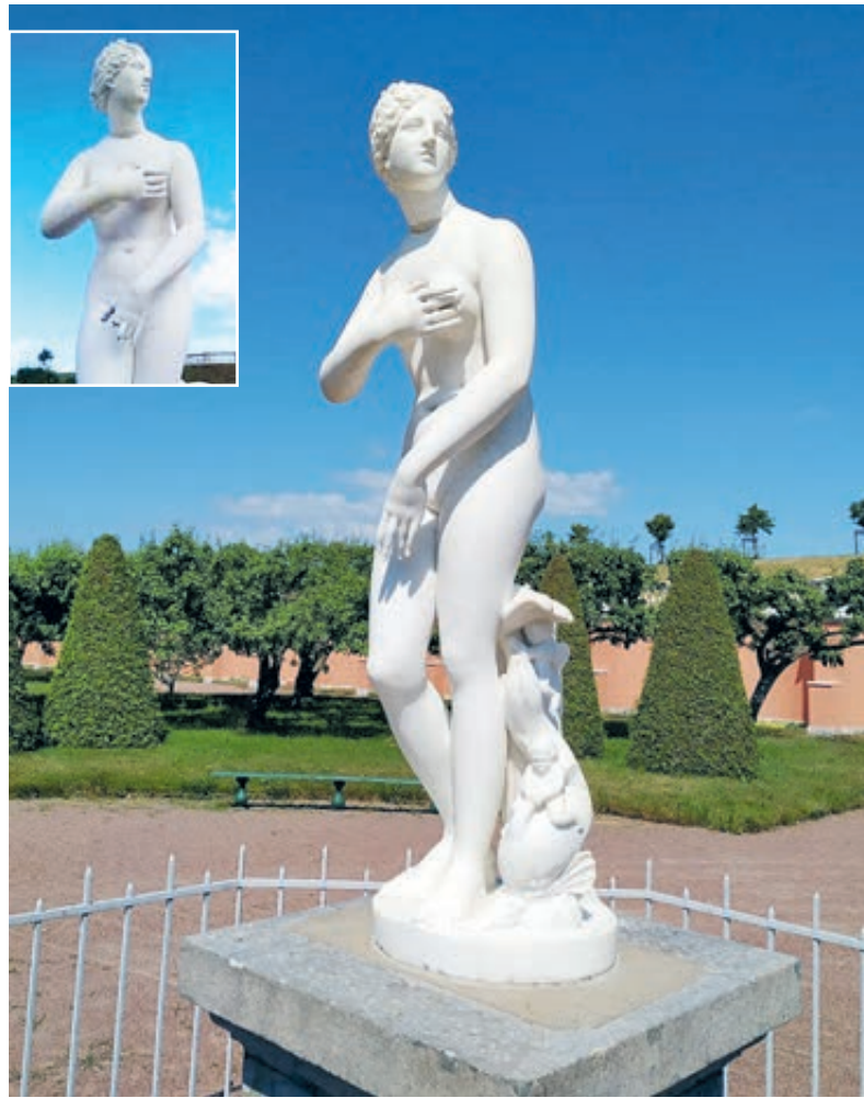
Мраморной Венере Медицейской сломали четыре пальца.

«Надеюсь, семья получила извинения за то, что почти сутки несовершеннолетний был оскорблен в публичном пространстве словом «вандал»?.. Вы должны обеспечивать детям безопасную среду. На уровне их роста писать, что можно трогать, а что нельзя. И снабдить соответствующей картинкой.