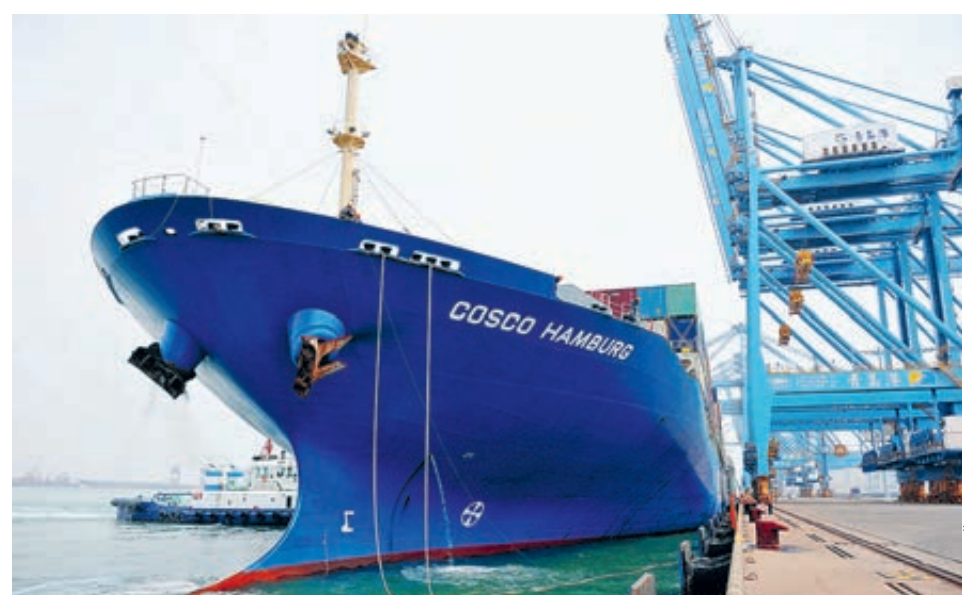
Контейнеровоз COSCO Hamburg пришвартовался к автоматизированному причалу в городе Циндао провинции Шаньдун.