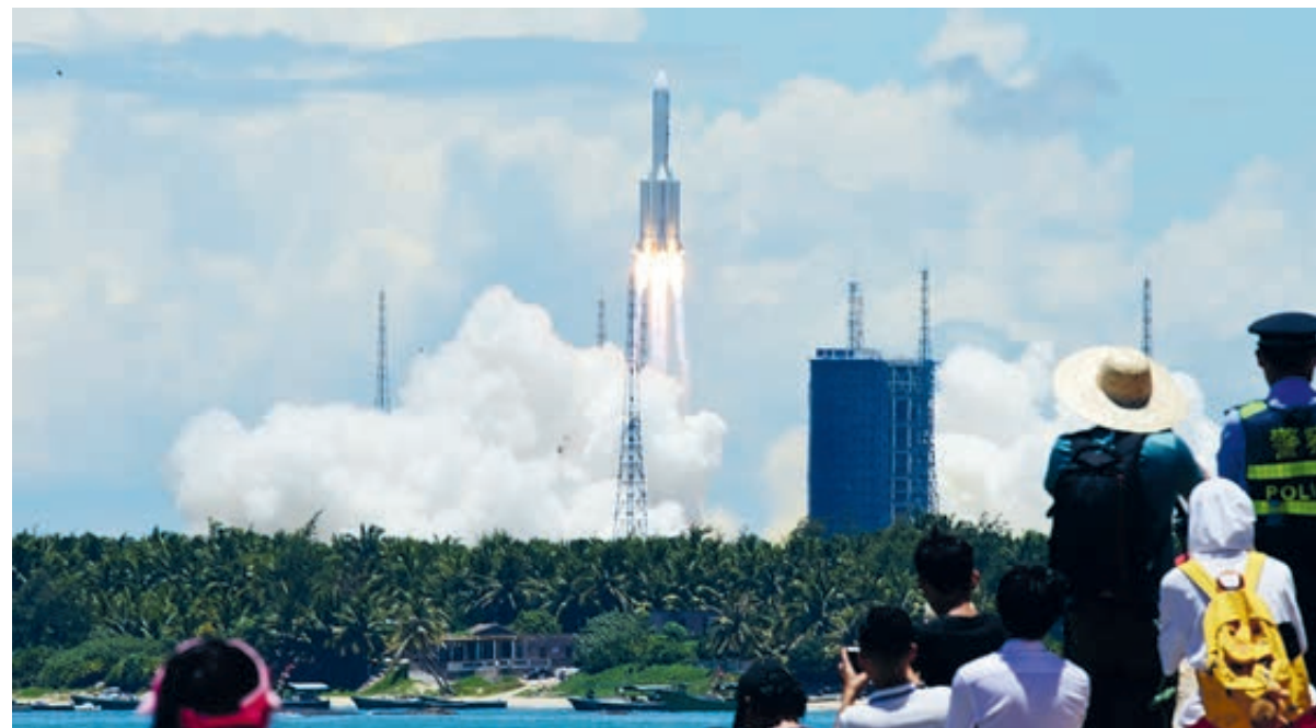
23 июля 2020 года Китай с помощью ракеты-носителя «Чанчжэн-5» запустил свой первый зонд для изучения Марса «Тяньвэнь-1». Старт был осуществлен с космодрома «Вэньчан» в провинции Хайнань.

Во втором квартале 2020 года ВВП КНР вырос на 3,2%