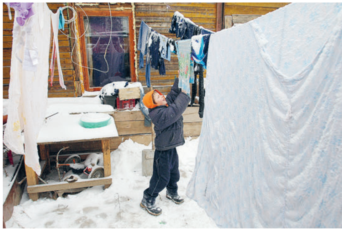
Маленькие детки – большие хлопоты.

Вывод простой: не хочешь впасть в нищету – откажись от детей. Или как минимум от второго ребенка. По данным эксперта-демографа Алексея Рахши, в 2019 году в стране родились 1,485 млн детей – на 7,5% меньше, чем годом раньше (в связи с сокращением численности женщин детородного возраста). Еще более глубоким было падение рождаемости вторых детей – 8,5%. А ведь