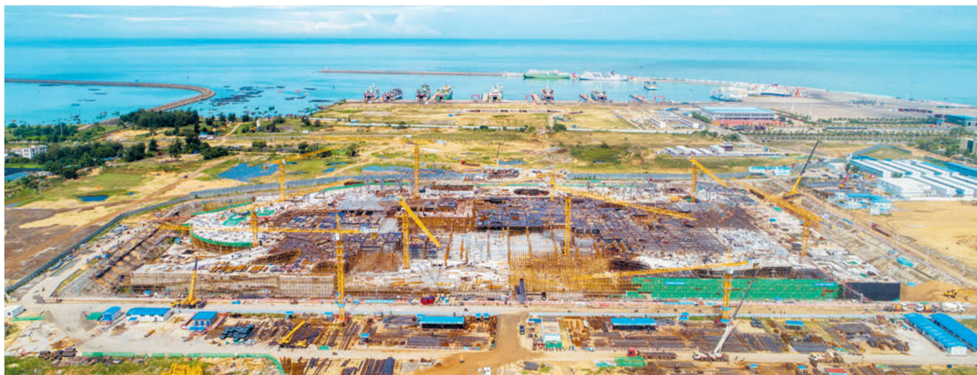
В городе Хайкоу ускоряется строительство международного беспопыльного порта.

Экономика многих стран, столкнувшись с ударом эпидемии, приходит в серьезный упадок, и эти страны надеются выйти из затруднительного положения с помощью расширения внешнего сотрудничества, включая активное участие в проекте «Один пояс, один путь». В настоящее время совместное строительство проекта «Один пояс, один путь» продолжается при строгом соблюдении мер профилактики эпидемии. Началась реализация целого ряда новых проектов, которые прибавили уверенности в борьбе с эпидемией и восстановлении экономики в соответствующих странах. С 2013 по 2019 год товарооборот между Китаем и его партнерами по про-