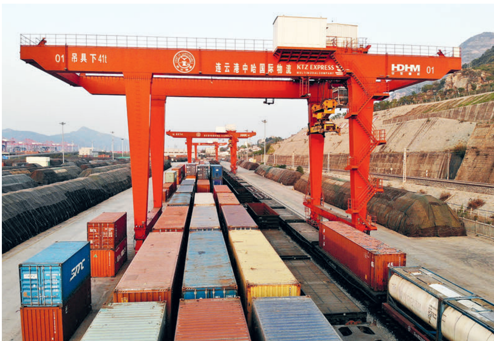
Режим «нулевого ожидания» в порту зоны свободной торговли Ляньюньган способствует комплексной эксплуатации грузовых поездов по маршруту Китай – Европа.