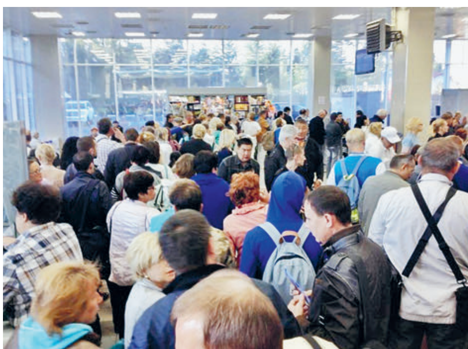
Аэропорт в Симферополе: вот и попробуйте тут соблюсти социальную дистанцию.

Остальные авиакомпании тоже предлагали обратные билеты в среднем в 3–4 раза дороже их обычной стоимости. Например, за экономичный перелет из Сочи в Москву 10 января «Уральские авиалинии» и Nordwind просили около 12 тысяч рублей, «Россия» – 19 тысяч. Тогда как средний уровень цен по этому