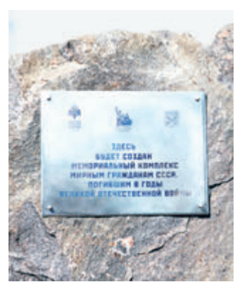
Так будет выглядеть мемориал под Гатчиной.

Мы работали в лесу и на полях с надзирателем-литовцем. Немец, которого звали Бруно, ходил с палкой и жестоко наказывал за неповиновение».