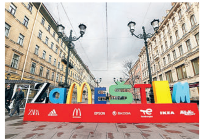
Апрель 2022 года. Инсталляция в Санкт-Петербурге.

Другая проблема: научные результаты слабо востребованы бизнесом. Даже если высокие технологии у нас появляются, их некому внедрять. В России НИОКР на 70% финансируются государством, а в Китае те же 70% дает бизнес, кровно заинтересованный в новых разработках. У нас же десятилетия гайдаровский принцип «продадим сырье