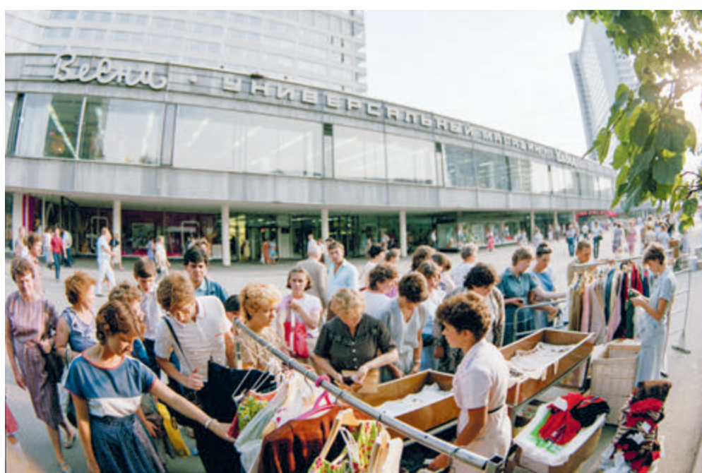
1987 год. Уличная торговля на проспекте Калинина.

В указе «О мерах по обеспечению социально-экономической стабильности и защиты населения в РФ», подписанном в прошлом месяце президентом страны, дано указание увеличить минимальный размер оплаты труда, прожиточный минимум, зарплаты бюджетников и пенсии. Тем временем SuperJob провел опрос жителей разных городов России, чтобы узнать, какой, по их мнению, должна быть «минималка». И получилось: в Москве – 43 200 рублей, по Владивостоке – 40 700, в Санкт-Петербурге – 39 400, в Волгограде – 33 400, в Пензе – 32 900 рублей... Сегодняшний