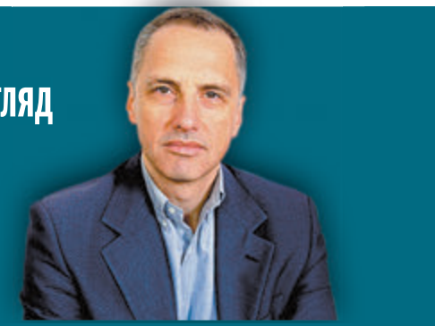
ОЛЕГ ШЕВЦОВ ПОЛИТИЧЕСКИЙ ОБОЗРЕВАТЕЛЬ