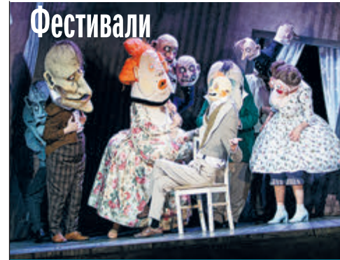
ФОТО ФЕСТИВАЛЯ «БАЛТИЙСКИЙ ДОМ»

Мы справедливо негодуем, когда на Западе пытаются отменить великую русскую культуру. Печально, что часть современной русской культуры пытаются отменить в самой России. ■