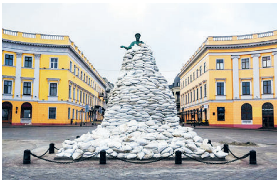
Одесса, осень 2022-го.

А там, глядишь, успеют снести и памятник Пушкину на Приморском бульваре, установленный одесситами в 1889 году на собственные средства. В Киеве-то памятник поэту скинули буквально на днях. И как быть с Оперным театром, построенным по проекту знаменитых венских архитекторов Фельнера и Гельмера? Он ведь занимает то же место, что и первый городской