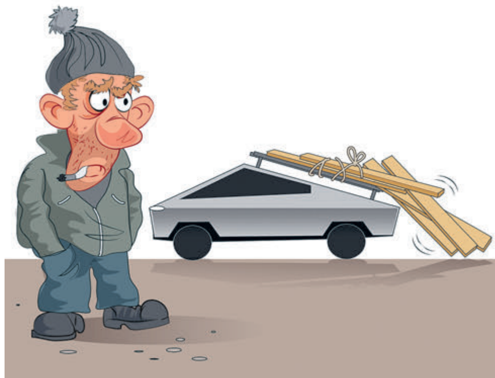
ИЛЛЮСТРАЦИЯ САШИТАУРА. RU

Тем же путем поехал столичный завод «Москвич», старательно скрывающий «поднебесное» происхождение электрических кроссоверов Sehol E40X, которые должны быть собраны здесь в количестве 200 штук не позднее декабря (и еще 400 бензиновых Sehol X4). А в новом году и «АвтоВАЗ» обещает добавить «небольшое количество электрокаров на основе универсала Lada Largus». Собрать их будут в Ижевске – и тоже с китайской начинкой. Вот и петербургский Nissan после ухода из России ма-