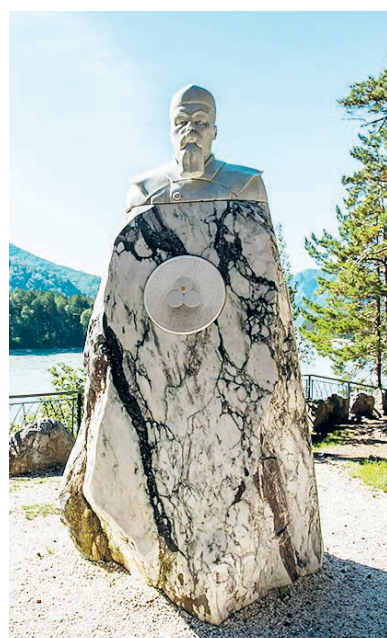
Парк Н. Рериха на реке Катунь.