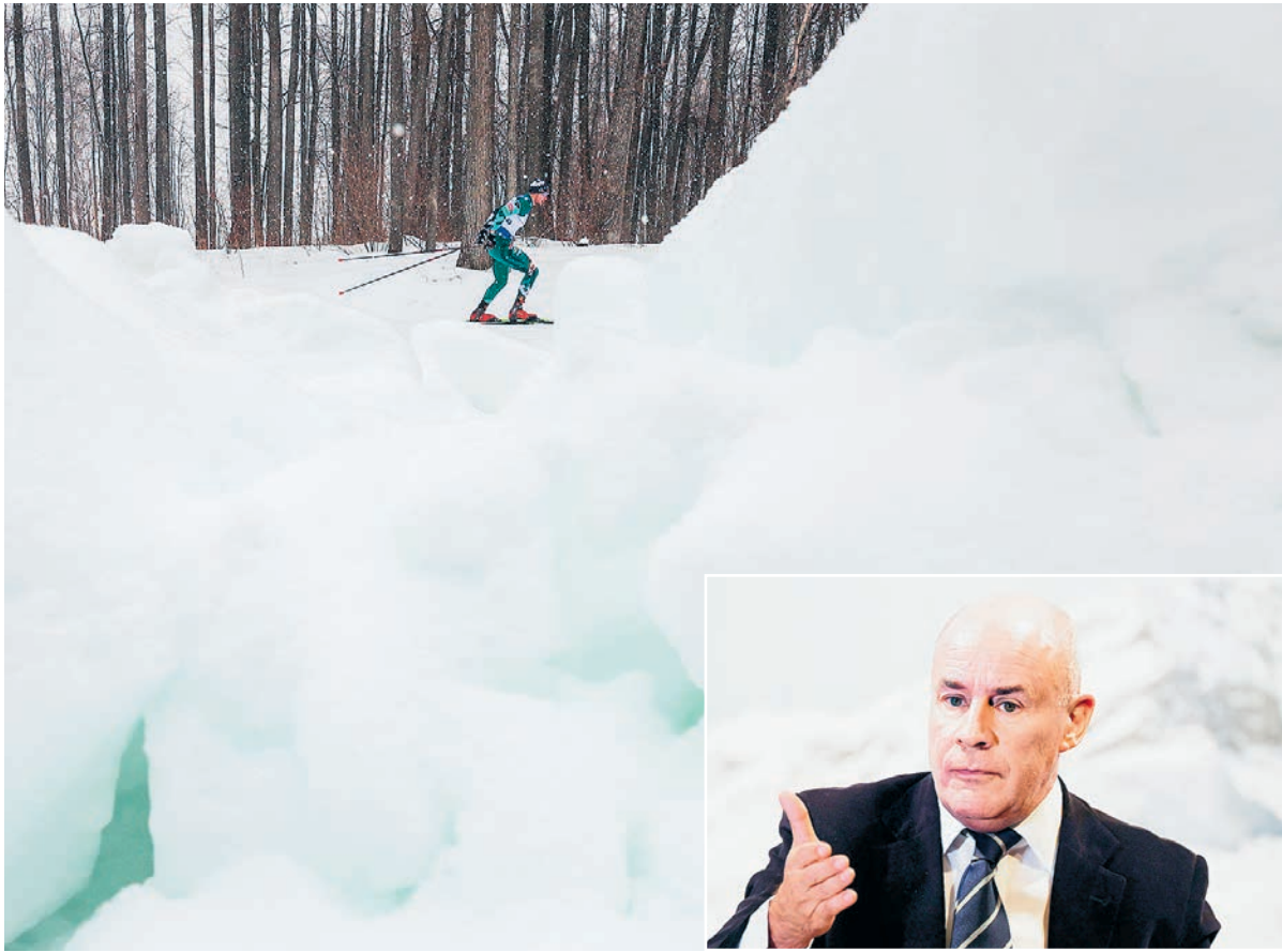
Глава FIS Юхан Элиаш россиянам сочувствует, но помочь пока ничем не может.

Международная федерация FIS не называет, какие именно страны как проголосовали и даже не сообщает количество за и против. Нет ясности и по какому принципу отбирались сотрудники FIS для голосования. То есть учитывались ли мнения только членов президиума, или разных комиссий при FIS, или же вообще всех членов международной федерации. Но, несомненно, против наших выступили представители Украины, Швеции, Норвегии, Финляндии, Чехии, Польши и стран Балтии. Лыжники, тренеры, спортивные чиновники и журналисты из этих стран не стесняются публично требовать запретов на допуск россиян. Более того, представители этих стран уже не раз заявляли о своей готовности выйти из FIS, если россияне к официальным стартам все-таки допустят. И все это несмотря на то, что руководством федерации перед голосованием проводило определенную примирительную работу: неоднократно выпускались официальные публичные заявления, суть которых в том, что мировой спорт должен служить сближению атлетов из конфликтующих государств, а