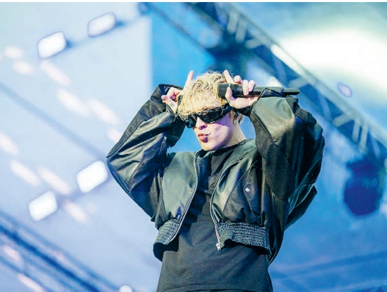
Егор Крид в образе.

Мне кажется, «в консерватории надо что-то подправить»: если Крид – заслуженный артист Башкортостана, то осталь-