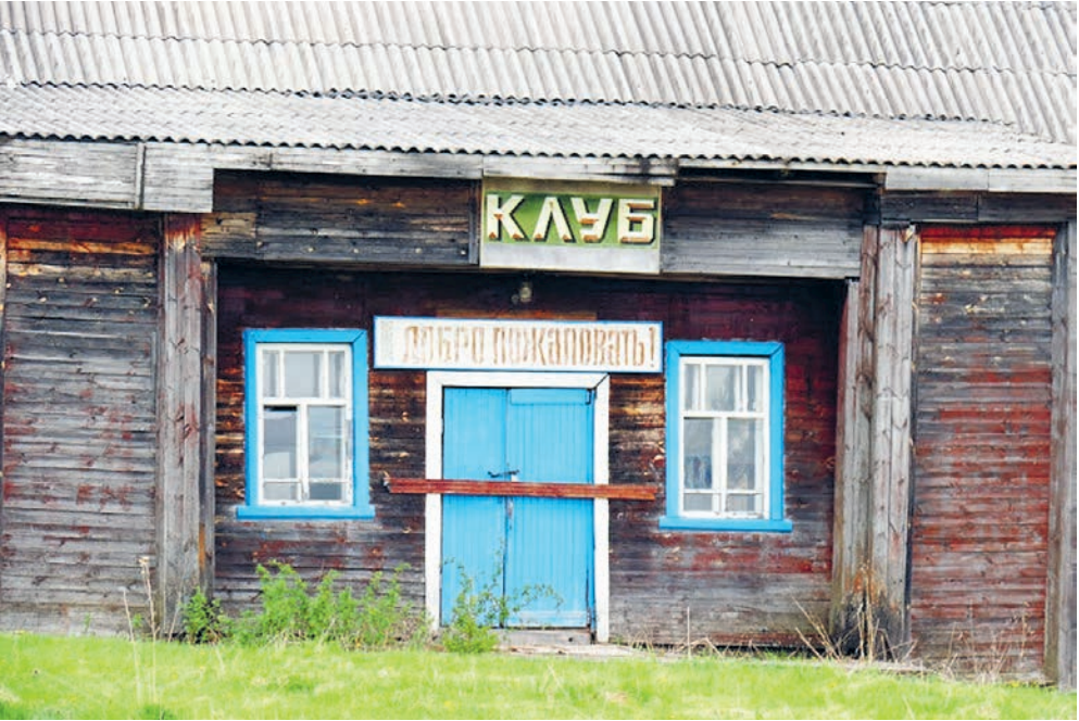
Здесь когда-то кипела жизнь...