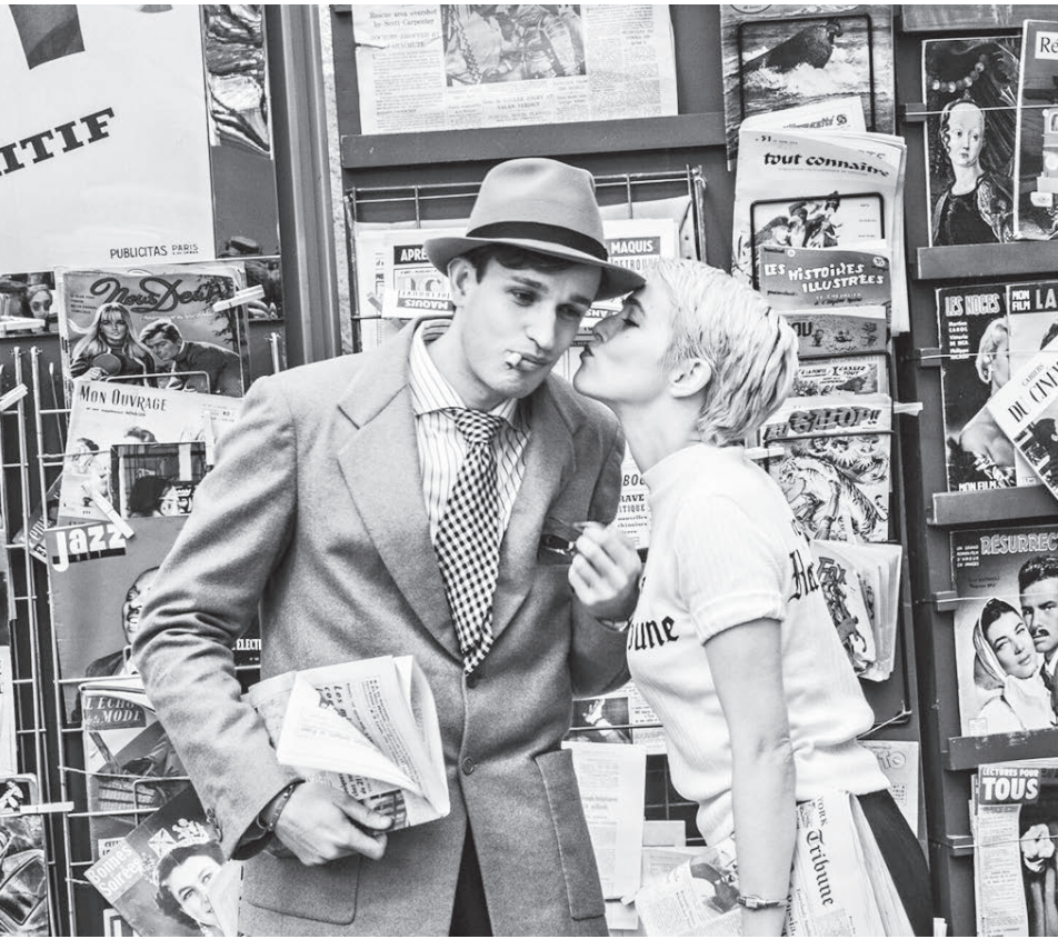
Вверху – кадр из фильма Ричарда Линклейтера «Новая волна». А внизу Жан-Поль Бельмондо и Джин Сибберг в знаменитой ленте Жана-Люка Годара «На последнем дыхании».